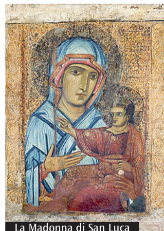
La Madonna di San Luca

eventi aperti al pubblico che si svolgono al chiuso in locali assimilabili a sale cinematografiche, sale da concerto e sale teatrali. Si segnala, tra l'altro, che a partire dal 1° maggio 2022 non è più necessario il Green Pass per le attività organizzate dalle parrocchie. Parimenti non è necessario il Green Pass per l'accesso ai luoghi di lavoro dei lavoratori e dei volontari che collaborano.