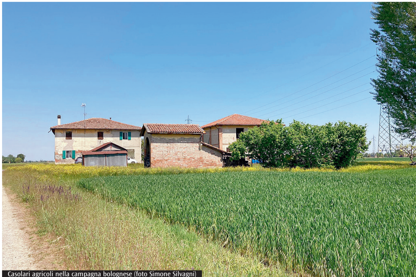
Casolari agricoli nella campagna bolognese