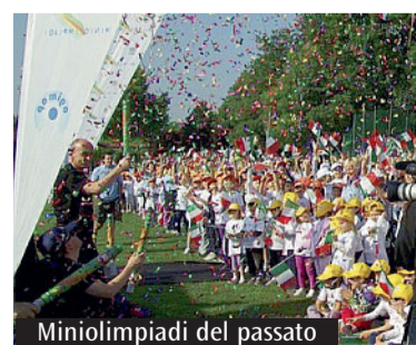
Miniolimpiadi del passato

D a oggi a domenica prossima 8 maggio si terranno alcuni eventi sportivi di rilievo anche diocesano. Oggi a Villa Pallavicini (via M. E. Lepido 196) Festa dello Sport a cura di Anspi (Associazione nazionale San Paolo Italia). Il programma prevede: alle 8 ritrovo al Punto Anspi, alle 8.30 inizio gare, alle 12 Messa, alle 14.30 inizio gare pomeridiane, alle 18.30 premiazioni. Si terranno tornei di calcio a 7 divisi per categorie e di volley misto adulti/sportoratorio. Sabato 7 maggio riprendono, dopo due anni di sosta causa pandemia, sempre a Villa Pallavicini, le Miniolimpiadi, organizzate da Agimap (Associazione genitori Maestre Pie) Italia Onlus. Infine domenica 8 si terrà il «Val di Zena bike day», evento organizzato dalla Città Metropolitana di Bologna e dai Comuni di San Lazzaro di Savena e Pianoro, con partenza alle 10 dalla parrocchia di San Lorenzo del Farneto. Per quanto riguarda le Miniolimpi-