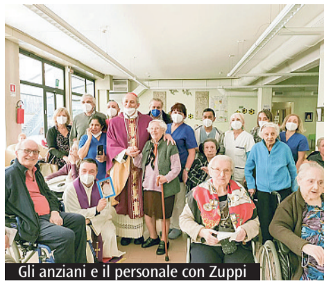
Gli anziani e il personale con Zuppi