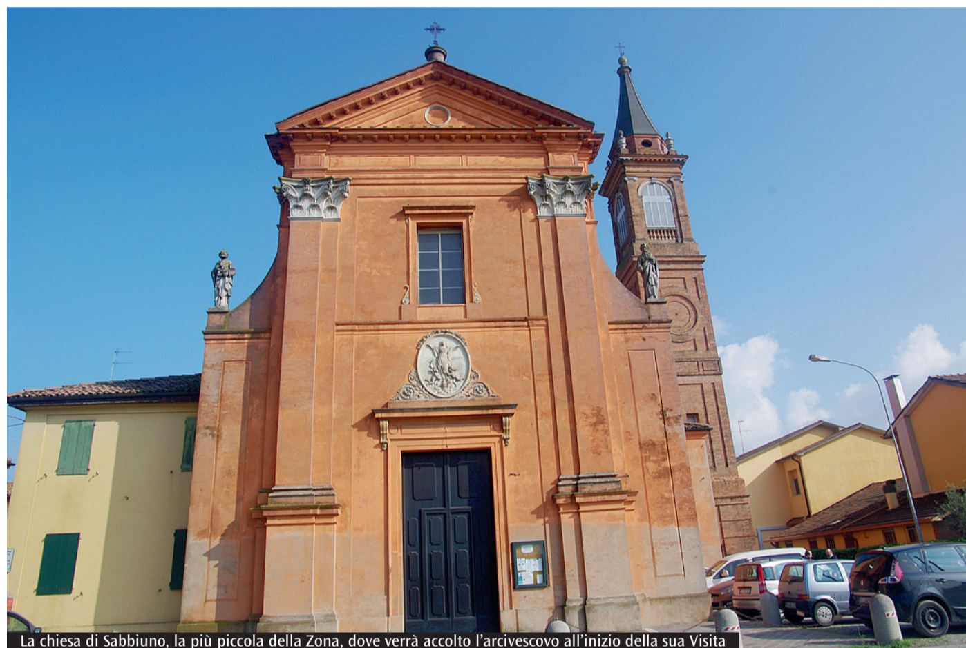
La chiesa di Sabbiuino, la più piccola della Zona, dove verrà accolto l'arcivescovo all'inizio della sua Visita