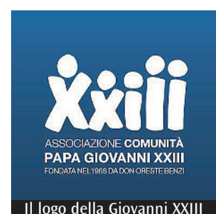
Il logo della Comunità Papa Giovanni XXIII

meri sono di poco sotto). Persone in situazione di marginalità o esclusione sociale, giovani che vogliono liberarsi dalle sostanze o adulti vulnerabili in lotta contro le dipendenze e il disagio psico-sociale, persone senza dimora, disabili, minori o nuclei familiari in difficoltà.