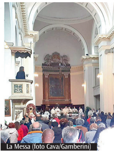
La Messa

«La resurrezione è una porta che ci spinge verso gli altri, oltre noi stessi, per costruire la Chiesa»