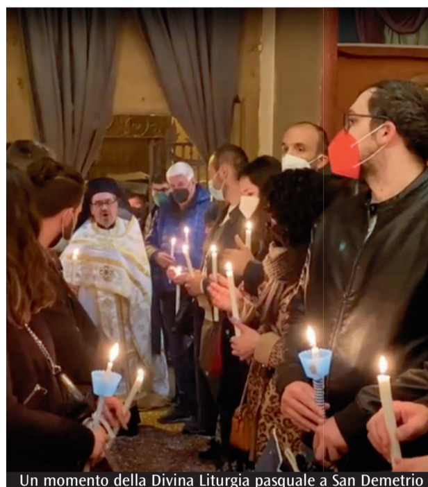
Un momento della Divina Liturgia pasquale a San Demetrio

N ell'ambito della I Decennale eucaristica unitaria che si è aperta nel settembre 2021 e che vede coinvolte le parrocchie dei Santi Antonio e Andrea di Ceretolo e di Santa Lucia di Casalecchio Reno, da ieri a domenica 8 maggio l'Immagine della Beata Vergine di S. Luca visita la comunità. Fino a mercoledì 4 è nella parrocchia di Ceretolo; la sera del 4 alle 20:30 con una processione sarà trasferita a Santa Lucia dove rimarrà fino a domenica 8. Oggi a Ceretolo Messe alle 8:30, 11:30 e 18; alle 15:30 Messa coi malati e Unzione degli infermi. Domani alle 16.30 visiterà Villa Anna Maria; martedì 3 alla stessa ora visiterà «L'Arcadia». Giovedì 5 alle 10:30 momento di preghiera nel luogo della strage del Salvemini con le famiglie delle vittime e le associazioni di volontariato. Venerdì 6 alle 10:00 visita e benedizione al Cimitero di Casalecchio. Nei giorni in cui l'Immagine sarà presente in parrocchia, la chiesa aprirà alle 7 e chiuderà alle 22.30.