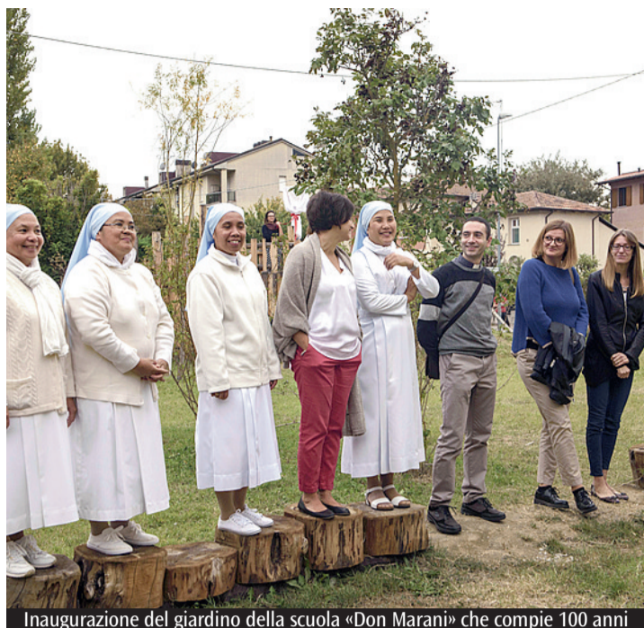
Inaugurazione del giardino della scuola «Don Marani» che compie 100 anni