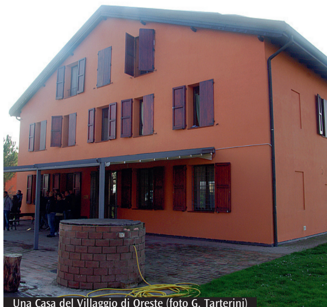
Una Casa del Villaggio di Oreste

I l «Villaggio di Oreste», cresciuto attorno alla chiesa di Santa Maria Assunta di Sabbiuino, è uno dei «Villaggi dell'accoglienza» della Comunità Papa Giovanni XXIII. Ne sono nati diversi, là dove siamo stati chiamati a vivere il nostro carisma di condivisione: in Romagna, in Piemonte, in Toscana, perfino in Bangladesh! Il proposito è lo stesso: dare sempre più risposta al grido di aiuto di tante persone in tutti i modi possibili, con le Case Famiglia ma anche altri tipi di comunità come le Comunità terapeutiche, la Capanna di Betlemme, le Case di prima accoglienza o quelle di reinserimento sociale. Camminare a fianco gli uni degli altri, sostenersi