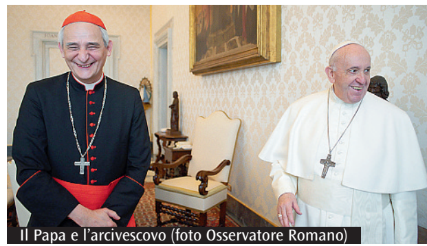
Il Papa e l'arcivescovo

camerieri e maggiordomi di palazzo sono trasteverini e gli hanno fatto festa. Chiacchierando con il segretario del Papa si è scoperto che abita nella stessa via, nello stesso palazzo dove è nato il nostro Arcivescovo! Non è stata un'udienza istituzionale, né tanto meno formale, ma nata dal desiderio di potere incontrare personalmente il Vescovo di Roma dopo cinque anni di episcopato nella Chiesa bolognese. La richiesta è stata immediatamente accolta e dopo tre giorni siamo partiti. L'Arcivescovo ha avuto la benevolenza di