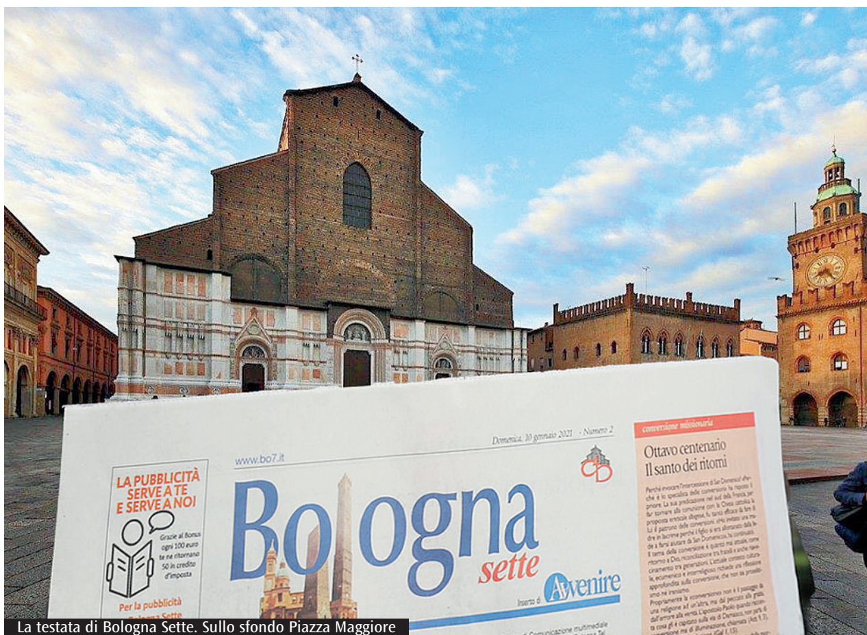
La testata di Bologna Sette. Sullo sfondo Piazza Maggiore

delle attività pastorali e amministrative. La collaborazione con le altre comunità mette in risalto le peculiarità di cui ciascuno è portatore, impedendo alla parrocchia di essere autoreferenziale. Nella «parrocchia collegata», ossia in quella nuova realtà che radunerà in un unico ente varie parrocchie lasciando intatta l'identità e la vitalità di ognuna, le piccole comunità continueranno ad offrire il riferimento spirituale, esistenziale e storico, senza essere gravate dal peso degli adempimenti burocratici e amministrativi che derivano dall'essere un autonomo ente giuridico. Nell'uno e nell'altro caso il ministero del presbitero è serenamente inserito in un ritmo leggero di rapporti personali e di