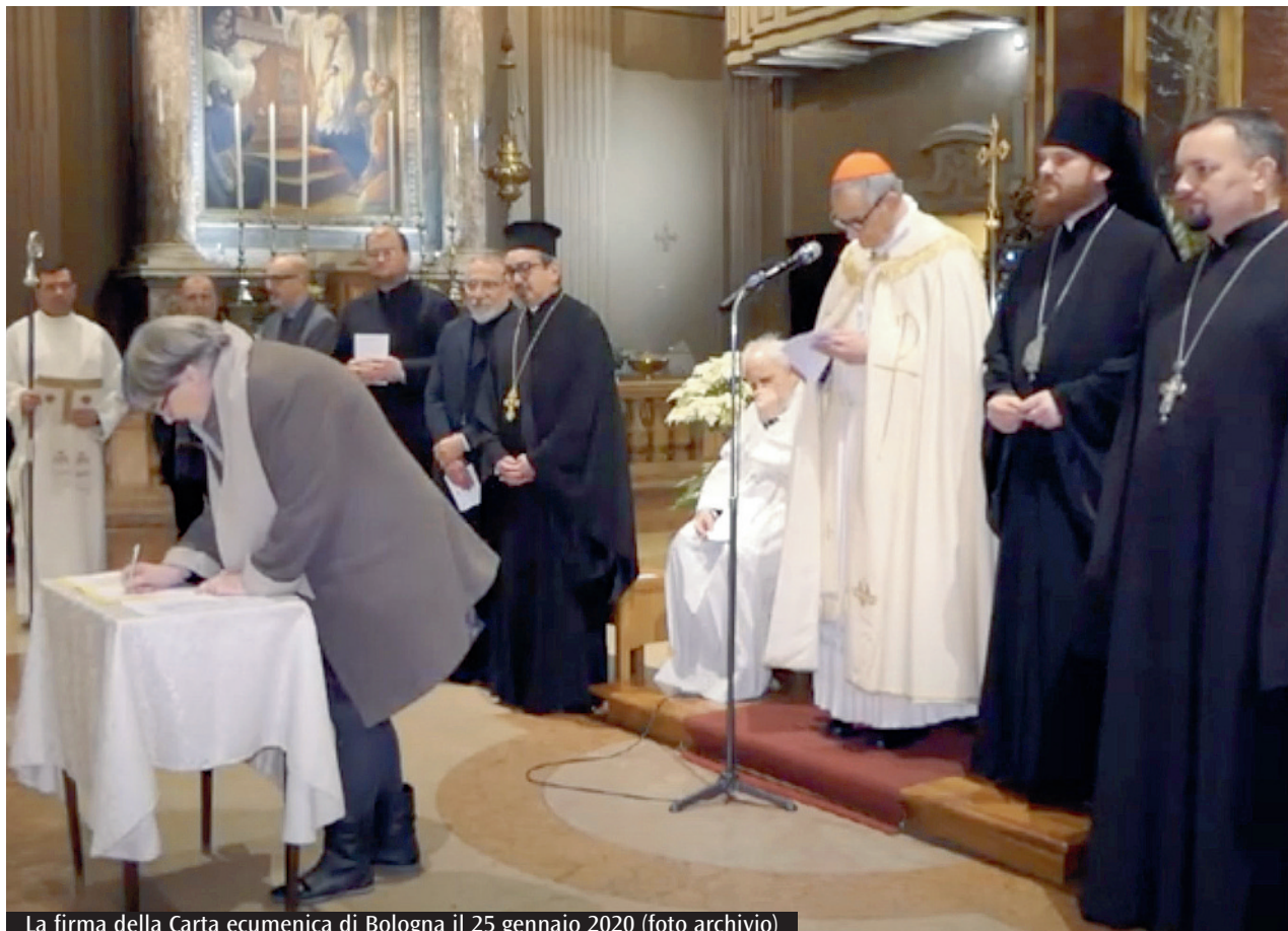
La firma della Carta ecumenica di Bologna il 25 gennaio 2020

eredità troviamo anche la divisione delle Chiese. Il secondo momento è dedicato all'unità visibile dei cristiani. Si legge nel libretto: «Per la sua parola portiamo frutto. Come persone, come comunità, come Chiesa desideriamo unirci a Cristo per il conservare il suo comandamento di amarci gli uni gli altri come lui ci ha amati». Il terzo momento è dedicato all'unità di tutti i popoli e con il creato. Sebbene come cristiani noi dimoriamo nell'amore di Cristo, viviamo anche in una creazione che geme mentre attende di essere liberata (cfr Rm 8). Nel mondo siamo testimoni del male provocato dalla sofferenza e dal conflitto. Mediante la solidarietà con coloro che soffrono permettiamo all'amore