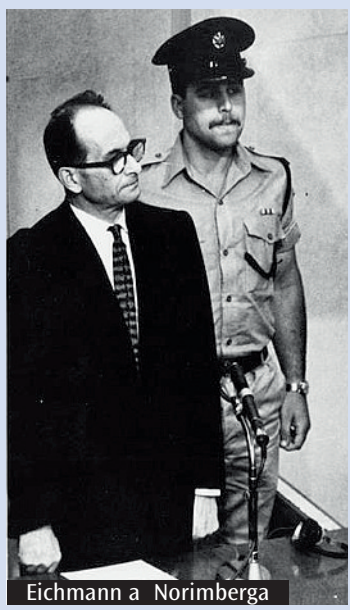
Eichmann a Norimberga

ricordare il sessantesimo anniversario del processo Eichmann: il soldato tedesco processato per primo in Israele, per crimini contro l'umanità. Certo niente di biblico e neppure di immediatamente religioso, ma un importante segnale di consapevolezza. Una storia e un linguaggio religioso non sorvegliato hanno offerto linguaggio a folle razziste, permettendo loro di diffondersi, perché inizialmente non distanti dal comune sentire sugli ebrei. La storia ci aiuta a comprendere l'importanza delle fedi e delle sue espressioni. Questo per rinforzare il senso di fraternità del cristianesimo con ebraismo, ricordando l'olivo buono dal quale nasciamo».