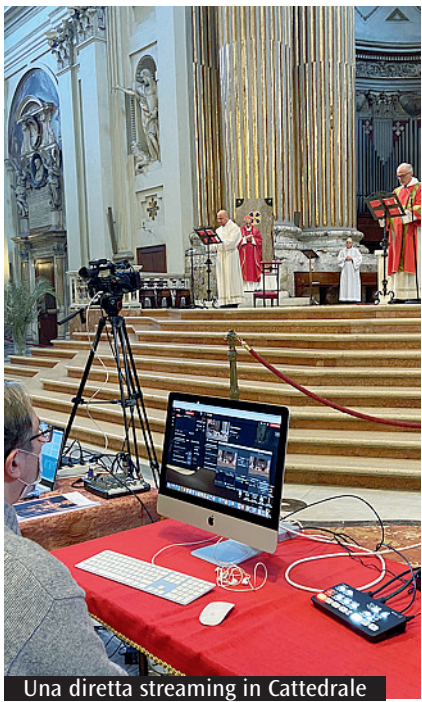
Una diretta streaming in Cattedrale