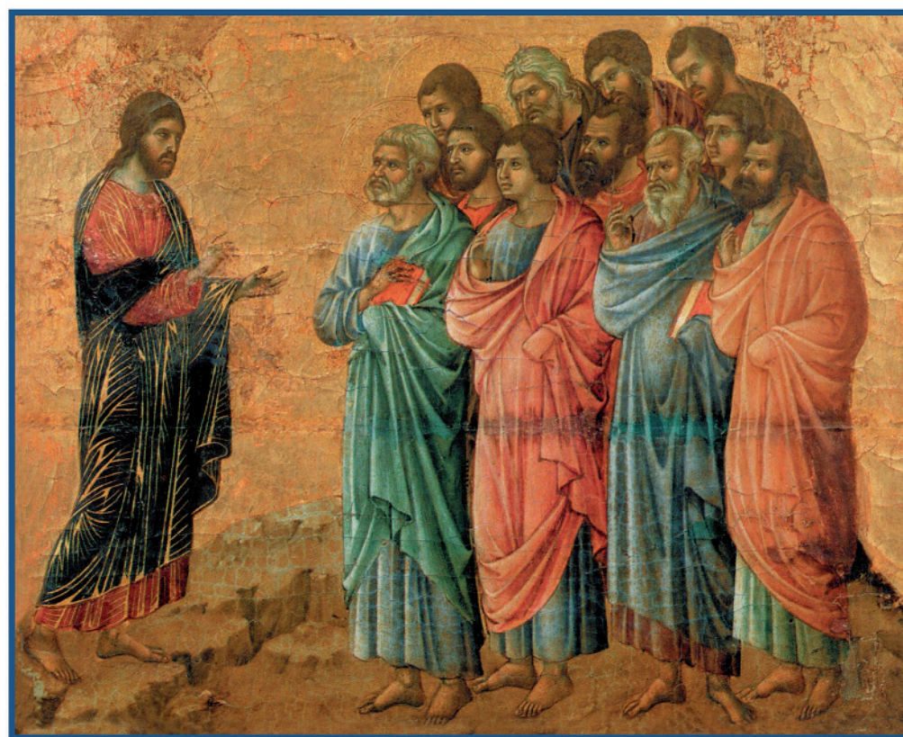
Disegno di Buonvicino - La Maresca del Duomo di Siena, part. Appuntatore al Cristo sui monti della Galliera (1311)

Rimanete nel mio amore: produrrete molto frutto (cfr Giovanni 15, 5-9)