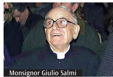
Monsignor Giulio Salmi

Ad un secolo dalla nascita di monsignor Giulio Salmi, il cardinale Matteo Zuppi presiederà una Messa a Villa Pallavicini giovedì 21 gennaio alle 18.30. «In questa occasione - commenta don Massimo Vacchetti, successore di don Salmi alla guida di Villa Pallavicini - mi preme ricordare la centralità, in questo particolare momento storico, del Villaggio della Speranza. Si tratta dell'ultima opera in ordine cronologico nata dall'intuito pastorale di don Giulio. La pandemia ha fatto emergere tutta la profezia di questo luogo. Soprattutto durante il primo "lockdown" qui abbiamo sperimentato come il Villaggio non significhi solo un tetto a condizioni economiche