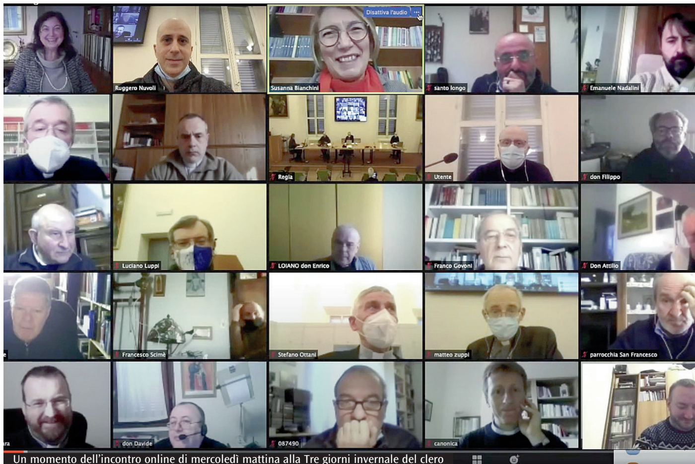
Un momento dell'incontro online di mercoledì mattina alla Tre giorni invernale del clero