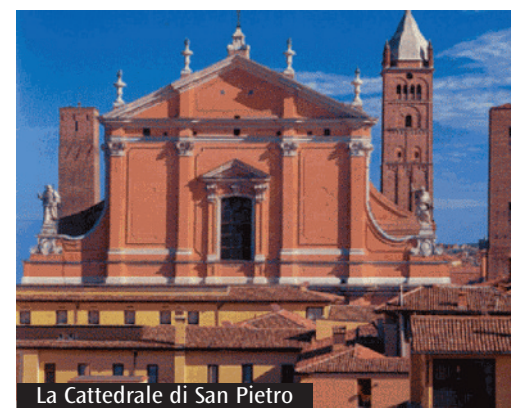
La Cattedrale di San Pietro