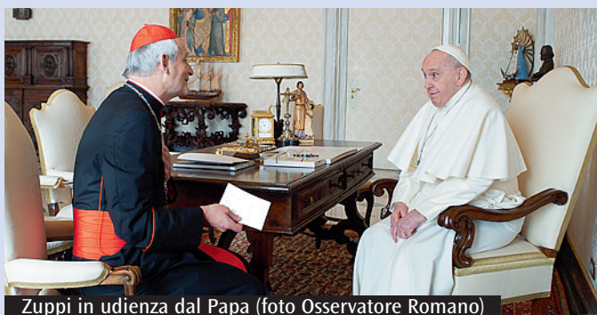
Zuppi in udienza dal Papa