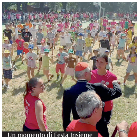
Un momento di Festa Insieme

Giovedì mattina in Seminario l'incontro dell'arcivescovo con migliaia di animatori e ragazzi dalle parrocchie della diocesi