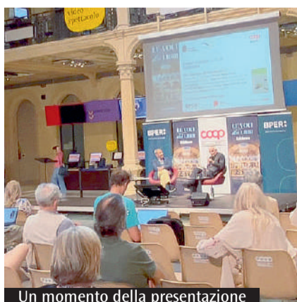
Un momento della presentazione

Le suore Serve di Maria di Galezza invitano alla festa del loro fondatore, il beato Ferdinando Maria Bacchileri, che si terrà a Galezza Pepoli mercoledì 1 luglio. In preparazione, due momenti. Domenica 28 si terrà una Camminata di 9 chilometri, aperta a tutti, da Galezza a Campodoso (Modena), luogo di nascita del beato. Tema: «Signore, cosa vuoi che io faccia? In cammino sui passi del beato Bacchileri». Programma: alle 6.15 preghiera sul sagrato della chiesa di Galezza, alle 6.30 partenza, alle 9.30 arrivo alla chiesa di Reno Finalese, alle 10 Eucaristia, alle 11.30 partenza per la Casa natale del beato e alle 12.15 arrivo previsto. In caso di maltempo, ritrovo alle 10 a Reno Finalese per la celebrazione. Per adesioni e info: Centro di spiritualità F. M. Bacchileri telefono 3508063760; Bonora Antonio, telefono 331128372, Vecchi Cleto, telefono 3420425908. Lunedì 29 giugno alle 20.30 nel Teatro del Centro, riflessione su «Vangelo per i tempi bui» con Marina Marcolini, scrittrice e docente universitaria.