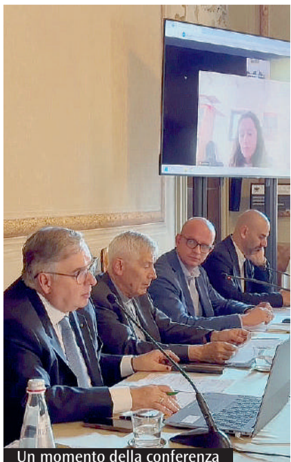
Un momento della conferenza

G iovedì 25 alle 21 nel Cortile dell'Archiginnasio, nell'ambito di «Pianofortissimo & Talenti», debutto a Bologna per Andrea Vanzo, pianista, compositore e produttore musicale, nato nel 1989 a Sadurano nell'Appennino tosco-emiliano, fonte inesauribile d'ispirazione per la sua poetica ricca di suggestioni. Laureato al Conservatorio G.B. Martini di Bologna, perfezionatosi a Roma e Milano, è tra i più interessanti interpreti del genere modernclassical. In programma «Intimacy Vol.2». Domani alle 21, stesso luogo, si esibirà sempre al pianoforte il giovane bielorusso Uladzislau Khandohi, nato nel 2001, con musiche di Chopin, Liszt e Rachmaninov.