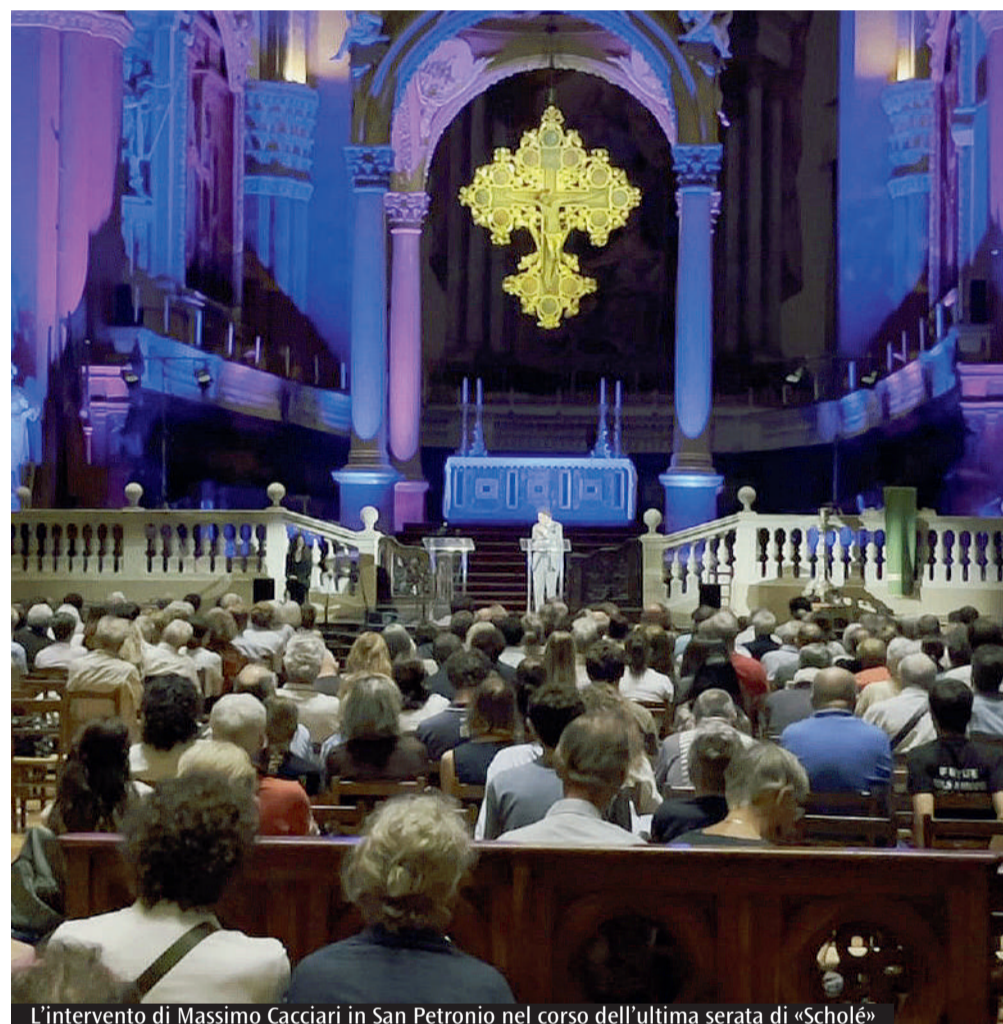
L'intervento di Massimo Cacciari in San Petronio nel corso dell'ultima serata di «Scholè»

Questo è il problema del nuovo ordine globale, che si pensava potesse realizzarsi sulla base della stessa potenza tecnico-scientifica, ma si constata che non è così perché lo sviluppo delle tecnologie è parte di volontà di potenze statuali o imperiali e non è discernibile da loro. O c'è, quindi, una politica che mira all'intesa, al compromesso, alla pace, attraverso tutte le operazioni politico-diplomatiche e nella comprensione dei reciproci interessi, oppure, se la politica è volta soltanto ad affermare la propria egemonia, ci sarà la catastrofe globale o la guerra infinita permanente. Sembra che le