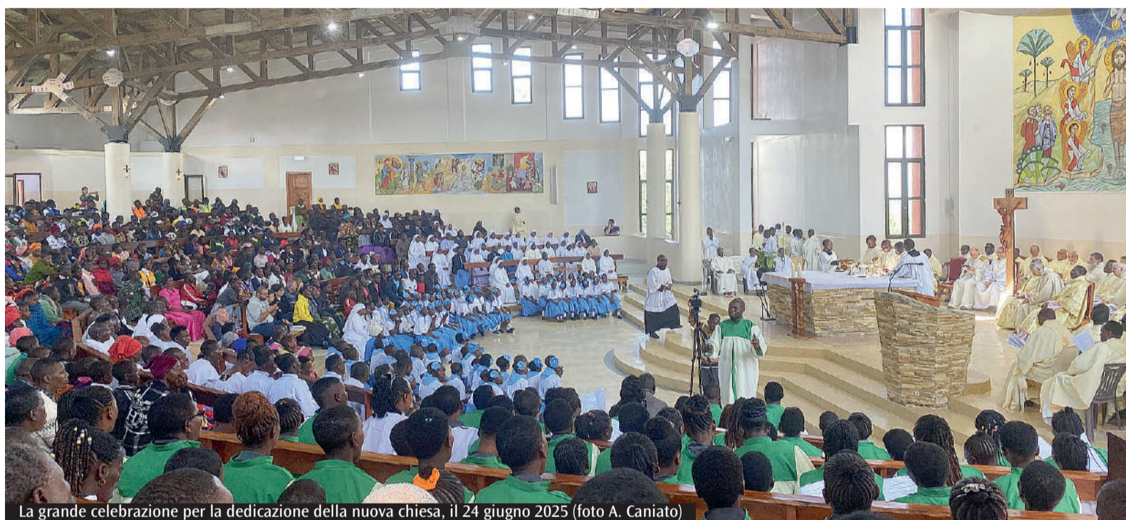
La grande celebrazione per la dedizione della nuova chiesa, il 24 giugno 2025