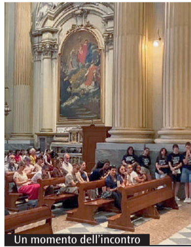
Un momento dell'incontro

Zuppi: «La richiesta di aiuto per una prova nasconde una domanda più profonda, sulla vita»