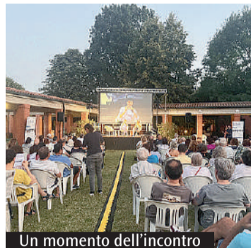
Un momento dell'incontro

bin Gesù) o negli ospedali psichiatrici è troppo vivo per essere solo materia narrativa. Proprio grazie a quel dolore, Mencarelli capisce che non è una condanna, ma un luogo in cui può accadere un incontro. La sua conversione non è un atto di volontà, ma un cedimento alla possibilità che Dio esista davvero e che si manifesti proprio dove tutto sembra perduto.