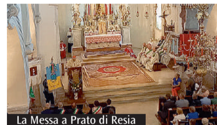
La Messa a Prato di Resia

la vicinanza di migliaia di persone. La solidarietà nasce dalla compassione per una sofferenza terribile, che annichiliva e sfiniva, accompagnata sempre da tanta dignità. La compassione è come un gemellaggio personale e