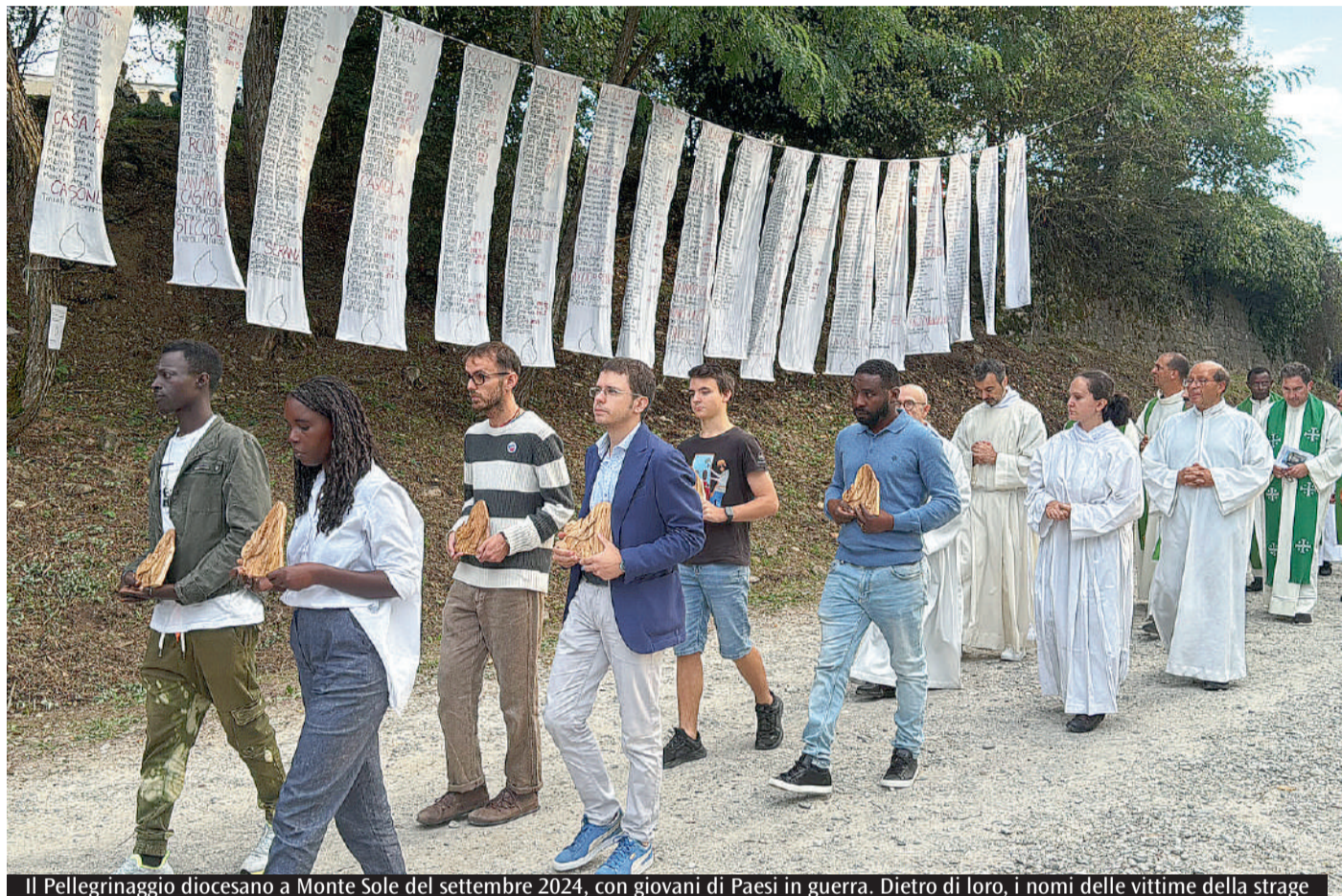
Il Pellegrinaggio diocesano a Monte Sole del settembre 2024, con giovani di Paesi in guerra. Dietro di loro, i nomi delle vittime della strage