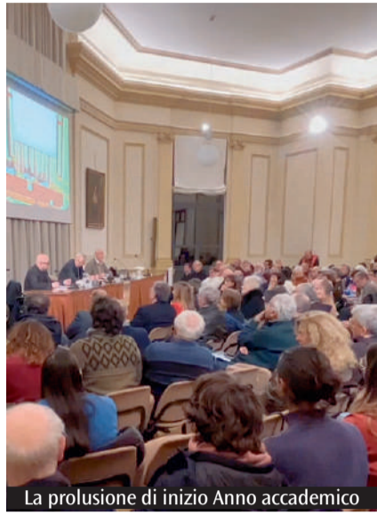
La prolusione di inizio Anno accademico

Sono tante le forme di assistenza e servizio che possono essere messe in campo anche attraverso l'erogazione dei fondi 8xmille. Contributi di assistenza fondamentali sono anche quelli dedicati all'approfondimento culturale e alla formazione. Di queste erogazioni beneficia anche la Facoltà teologica dell'Emilia-Romagna (Fter), istituzione accademica ecclesiastica abilitata a conferire i titoli accademici in Sacra Teologia e in Scienze religiose, la cui sede è ospitata nel complesso del Convento di San Domenico, al civico 13 dell'omonima piazza nel cuore di Bologna. Suddivisa in tre Dipartimenti - Teologia dell'evangelizzazione, Teologia sistematica e Storia della teologia - la Fter, relativamente agli studi teologici, propone quattro percorsi accademici: quello triennale e quinquennale del Baccalaureato,