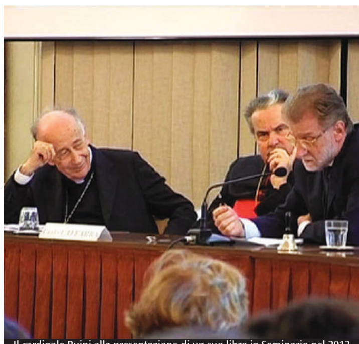
Il cardinale Ruini alla presentazione di un suo libro in Seminario nel 2013