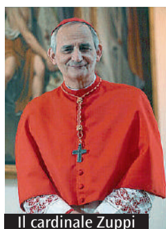
Il cardinale Zuppi

DOMENICA 28 Alle 18 nella parrocchia della Beata Vergine Immacolata, Messa e visita alla parrocchia.