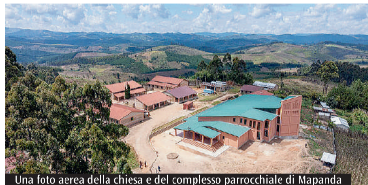
Una foto aerea della chiesa e del complesso parrocchiale di Mapanda