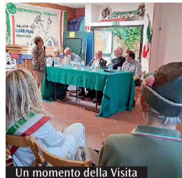
Un momento della Visita

Il 24 giugno, festa del patrono san Giovanni Battista, la parrocchia in Tanzania dove si trovano missionari bolognesi festeggerà il primo anniversario della dedizione