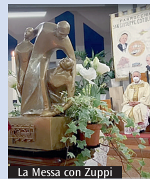
La Messa con Zuppi