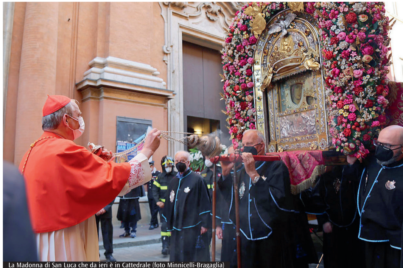
La Madonna di San Luca che da ieri è in Cattedrale