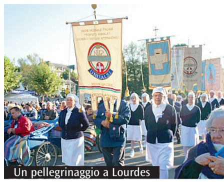
Un pellegrinaggio a Lourdes

L'Unitalsi riparte con gioia nella sottosezione di Bologna ripercorrendo nelle scuole della città metropolitana le tappe più significative della sua storia con un video ma anche con gli incontri presso alcune scuole secondarie, per promuovere il nuovo concorso rivolto ai ragazzi delle scuole di ogni ordine e grado, incentrato sul creare scritti, immagini o brani musicali sulla Madonna di San Luca. L'associazione a promozione e sostegno dei malati e dei sofferenti vede nei ragazzi una linfa vitale, una possibilità di esperienza umana e sociale: per loro e per le loro famiglie sono stati messi in palio, in collaborazione con l'Ufficio pastorale scolastica della diocesi, un soggiorno a Lourdes e (per i più piccoli) a Loreto. La vera forza dell'Unitalsi è e rimane il pellegrinaggio. I giovani sono fondamentali, permettono all'associazione di vivere appieno la gioia del dono e