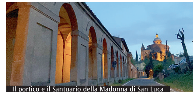
Il portico e il Santuario della Madonna di San Luca