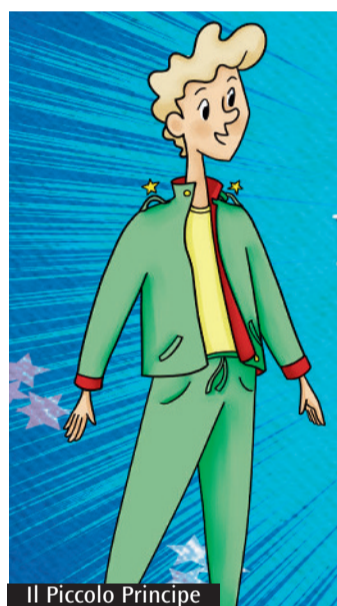
Il Piccolo Principe