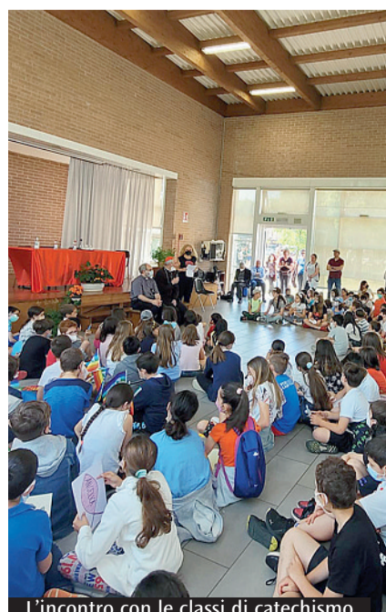
L'incontro con le classi di catechismo

L'immagine della rete è un simbolo potente che contiene molteplici significati: la rete è ciò che permette al pescatore di raccogliere i pesci, segno del desiderio di Dio di raccogliere insieme tutti i suoi figli. E quindi è anche quella che permette di tenere i contatti con gli altri, di avere delle relazioni. Anche la Chiesa è rete! Sabato mattina le famiglie e i bambini del catechismo si sono