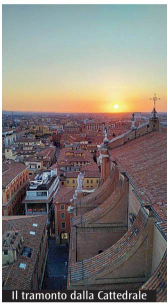
Il tramonto dalla Cattedrale

Preghere e camminare di notte per le vie e le chiese di Bologna. Lo si potrà fare insieme, nel Pellegrinaggio «Andò da Gesù di notte», che si terrà il 1 giugno. A partire dalle 21.30 l'appuntamento sarà in Cattedrale, con accesso dall'ingresso di Via Altabella 6: il Cardinale Zuppi introdurrà il primo momento di preghiera. Il cammino, organizzato dall'Ufficio Diocesano per la Pastorale dello sport, turismo e tempo libero e dall'Ufficio Diocesano per la Pastorale vocazionale, si dispiegherà in otto tappe attraverso le chiese di Bologna: a partire dalla basilica di San Petronio si passerà alla chiesa dei Santi Vitale e Agricola per poi proseguire verso le basiliche di Santo Stefano e San Domenico, il santuario del Corpus Domini e poi, ancora, la chiesa del Santissimo