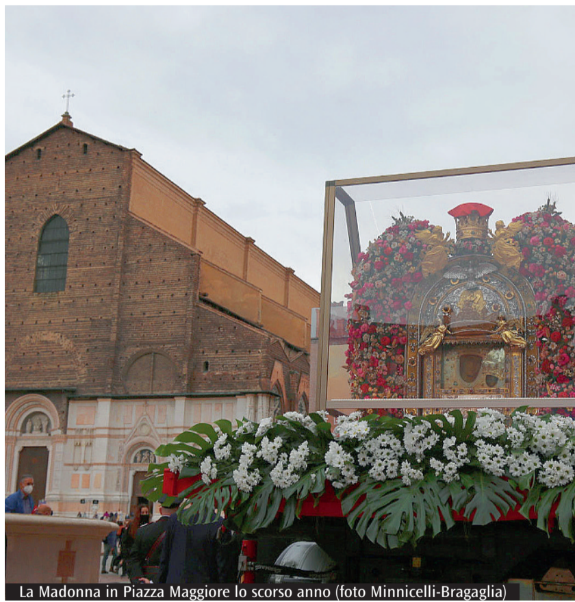
La Madonna in Piazza Maggiore lo scorso anno