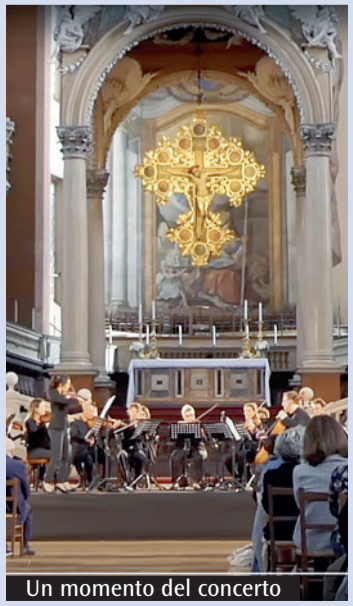
Un momento del concerto

mi manca tantissimo. Penso manchi tantissimo anche alla musica. Abbiamo scelto Emergency proprio per la stima reciproca che legava Ezio e Gino Strada». All'ingresso è stato chiesto ai partecipanti una donazione a favore dell'emergenza ucraina. «È stato un uomo - ha detto il cardinale Zuppi - che ha regalato tanto: arte e passione. Soprattutto ci ha insegnato a combattere la fragilità e la debolezza. Abbiamo bisogno di esempi come lui che ci aiutino a scoprire come la fragilità possa diventare un modo per comunicare ancora di più. Lui vedeva l'Europa come una sinfonia. In questo periodo di guerra e di divisione la sua musica, in questo momento, rappresenta anche un messaggio di pace». (A.C.)