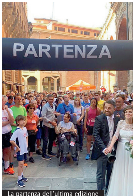
La partenza dell'ultima edizione

Il sito www.chiesadibologna.it è costantemente aggiornato con le immagini, la cronaca e i testi relativi alle celebrazioni della Madonna di San Luca. Per l'intera settimana di permanenza della Madonna di San Luca in città vi sarà la diretta streaming sul sito dell'Arcidiocesi www.chiesadibologna.it e sul canale YouTube di "12Porte". Le Messe delle ore 10.30 di domenica 22 e domenica 29 saranno trasmesse anche in diretta da ETV-Rete7 (canale 10 del digitale terrestre) e da Nettuno Tv (canale 111 del digitale terrestre) che trasmetterà pure gli appuntamenti settimanali in Cattedrale. Per rimanere aggiornati sulle iniziative diocesane e ricevere notizie è possibile iscriversi alla newsletter sempre sul sito diocesano. Bologna Sette, in collaborazione con Avenire, avrà una distribuzione promozionale durante tutta la settimana.