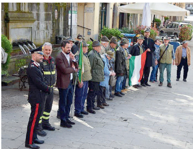
A sinistra i carabinieri, i pompieri e gli alpini riuniti a Castiglione dei Pepoli per l'accoglienza dell'Arcivescovo. A sinistra i Vesperi nella chiesa di San Lorenzo con il sindaco e le autorità.

La cronaca degli incontri dell'Arcivescovo con le comunità, le parrocchie, gli enti e le associazioni del territorio, avvenuti tra giovedì 16 e domenica 19 aprile