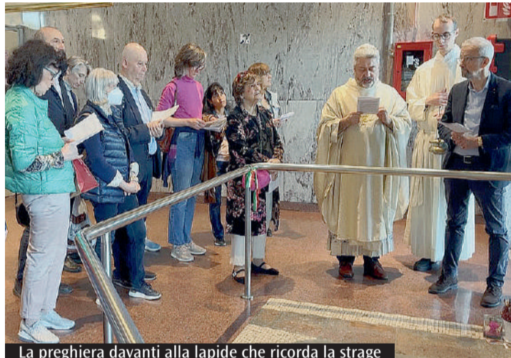
La preghiera davanti alla lapide che ricorda la strage