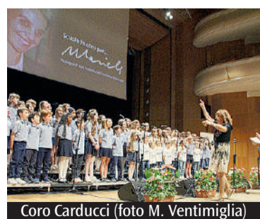
Coro Carducci

formato dagli insegnanti delle scuole aderenti al progetto musicale «Tieni il Tempo con Mariele. Educare al rispetto con la musica», ideato da Gaudenzi e rivolto alle scuole primarie di tutta Italia. Numerose le autorità presenti, che hanno espresso apprezzamento per il valore educativo della rassegna: il consigliere regionale Vincenzo Paldino,