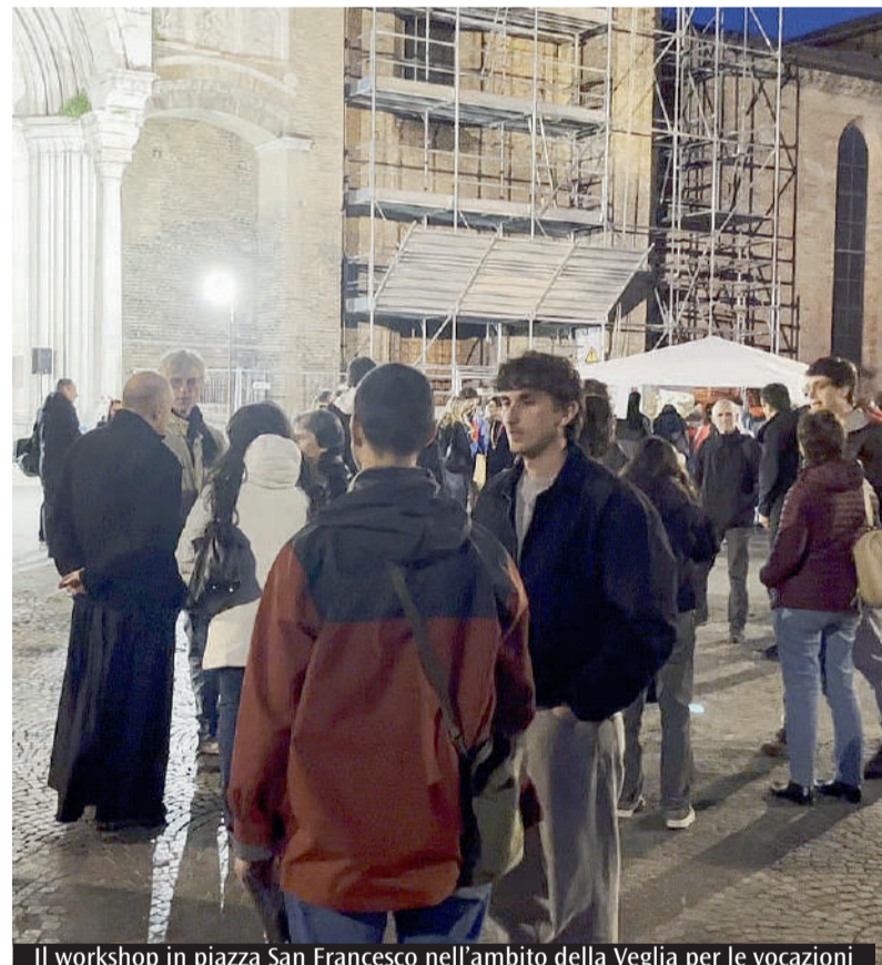
Il workshop in piazza San Francesco nell'ambito della Veglia per le vocazioni