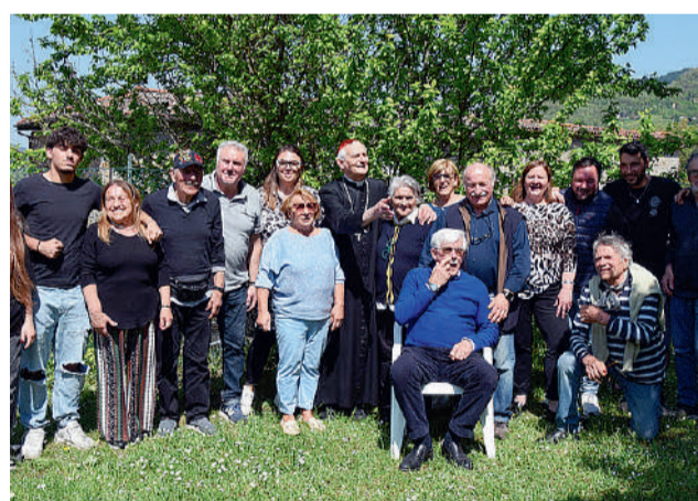
Nelle tre foto alcuni momenti dei tanti incontri con l'Arcivescovo durante la Visita pastorale a Castiglione dei Pepoli. Sopra al centro, davanti alla chiesa di Confienti