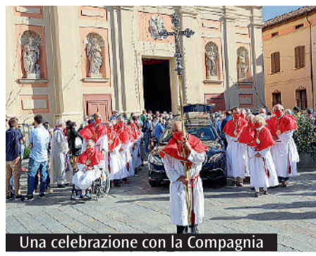
Una celebrazione con la Compagnia

Il gruppo ha riproposto con un testo illustrato la vita della comunità parrocchiale attraverso un lustrò della propria vita, ritmato dai Giubilei 2000, 2013 e 2025.