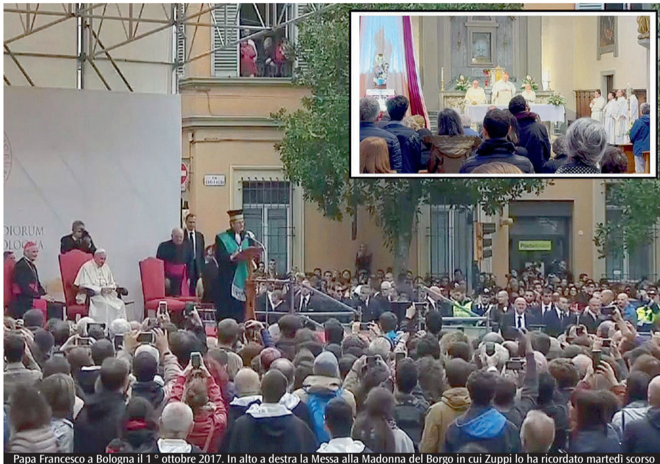
Papa Francesco a Bologna il 1° ottobre 2017. In alto a destra la Messa alla Madonna del Borgo in cui Zuppi lo ha ricordato martedì scorso