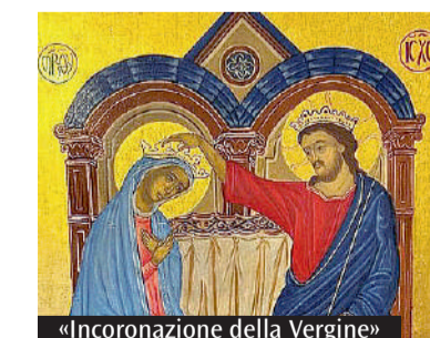
«Incoronazione della Vergine»

sto è tanto, ma poi ci attira e ci provoca alla riflessione perché in essa i fatti del Vangelo sono narrati «a strati» che ci invitano a meditare e ad approfondire l'esperienza che facciamo e il riverbero che suscita in noi. C'è un primo strato superficiale che rappresenta l'immagine; poi scopriamo un particolare, un colore, una forma, un accostamento di colori e immagini che ci porta ad una riflessione più profonda, ad una meditazione più sentita sul fatto narrato. L'icona ci porta sempre su un piano diverso, un piano parallelo a quello che viviamo perché ci conduce sempre a vedere con gli occhi del Mistero». Le icone, sapientemente spiegate una per una nei pannelli della mostra, sono quindi «finestre sul Mistero» e sottolinea l'iconografo, «parlano al cuore di chi le