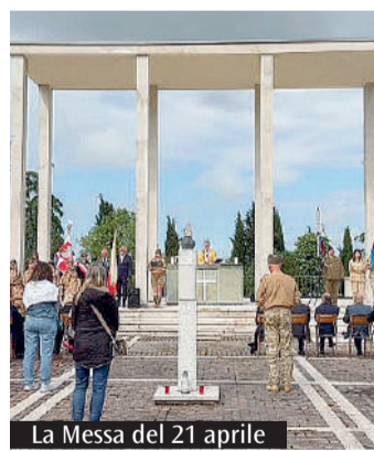
La Messa del 21 aprile

Il 21 aprile la comunità cattolica del Paese i cui combattenti entrarono per primi a Bologna si è ritrovata nel Cimitero di guerra per la Messa in suffragio di tutti i caduti