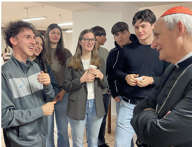
Sotto, la Via Crucis presso la chiesa di San Martino in Casola A destra, la Messa conclusiva nella chiesa della Beata Vergine del Rosario a Calderino A sinistra, l'arcivescovo in compagnia di alcuni giovani nella Sala dei Ragazzi a Monte San Giovanni

Il diario degli incontri e delle celebrazioni del cardinale Zuppi con le comunità, gli enti e le associazioni del territorio, avvenuti tra giovedì 19 e domenica scorsa