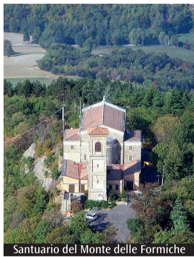
Santuario del Monte delle Formiche