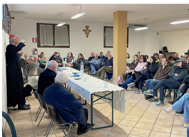
A destra, l'incontro dell'arcivescovo con l'Amministrazione comunale nella Sala consiliare. A sinistra, il dialogo tra il cardinale ed i genitori di bimbi del catechismo. Al centro, i catechisti e gli scout si confrontano con Zuppi