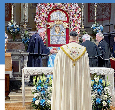
La Madonna nella chiesa di San Girolamo dell'Arcoveggio

Un fratello della seconda comunità neocatecumenale di Calderara