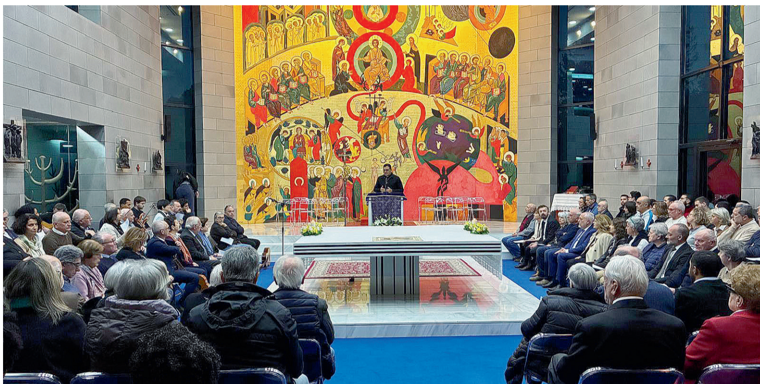
Il gruppo dei pellegrini riunito nella chiesa della Domus Galilaeae

La seconda comunità neocatecumenale di Calderara di Reno e la prima comunità del Pio Suffragio di Lugo, guidate dai loro catechisti in Terra Santa nel periodo in cui è cominciato il conflitto