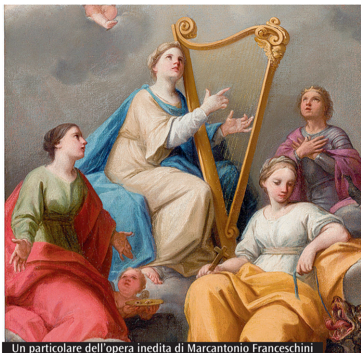
Un particolare dell'opera inedita di Marcantonio Franceschini