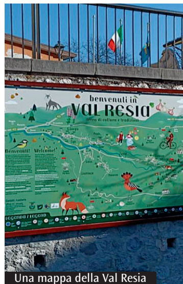
Una mappa della Val Resia

Domenica 14 giugno a Prato Val Resia si terrà un viaggio in giornata organizzato da Petroniana Viaggi e Turismo per celebrare i volontari bolognesi nel 50° anniversario del terremoto del Friuli: un'occasione di memoria, preghiera e condivisione dei ricordi di chi accorse mezzo secolo fa per aiutare la popolazione colpita. La giornata inizierà con il ritrovo alle 5.45 all'autostazione di Bologna, (pensilina 25) e la partenza verso Prato Val Resia a bordo di un pullman Gran Turismo. All'arrivo, la comunità locale accoglierà i visitatori con una cerimonia in Municipio, alla presenza del sindaco, seguita dall'arrivo del cardinale Zuppi che presiederà la Messa in memoria delle vittime del terremoto; il pranzo sarà libero,