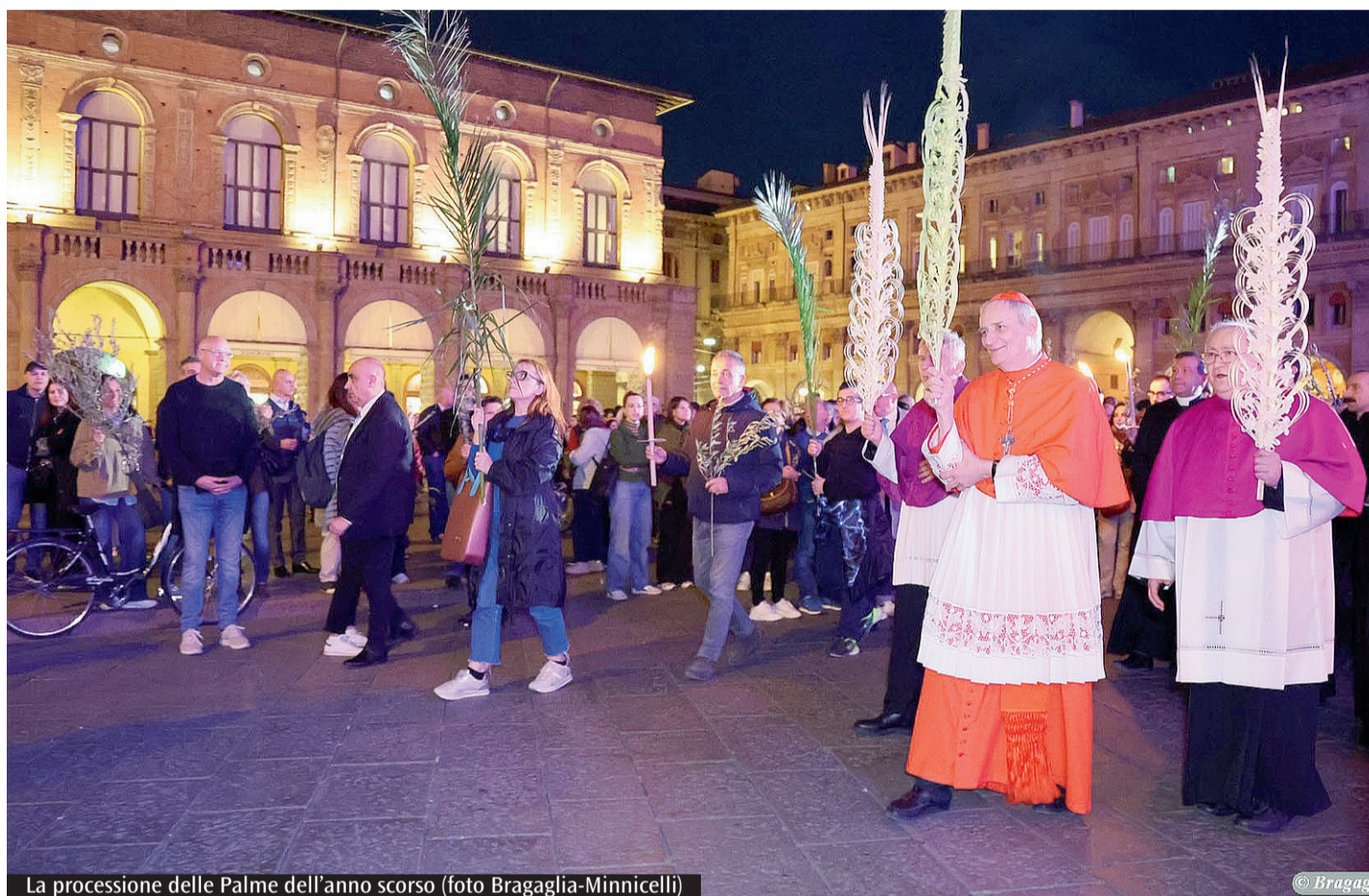
La processione delle Palme dell'anno scorso