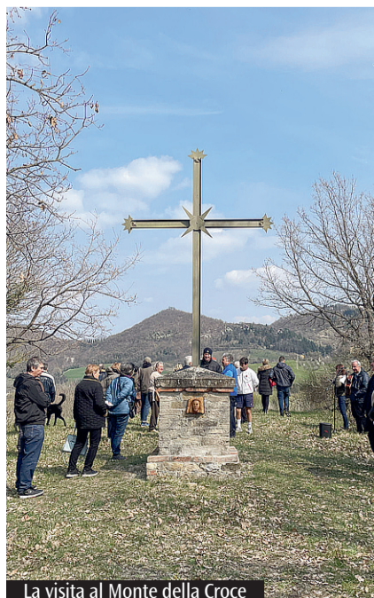
La visita al Monte della Croce