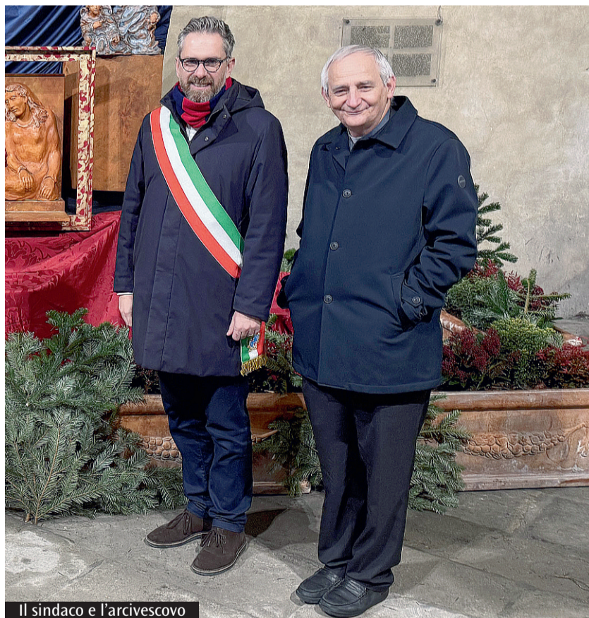
Il sindaco e l'arcivescovo

Il sindaco riflette sul momento che sta vivendo Bologna: «È in fermento»