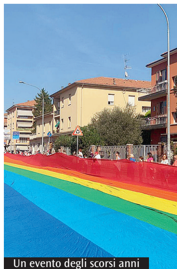
Un evento degli scorsi anni

Dal 17 al 19 aprile torna a Castel Maggiore «SconfinaMenti Festival», organizzato dalla Zona pastorale Castel Maggiore - Ambito Carità, con il titolo «La pace è partecipAZione». Un gioco di parole per sottolineare che la pace non è solo un ideale, ma un processo che richiede coinvolgimento, responsabilità e presenza attiva. Il Festival si svolgerà in diversi luoghi di Castel Maggiore, Trebbio di Reno e Funo di Argelato, trasformando spazi pubblici in occasioni di incontro, per favorire dialogo e partecipazione, con particolare attenzione alle giovani generazioni. Il programma si compone di conferenze, testimonianze e approfondimenti che affronteranno temi di grande attualità, in particolare la