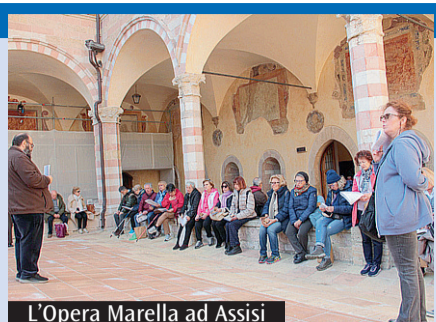
L'Opera Marella ad Assisi