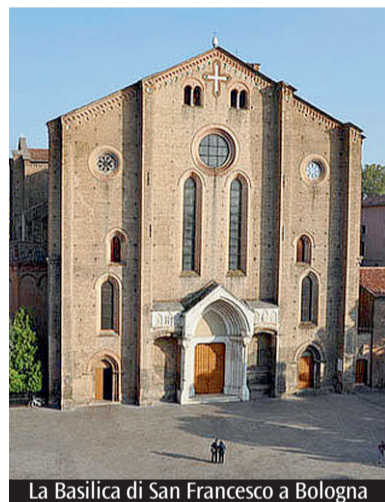
La Basilica di San Francesco a Bologna

Inizia oggi la mostra, poi lo spettacolo teatrale «Minore. San Francesco tra rima e colore», il 18 e 19 aprile