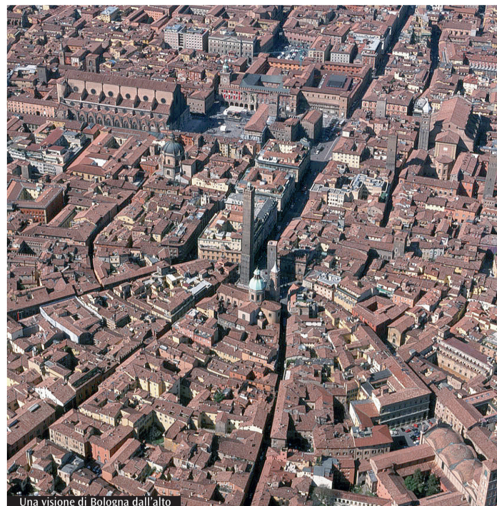
Una visione di Bologna dall'alto

University of Singularity, fondata nel 2007 e presieduta da Ray Kurzweil. Ha scritto Max More nel Manifesto del 2003: «Noi mettiamo in questione il carattere inevitabile della vecchiaia e della morte, cerchiamo di migliorare progressivamente le nostre capacità intellettuali e fisiche, sviluppandole anche sul piano emozionale. Vediamo l'umanità come una fase di transizione nello sviluppo evolutivo». L'umanità è dunque solo una fase di passaggio! Gli fa eco Nick Bostrom, filosofo di Oxford, quando scrive: «Usciremo dall'infanzia dell'umanità per entrare nell'era postumana. La medicina non è chiamata solo a riparare, a ripristinare l'equilibrio, ma è chiamata a rispondere ad un modello superiore di umano». Con l'ideologia transumanista, che va riscuotendo tanto successo soprattutto negli ambienti anglosassoni, siamo di fronte ad una nuova «tecnoreligione», fondata sul dogma che la tecnologia sia onnipotente e che la capacità di scegliere il bene rispetto al male non derivi da una scelta morale,