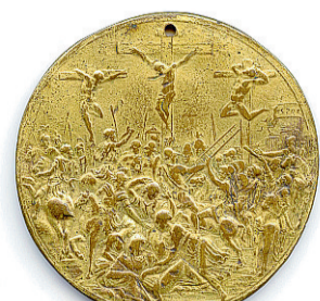
Crocifissione Giovanni Bernardi

rappresentazioni iconografiche, tra monete e medaglie, interpretando la storia del cristianesimo e il suo sviluppo. L'esposizione, composta da una ventina di pezzi, vuole cercare di analizzare motivazioni politiche e culturali che al tempo portarono alla scelta di una determinata raffigurazione rispetto ad un'altra, oltre che a mettere in dialogo forme artistiche tra loro differenti, come nel caso di Giovanni Bernardi. La mostra è stata presentata ieri nella sala conferenze del Museo, assieme al volume «Il Medagliere si rivela», acquistabile nel bookshop del Museo, che documenta i percorsi tematici