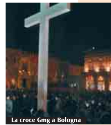
La croce Gmg a Bologna