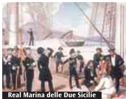
Real Marina delle Due Sicilie

richiedono comunque sempre una massiccia terapia anti-rigetto. Oggi le terapie operative provengono tutte da cellule staminali di individui adulti, prelevate dai tessuti adiposi, dal bulbo olfattivo, o dal fegato, moltiplicate, e poi trasferite nel tessuto danneggiato. I risultati migliori sono stati ottenuti con le «staminali autologhe», ovvero quelle provenienti da sé stessi. C'è poi da dire che prelevare le cellule staminali dell'embrione significa sopprimere l'embrione stesso. Un procedimento inutile se si pensa che si può ricorrere, con gli stessi risultati, ai tessuti dei feti abortiti spontaneamente, dove ci sono le staminali fetali che si moltiplicano con grande velocità e possono essere conservate in congelatore. (S.A.)