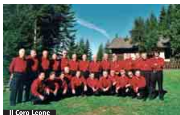
Il Coro Leone

Sarà una serata davvero speciale, quella di sabato prossimo, 19 marzo, per il Coro Leone: alle 21 in Sala Bossi (piazza Rossini) terrà infatti un'esibizione che gli consente di raggiungere un traguardo prestigioso: quello dei 500 concerti.