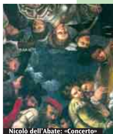
Nicolò dell'Abate: «Concerto»