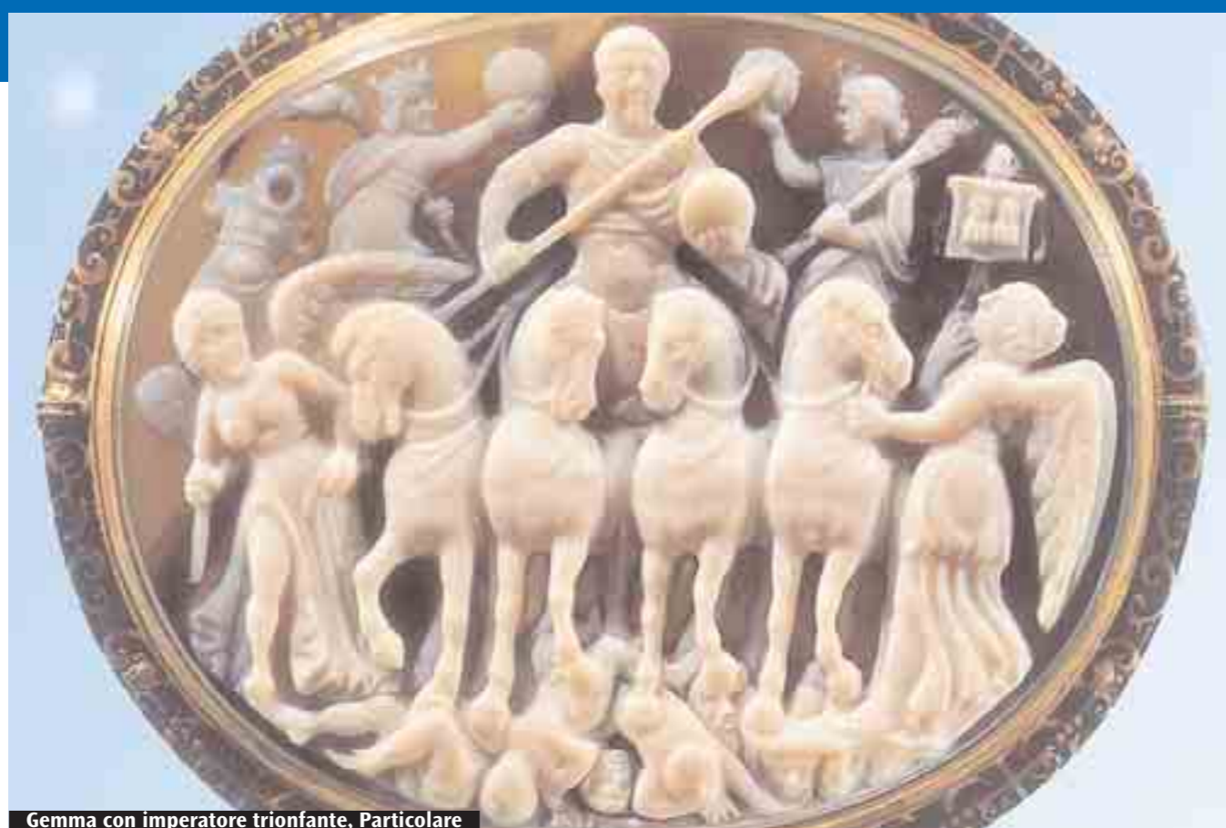
Gemma con imperatore trionfante, Particolare