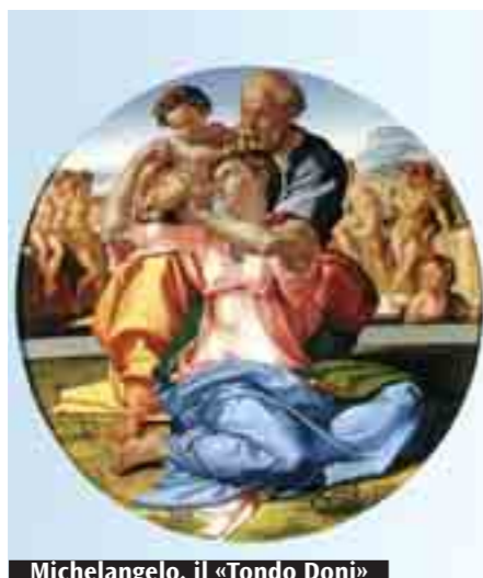
Michelangelo, il «Tondo Doni»

Domenica in Seminario monsignor Caffarra accoglierà esperienze, istanze, dubbi, problemi e desideri delle coppie che fanno da tramite fra parrocchie e Ufficio diocesano. Quindi la relazione di don Cassani