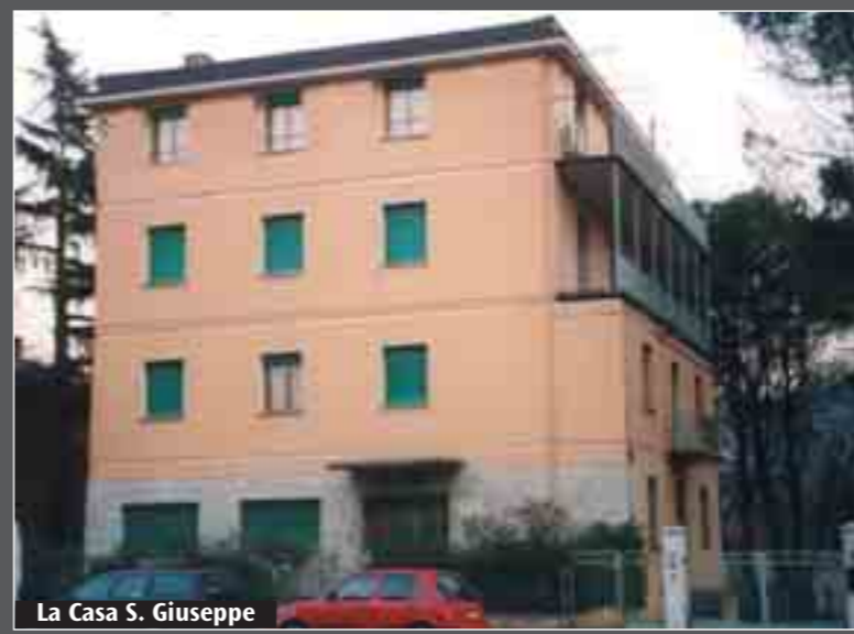
La Casa S. Giuseppe

Sarà un punto di «primo appoggio» per i lavoratori che giungono a Bologna, per un massimo di tre mesi, in attesa di una sistemazione migliore e definitiva. Si chiama Casa «S. Giuseppe», si trova in via Toscana 174 ed è stata «attivata» dalla Cooperativa Orione 2000, che l'ha ricevuta dalla Comunità dei Figli di Dio. Sarà inaugurata ufficialmente sabato 19 marzo alle 11, con la Messa che celebrerà nella Cappella interna il vescovo ausiliare monsignor Ernesto Vecchi. «Noi gestiamo già una Casa per parenti di degeni negli ospedali cittadini - spiegano i responsabili della Cooperativa - e abbiamo pensato che la maggiore necessità oggi a Bologna è quella dei