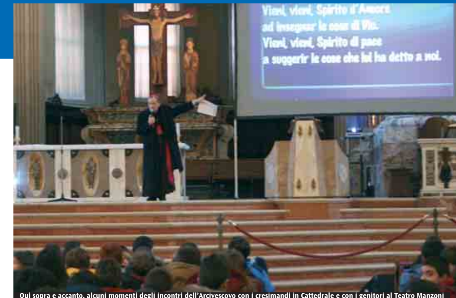
Qui sopra e accanto, alcuni momenti degli incontri dell'Arcivescovo con i cresimandi in Cattedrale e con i genitori al Teatro Manzoni