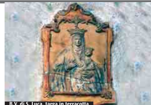
B.V. di S. Luca, targa in terracotta