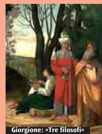
Giorgione: «Tre filosofi»