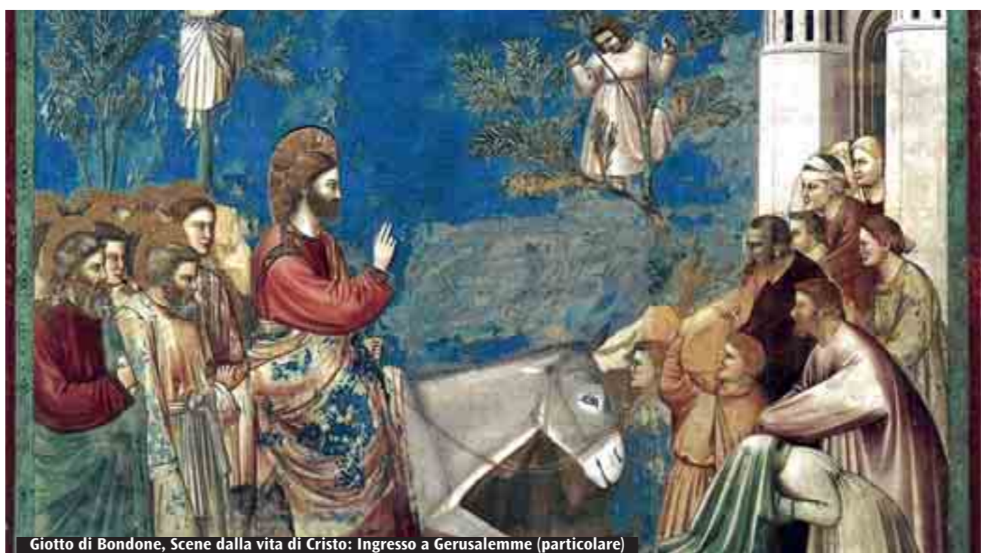
Giotto di Bondone, Scene dalla vita di Cristo: Ingresso a Gerusalemme (particolare)

I tre re e la loro ricerca che approda alla fede saranno protagonisti dell'appuntamento in vista della Gmg