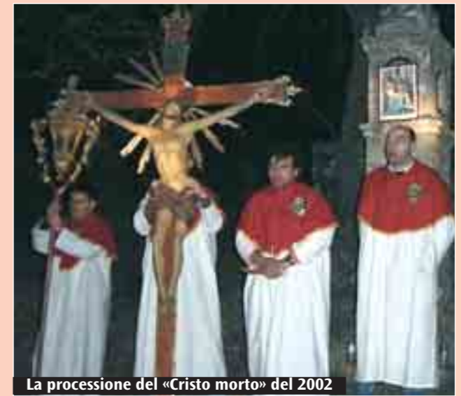
La processione del «Cristo morto» del 2002

Dopo la ripresa, avvenuta nel 2002, quarto appuntamento con la tradizionale processione della borgata