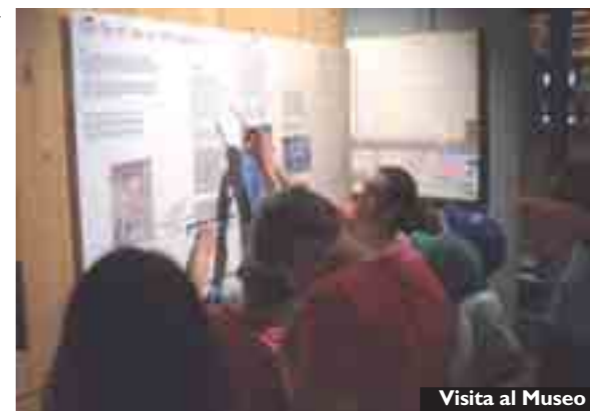
Visita al Museo

Mercoledì 22 luglio, i ragazzi e gli animatori dell'Estate Ragazzi ZoP («Zona Pastorale») di Rastignano si sono recati in visita al Museo del Patrimonio industriale di Bologna: una nuova occasione per mettere in pratica un'intuizione che percorre tutto il piano educativo di questo centro, e cioè una spiccata attenzione al territorio. Si tratta insomma di un'Estate Ragazzi con la vocazione a guardarsi intorno, vuoi gemellandosi con il centro della parrocchia di Pianoro per fare insieme alcune attività, vuoi per il rapporto privilegiato con alcune aziende della zona che sostengono l'attività estiva. È proprio da alcune di queste realtà, che contribuiscono al Museo del Patrimonio industriale, che viene l'idea di incontrare i ragazzi in modo divertente ed educativo, facendo loro conoscere un museo che racconta le eccellenze bolognesi degli ultimi 500 anni attraverso esperimenti scientifici, pannelli interattivi e una caccia al tesoro.