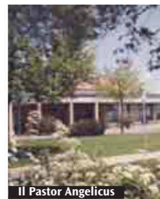
Il Pastor Angelicus

Tutto questo naturalmente nel bellissimo spazio all'aperto messo a disposizione dal Villaggio. Il gruppo musicale nasce come omaggio al grande artista, scomparso nel 1997, che ha dedicato la vita alla riscoperta e alla diffusione del mandolino. Virtuoso di fama mondiale, Anedda ha imposto questo strumento nelle sedi concertistiche di maggior prestigio. Riportiamo una breve intervista con i componenti del gruppo.