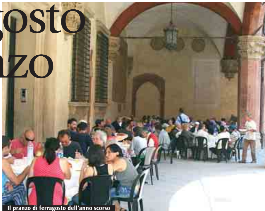
Il pranzo di ferragosto dell'anno scorso