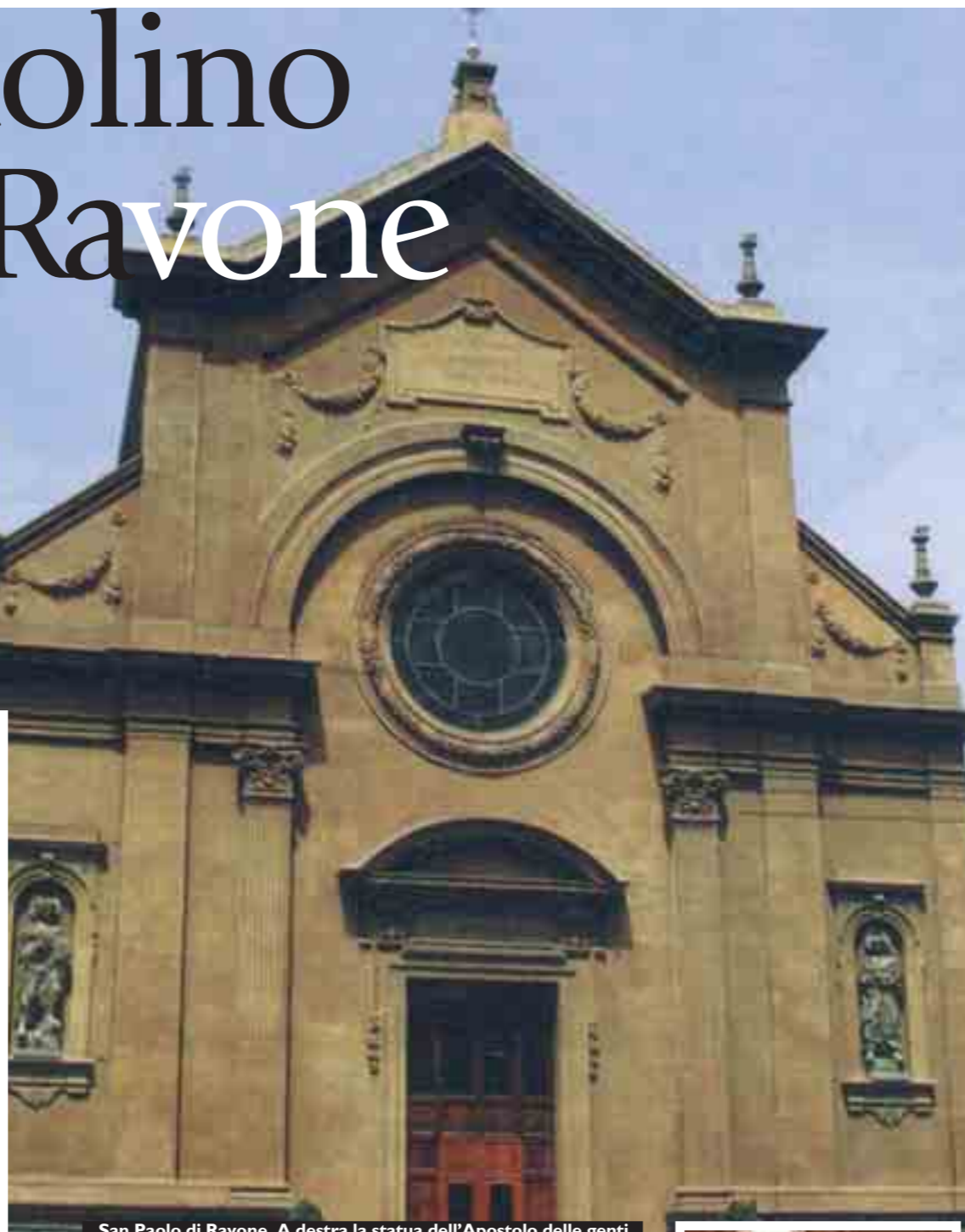
San Paolo di Ravone. A destra la statua dell'Apostolo delle genti