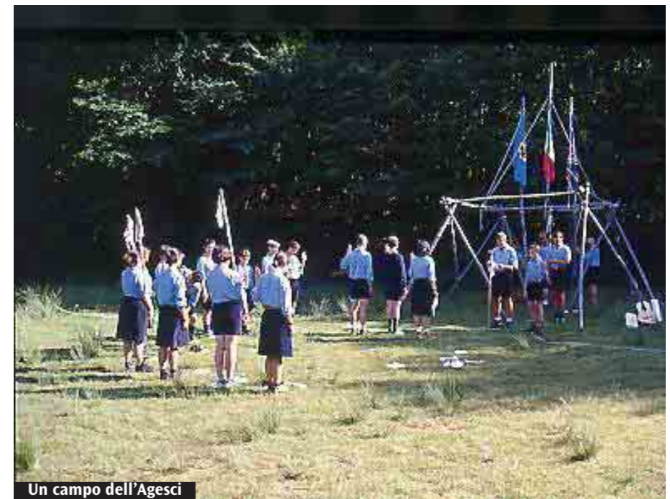
Un campo dell'Agesci

vivere una settimana di condivisione con gli ospiti della casa: ragazzi ex carcerati. Il tratto distintivo dei Clan è strada, comunità e servizio agli altri e molti ragazzi scelgono l'estate per presentare al resto della comunità le scelte valoriali che li guideranno nella vita. I Reparti invece organizzano campi fissi, con vita in tenda, per ragazzi dagli 11 ai 16 anni, gli Esploratori e Guide: si faranno da mangiare, costruiranno tavoli, tende sopraelevate, alzabandiera, veglieranno alle stelle... Tutto all'insegna di una parola d'ordine: avventura. E poi ci sono Lupetti e Coccinelle: anche per loro campi fissi «ambientati» (come il Far West con incontri con gli indiani prima nemici e poi alleati, o la corsa all'oro e il mondo grigio dei computer per riscoprire il valore dell'amicizia) in casa, pieni di racconti, grandi giochi, mini-olimpiadi, laboratori di creatività, ma anche momenti in cui sono chiamati ad assumersi impegni precisi, personali e verso gli altri, e a verificarsi nel rispetto delle regole e nel motto «fare del proprio meglio». (M.C.)