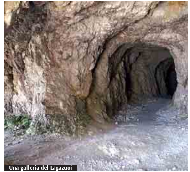
Una galleria del Lagazuoi

* Membro Consiglio direttivo Uciim Bologna