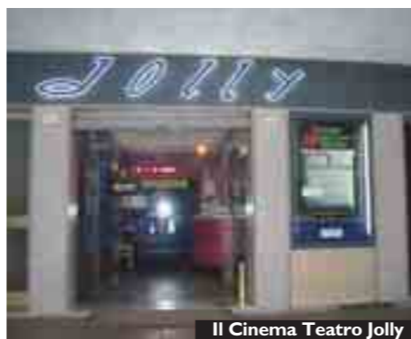
Il Cinema Teatro Jolly

che si regge bene (anche il cinema ha sempre parecchi spettatori) e che costituisce un punto di riferimento per tutto il territorio» conclude il parroco. Per informazioni si può anche consultare il sito internet http://cinemajolly.splinder.com