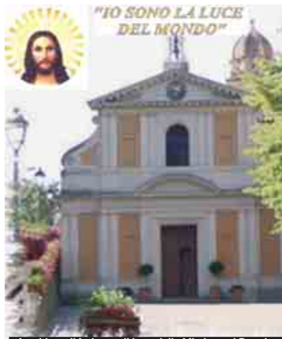
La chiesa di Loiano e il logo della Missione al Popolo

Questo il programma della Missione al Popolo della parrocchia dei Ss. Giacomo e Margherita di Loiano. Sabato 2 agosto alle 21 Messa presieduta dal vescovo ausiliare monsignor Ernesto Vecchi e mandato ai Missionari; domenica 3, Messe alle 9.30, 11.30 e 18. Alle 17.15 Adorazione eucaristica e Vespri, alle 20.30 Recita del Rosario fino al cimitero con Benedizione alle tombe. Lunedì 4, martedì 5, mercoledì 6, giovedì 7 e venerdì 8 agosto alle 7 Messa e Lodi; alle 9 Messa e Adorazione eucaristica fino alle 11.30 (possibilità in chiesa di confessarsi). Un missionario visiterà i malati portando loro la Comunione; alle 14.15 incontro in chiesa con bimbi e ragazzi; alle 20.30 catechesi a dialogo per gli adulti in chiesa (la prima parte tutti insieme, la seconda gli adulti in chiesa, i giovani in canonica con argomenti diversi). Sabato 9 alle 7 Messa e Lodi; alle 14.15 incontro con bimbi e ragazzi; dalle 16 alle 18 confessioni; alle 18 Messa prefestiva. Domenica 10 agosto, Festa della Beata Vergine del Carmine, alle 9.30 e alle 11.30 Messa; alle 16.30 Vespri; alle 17 Messa, Processione e Benedizione con l'immagine della Madonna del Carmine. Lancio dei palloncini e saluto ai missionari.