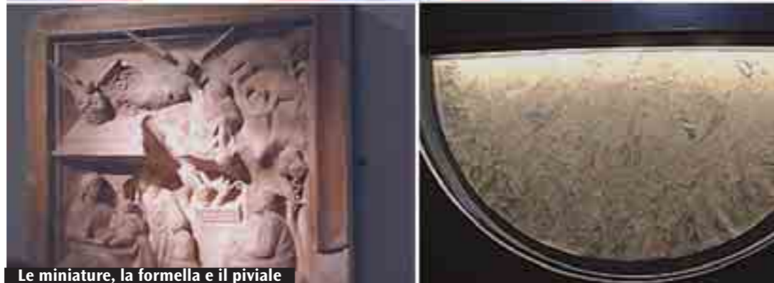
Le miniature, la formella e il piviale