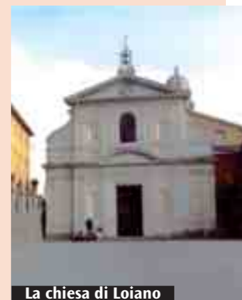
La chiesa di Loiano

La chiesa di Loiano venne consacrata da monsignor Tagliapietra il 12 agosto 1933, dopo i grandi lavori di ristrutturazione e ampliamento della precedente chiesa non più rispondente alle esigenze di una zona in forte espansione demografica. Il progetto venne realizzato con il contributo di vari enti oltre che dei parrocchiani, che versarono offerte e dedicarono giornate di lavoro.