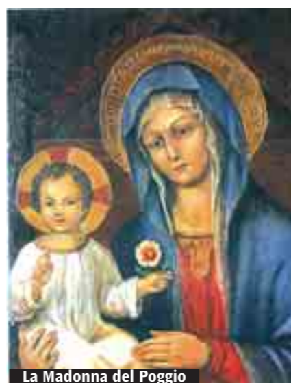
La Madonna del Poggio

Gesù che custodisce la Parola di Dio nel cuore e questa Parola illumina la vita e aiuta a trovare l'interpretazione degli avvenimenti quotidiani. Desideriamo, dunque, richiamare tutto questo durante la Novena con l'aiuto dei testi biblici nella Messa quotidiana, e nel Rosario serale ascoltando le testimonianze di alcune apparizioni riconosciute dalla Chiesa. Inoltre, nel maggio 2009 cadranno i 150 anni dei «Viaggi» della Madonna del Poggio a San Giovanni in Persiceto. Forse i nostri padri inventarono questa iniziativa pastorale sull'onda della dichiarazione del dogma dell'Immacolata Concezione di Maria e delle apparizioni a Bernadette, per aiutare a vivere e testimoniare sempre più intensamente la fede nel Signore Gesù. La nostra parrocchia si è preparata a questo appuntamento con un «triduo» di tre anni pastorali scanditi dai seguenti temi: «Volgersi a Cristo» (2005-2006); «L'incontro con il Signore, il Risorto» (2006-2007); «Testimoni del Risorto» (2007-2008).