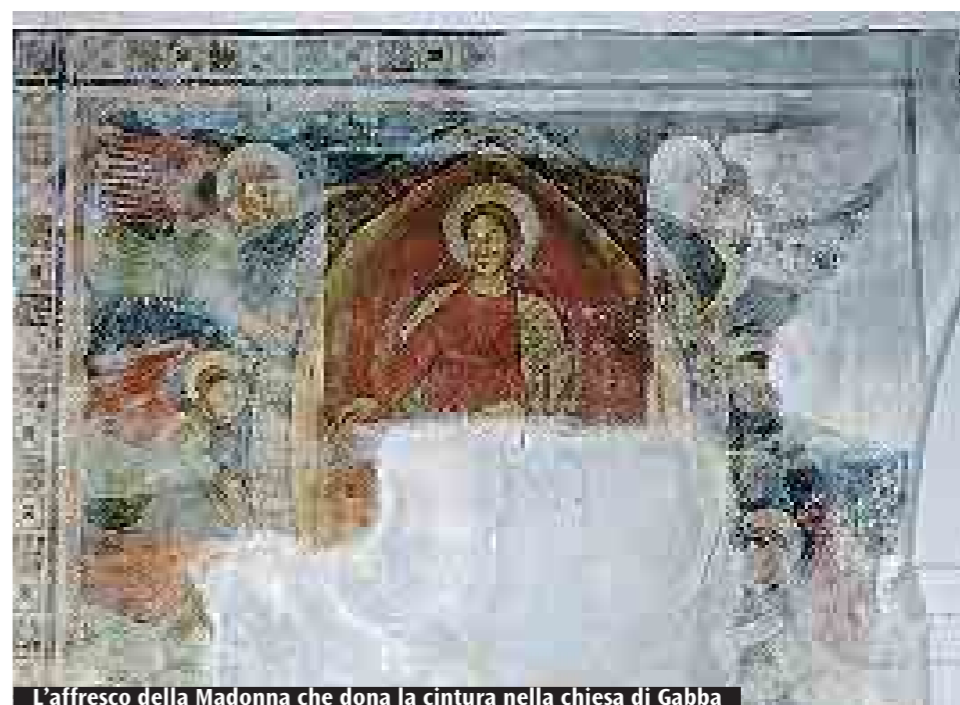
L'affresco della Madonna che dona la cintura nella chiesa di Gabba

Grande successo per l'iniziativa della Fondazione Carisbo di un corso di formazione aperto a tutti: il 5 settembre le prossime audizioni