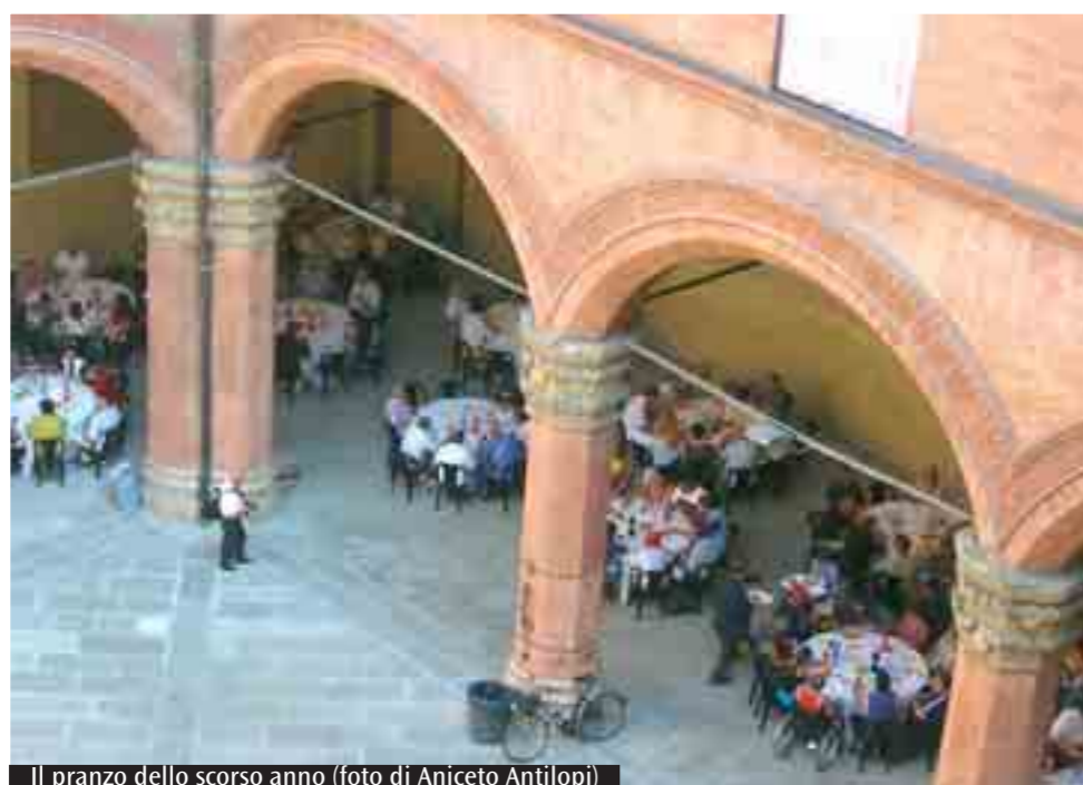
Il pranzo dello scorso anno