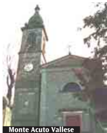
Monte Acuto Vallese