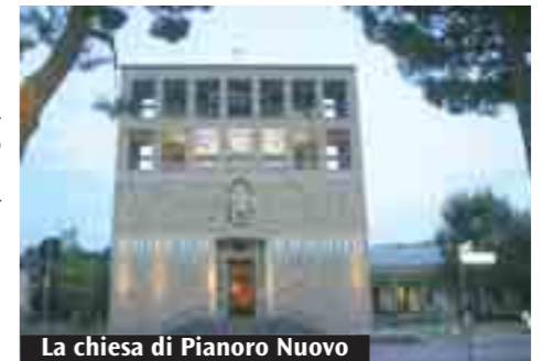
La chiesa di Pianoro Nuovo