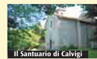
Il Santuario di Calvigi