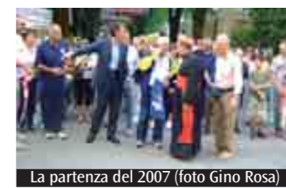
La partenza del 2007