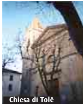
Chiesa di Tolé

TOLÉ. Grande festa a Tolé di Vergato per il giorno dell'Assunta. Venerdì 15 la Messa solenne sarà alle 11.15. Seguiranno il Rosario alle 18 e la seconda celebrazione eucaristica alle 18.30. «La recita solenne dei Vespri», racconta il parroco don Eugenio Guzzinati, «anticiperà alle 20.30 la processione per le vie del paese, nella quale si porterà l'immagine di una Madonna cinese, accompagnata dalla banda musicale di Samone». Nel corso del pomeriggio ci sarà la pesca di beneficenza e l'esibizione della banda musicale.