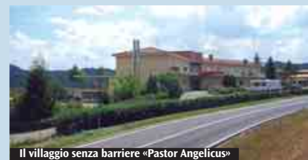
Il villaggio senza barriere «Pastor Angelicus»