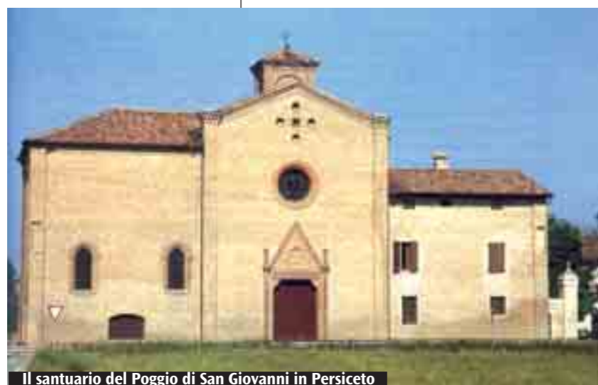
Il santuario del Poggio di San Giovanni in Persiceto