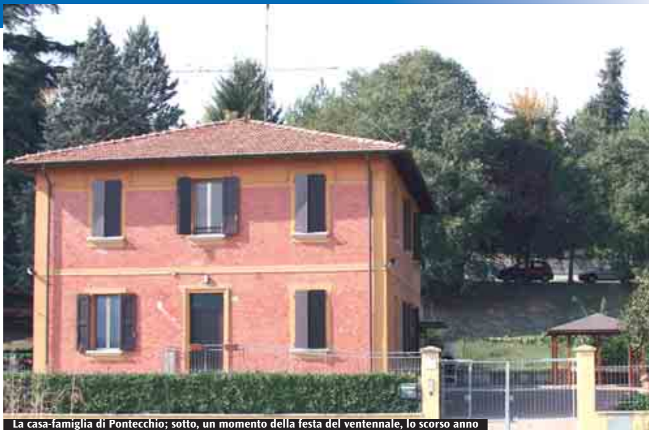
La casa-famiglia di Pontecchio; sotto, un momento della festa del ventennale, lo scorso anno

Nelle comunità sono ospitate persone con problemi psichici: i gruppi sono piccoli e quindi ognuno è seguito con cura