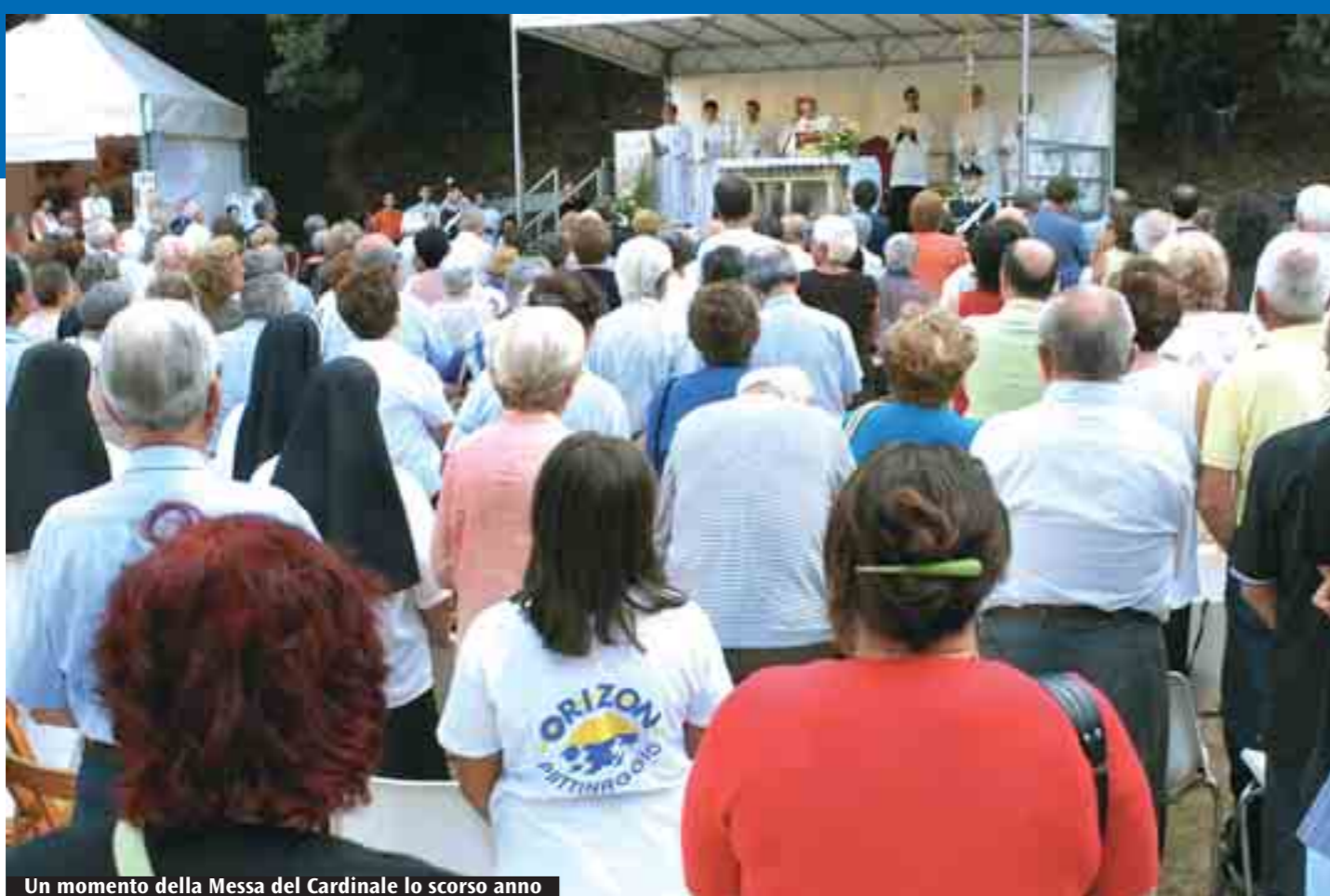
Un momento della Messa del Cardinale lo scorso anno

A sinistra, uno dei pannelli che compongono la mostra sulla vita e le opere di san Paolo