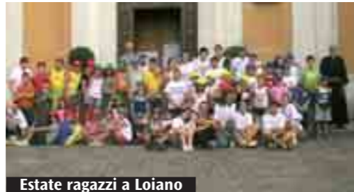
Estate ragazzi a Loiano