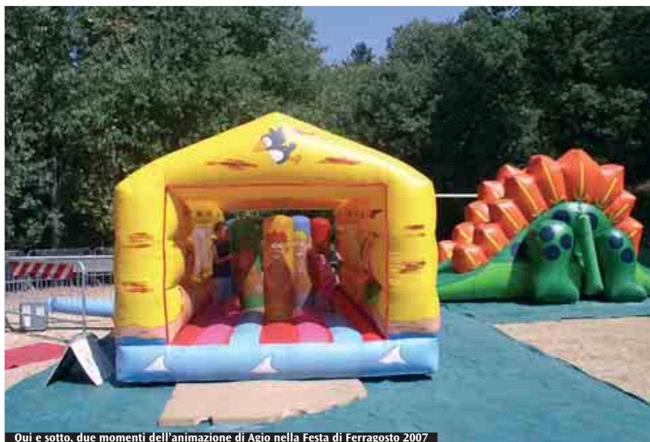
Qui e sotto, due momenti dell'animazione di Agio nella Festa di Ferragosto 2007