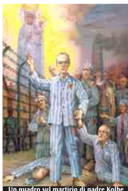
Un quadro sul martirio di padre Kolbe