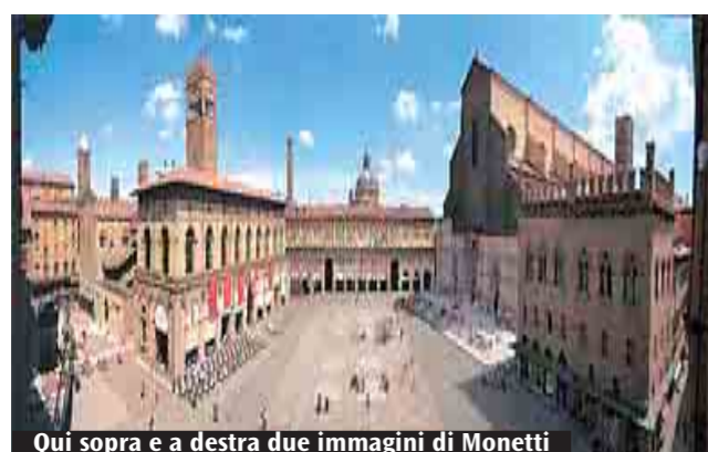
Qui sopra e a destra due immagini di Monetti

Nella mostra «Il colore delle stagioni» il paesaggista propone una visione della città insolita, ma vicina al sentire delle persone perché ispirata al «metodo» di elaborazione delle immagini della nostra mente