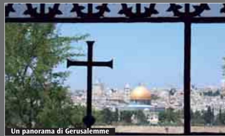
Un panorama di Gerusalemme