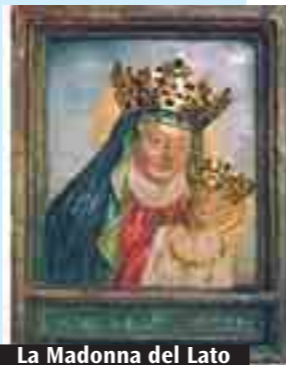
La Madonna del Lato