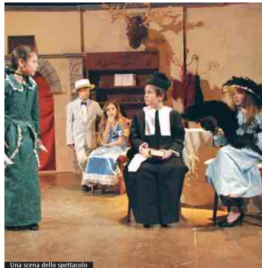
Una scena dello spettacolo

È utile da molti punti di vista: aiuta la formazione del bambino, perché ne rafforza la capacità espressiva, favorisce la capacità creativa, di iniziativa e di comunicazione, e il senso di appartenenza al gruppo. Ed è fondamentale anche da un punto di vista didattico, perché in un clima giocoso certi contenuti «passano». Questo progetto inoltre ha dato a tutti noi l'occasione di aiutare chi è nel bisogno. (T.R.)