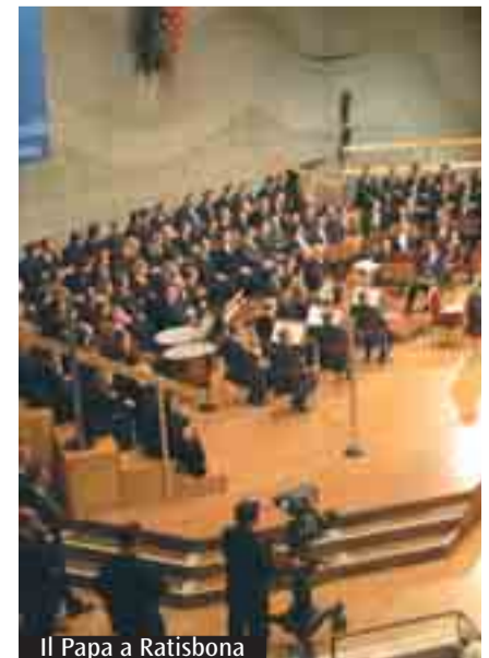
Il Papa a Ratisbona