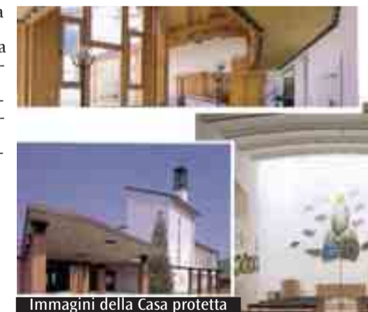
Immagini della Casa protetta

in modo umano, secondo il nostro carisma, legato all'esperienza semplice della Famiglia di Nazareth - spiega suor Maria Giacinta, superiora della comunità religiosa nella Casa - Questo significa che la persona è sempre accolta e amata secondo l'infinita dignità che le deriva dall'essere figlia di Dio. In qualunque situazione si trovi: ammalata di demenza senile o alzheimer, anche ridotta allo stato "vegetale". Tutti vengono serviti secondo le proprie necessità, da infermieri, medici e personale assistenziale. Non pretendiamo che i nostri dipendenti siano tutti credenti, ma chiediamo che ciascuno tratti ogni ospite come se si trattasse del proprio nonno o genitore». Un'attenzione che fa la qualità. «Non abbiamo mai pubblicizzato il nostro lavoro - conclude suor Giacinta - ma il passaparola ha fatto sì che non abbiamo mai avuto posti vuoti; abbiamo visto anche con piacere che chi era stato degente per alcuni mesi, quando si trovava nella necessità di un rientro chiedeva sempre della nostra Casa». Per il futuro Casa «Sacra Famiglia» sta procedendo alla realizzazione di alcuni interventi migliorativi sulla struttura. Molto si sta investendo poi sulla formazione. (M.C.)