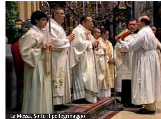
La Messa. Sotto il pellegrinaggio