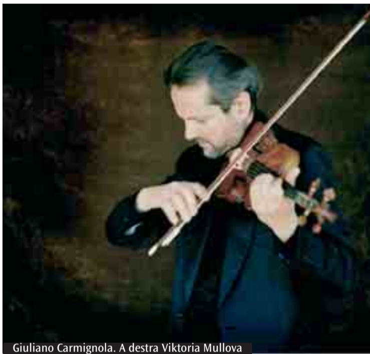
Giuliano Carmignola. A destra Viktoria Mullova