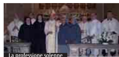
La professione solenne

camminato nei gruppi formativi e si è impegnata, tra l'altro, nel catechismo e nel coro. Lì ha anche conosciuto le Piccole suore di Santa Teresa, presenti sul territorio fino ad alcuni anni fa. «Ho iniziato a non escludere la scelta della consacrazione già dai primi anni della scuola superiore - racconta - Ero certa dell'amore di Dio, e quindi del fatto che mi avrebbe chiesto solo ciò che corrispondeva al mio bene più profondo. Così ho sempre mantenuto la domanda aperta sulla mia vocazione. La stessa Cresima ha rappresentato nella mia storia un fatto molto serio: decisi nel cuore di divenire davvero testimone di Cristo. Poi è arrivato il fascino per le Piccole suore, legate alla spiritualità semplice e intensa della Santa di Lisieux: la comunione con Dio vissuta attraverso l'amore a lui e quindi ai fratelli nelle piccole cose quotidiane, offrendo tutto a Gesù per il bene della Chiesa». (M.C.)