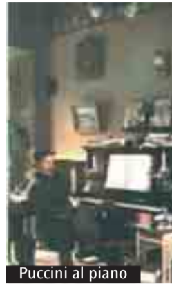
Puccini al piano

«Un Museo del Teatro in cui ricordare quello che Bologna ha dato al Belcanto. Donerò, quando si farà tutti i miei costumi. Il Sovrintendente Ghiringhelli volle che li tenessi dopo il mio ultimo spettacolo. Altrimenti li lascerò a Torre del Lago».