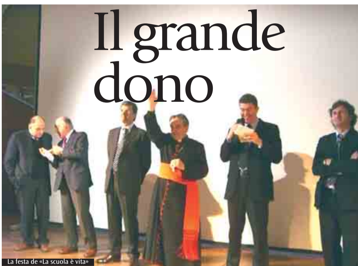
La festa de «La scuola è vita»

Nel corso dell'incontro con 20 scuole paritarie, venerdì scorso nell'Aula Magna di Santa Lucia, il cardinale ha riaffermato l'intangibilità della vita, «anche se priva di coscienza»