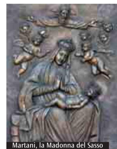
Martani, la Madonna del Sasso