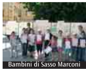
Bambini di Sasso Marconi

SASSO MARCONI. Si sono conclusi con successo i concorsi di pittura «Disegna la tua preghiera» e «Dona un fiore a Maria» organizzati in occasione della festa della Beata Vergine del Sasso dai catechisti della parrocchia.