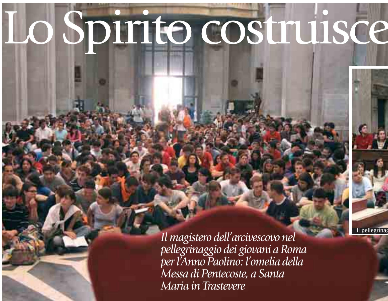
Il magistero dell'arcivescovo nel pellegrinaggio dei giovani a Roma per l'Anno Paolino: l'omelia della Messa di Pentecoste, a Santa Maria in Trastevere