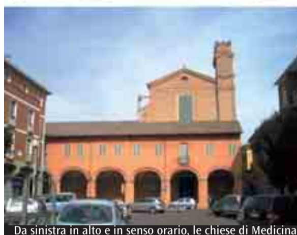
Da sinistra in alto e in senso orario, le chiese di Medicina, Molinella e Budrio

con la programmazione comune dei percorsi coi bambini». La pastorale giovanile: con giornate d'incontro, riflessione, preghiera e, nell'anno pastorale in corso, una «due giorni» di esercizi spirituali per adolescenti; con gruppi teatrali e musicali costituiti a livello interparrocchiale. La catechesi dei fidanzati: attraverso cammini comuni di formazione dei catechisti che mediamente 4 - 5 volte l'anno si ritrovano per l'autoformazione e l'aggiornamento. «Fare le cose insieme ha permesso di ottimizzare le forze - commenta monsignor Marcello Galletti, parroco a Medicina - Per la formazione dei catechisti, ad esempio, è stato possibile garantire percorsi anche alle comunità più piccole. Per i giovani poi è un'esperienza decisamente più efficace quella di aprire gli orizzonti e confrontarsi con realtà diverse da quelle nelle quali si vive ordinariamente». La pastorale di vicariato si completa con altre realtà espresse in forma unitaria: la scuola di Teologia, l'incontro per separati, l'Estate ragazzi (per gruppi di comunità) e la Caritas. «Tutto questo lavoro comune è da ritenere estremamente positivo - conclude monsignor Solieri - favorito anche dall'omogeneità delle parrocchie e dalla vicinanza dei luoghi».