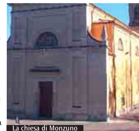
La chiesa di Monzuno

* Vicario episcopale pastorale integrata e strutture di partecipazione