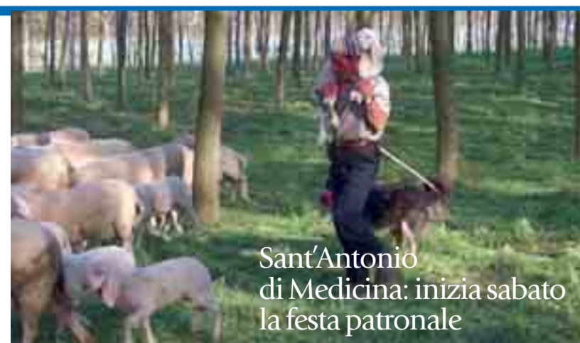
Sant'Antonio di Medicina: inizia sabato la festa patronale

In che modo avete pensato di presentare questo tema? Poiché ormai pochissimi oggi conoscono come sia la vita di un pastore e del suo gregge, inizialmente ne abbiamo raccontato, per testo e immagini, una giornata tipo. E basterà per convincersi che fare il pastore non è né un mestiere semplice né un semplice mestiere. Completerà questa parte l'esposizione di articoli in pelle ovina, di antichi strumenti per la lavorazione della lana nonché di formaggi e ricotte di pecora, con possibilità di degustazione. Insomma, una modalità efficace per comprendere anche tanti brani della Bibbia, a cominciare da quello del Vangelo di Giovanni, in cui Gesù si definisce «il buon pastore», cioè l'unica vera guida perché in comunione perfetta con il Padre e pronto a dare la vita per le «pecore». A questo brano evangelico è dedicata la seconda sezione della mostra, nella quale si potranno ammirare anche alcune delle più belle raffigurazioni del Buon Pastore: dall'affresco delle catacombe di Priscilla al mosaico della basilica di Aquileia ad un bassorilievo della Certosa di Bologna. Ma allora l'appellativo di «pastore» dato al Papa, ai Vescovi e ai sacerdoti sarebbe improprio? È ciò di cui si occupa la sezione successiva, mettendo in risalto come sia stato Gesù stesso ad istituire la pastoralità ministeriale, cioè quella di coloro che, non per particolari doti o meriti personali, sono