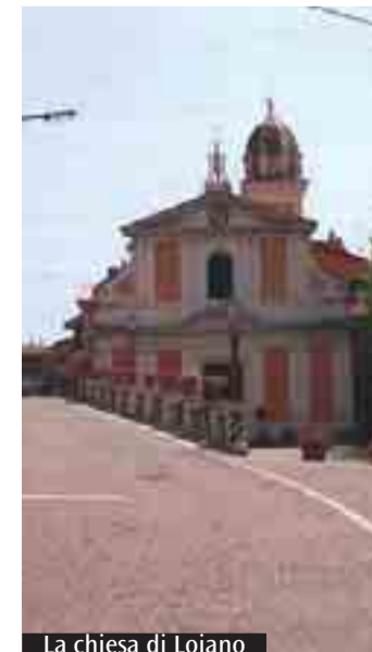
La chiesa di Loiano