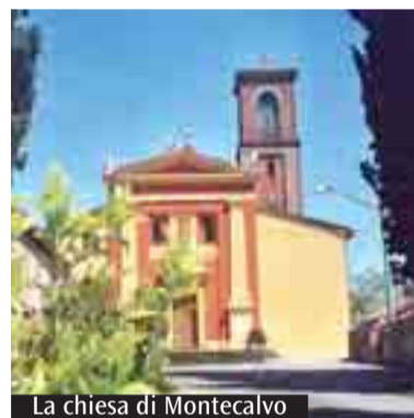
La chiesa di Montecalvo