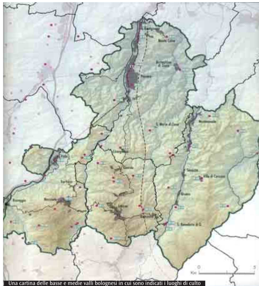
Una cartina delle basse e medie valli bolognesi in cui sono indicati i luoghi di culto