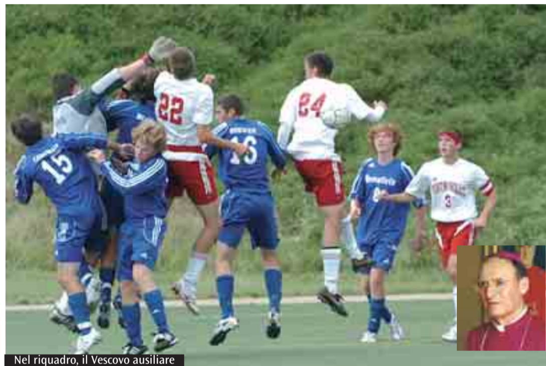
Nel riquadro, il Vescovo ausiliare

dello sport che, nonostante le difficoltà in cui si trova, conserva tutte le sue potenzialità educative. L'attività agonistica non solo contribuisce all'equilibrio fisico, ma anche a quello spirituale e porta in sé la capacità di coniugare insieme competizione e solidarietà, affermazione personale e gioco di squadra, nel superamento delle spinte egocentriche. Ma le potenzialità educative dello sport vanno messe in sintonia con un progetto educativo globale che faccia leva anche sulle risorse della fede connesse ai frutti dello Spirito. In tale prospettiva, la pedagogia sportiva cristiana vede nel salire sul podio o nei piani alti della classifica, non solo un'affermazione dell'individuo o di una squadra, ma lo stimolo della volontà di tutti all'impegno, alla solidarietà, al recupero dei più deboli, al superamento di quelle spinte negative che generano la violenza negli stadi e, a livello più alto, le trame dei grandi potentati del settore. Secondo la visione sportiva cristianamente ispirata, l'atleta o la squadra vincente, diventa segno di un'umanità in grado di governare se stessa, perché sostenuta dalla grazia di Dio e, perciò, in grado di accogliere tutte le sfide dell'esistenza - sconfitte comprese - nella consapevolezza che l'uomo e la donna sono chiamati a vincere la battaglia del bene contro il male.