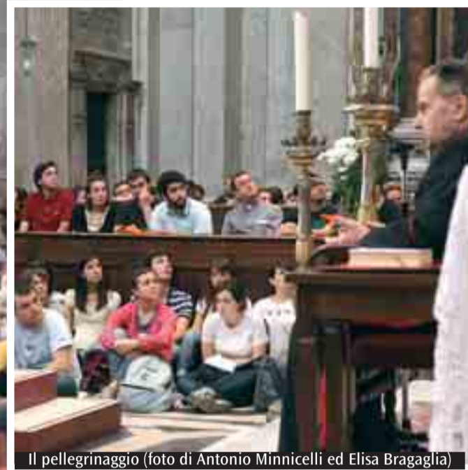
Il pellegrinaggio