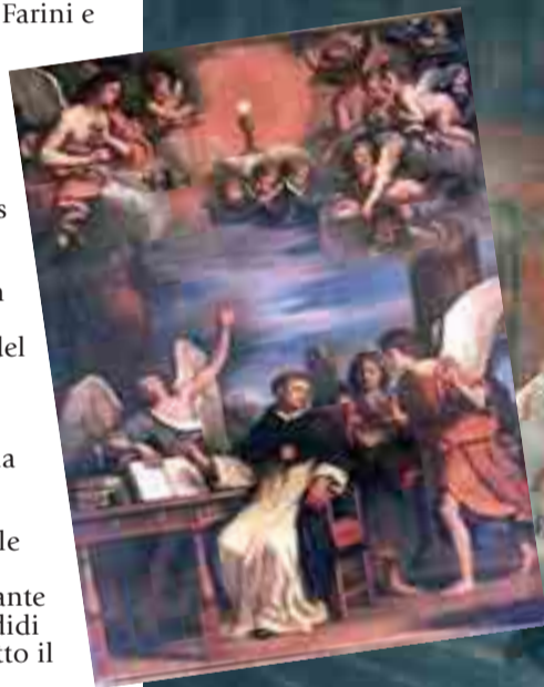
Benedizione in piazza. Sopra: Guercino, «Tommaso compone l'ufficio del Corpus Domini»

sequenza «Lauda Sion Salvatorem», che meriterebbe la meditazione di ogni parola. Qui si esalta la grandezza del sacramento, si ricordano le ragioni che portarono alla sua festa, e soprattutto si espongono i punti salienti della dottrina eucaristica e si conclude con l'aspirazione alla comunione perfetta in cielo. Bologna ha nella Basilica di San Domenico una bellissima rappresentazione, opera del Guercino, di San Tommaso che, ispirato dagli angeli, compone l'Ufficio della festa, ai piedi di un grande ostensorio raggianti. Lo stesso tema si trova nel Santuario della Madonna di San Luca, opera di Nicola Bertuzzi (1710-1777). Una grande processione del Corpus Domini si trova nella piccola opera di Livio Rizzoni (1975) sulla facciata della chiesa di Santa Maria della Grazie in San Pio V, in via Saffi. Altre poi sono le immagini che in Bologna ci ricordano la centralità dell'Eucaristia, soprattutto nei decori parietali tanto spesso misconosciuti: per esempio, nel Santuario del Corpus Domini sulle alte lesene a colonna si ammirano ostensori raggianti.