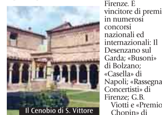
Il Cenobio di S. Vittore