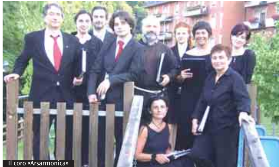
Il coro «ArsArmonica»