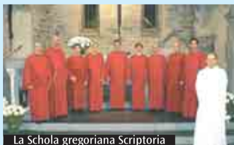
La Schola gregoriana Scriptoria