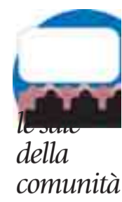
le sale della comunità