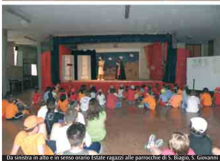
Da sinistra in alto e in senso orario Estate ragazzi alle parrocchie di S. Biagio, S. Giovanni Battista e S. Lucia di Casalecchio di Reno

bisogno di prestare attenzione alle famiglie e alle relative competenze sul territorio. L'associazionismo casalecchiese, in particolare quello legato alle parrocchie, era nelle condizioni di dare il suo contributo per i bisogni educativi e di accoglienza dei bambini. È stato naturale mettere in rete esperienze mutualistiche e «accendere» le energie esistenti. Andremo avanti anche con le esperienze oratoriali invernali, che sviluppano azioni rivolte agli