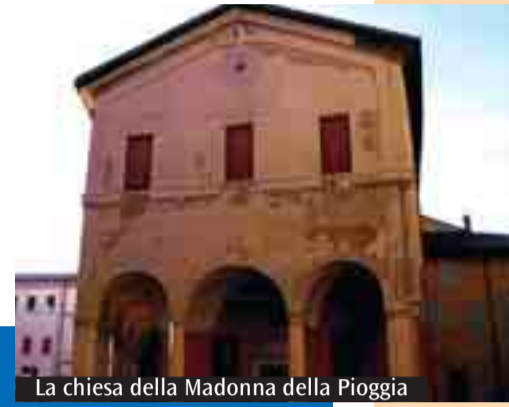
La chiesa della Madonna della Pioggia