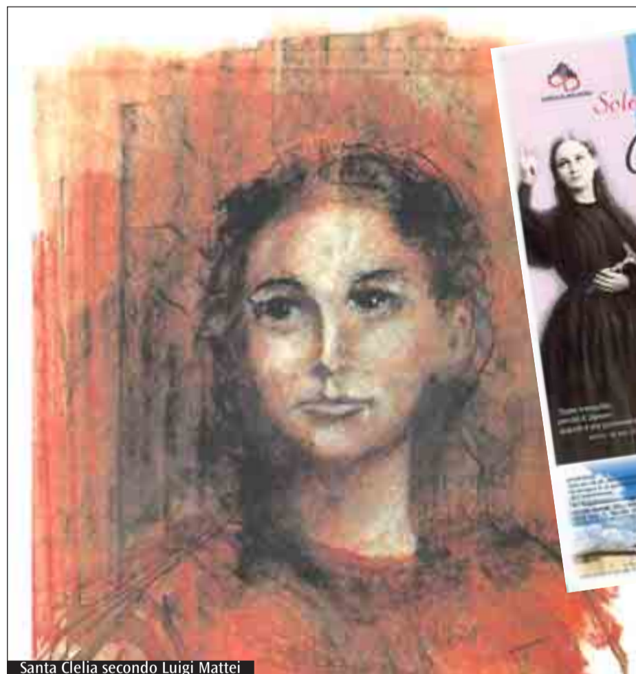
Santa Clelia secondo Luigi Mattei