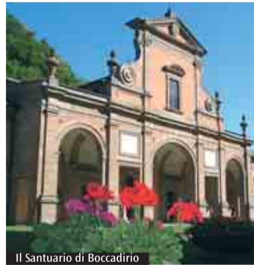
Il Santuario di Boccardirio