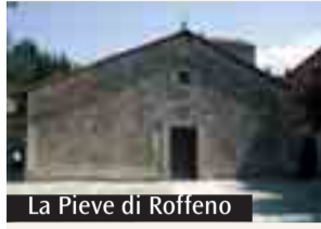
La Pieve di Roffeno