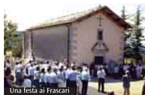
Una festa ai Frascari