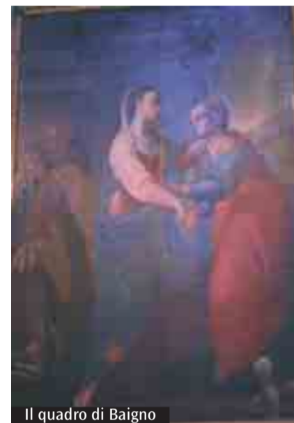
Il quadro di Baigno