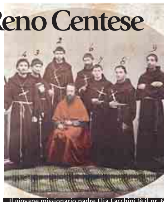
Il giovane missionario padre Elia Facchini (è il nr. 6) e la statua a lui dedicata a Reno Centese

sacerdote e nel 1867 partì missionario per la Cina. Lì si dedicò all'apostolato e poi, per oltre vent'anni, alla formazione del clero, come rettore del seminario di Tai-yuan-fu. All'inizio del secolo scorso in Cina scoppiarono le cosiddette «rivolte dei Boxers», setta sanguinaria che aveva lo scopo di scacciare gli stranieri occidentali e in particolare i missionari, più radicati nel territorio e ben voluti dal popolo. L'imperatore, per cercare di sedare le rivolte, accusò i missionari di fomentare i disordini, e ordinò la loro morte. Per tale motivo il 9 luglio del 1900 Sant' Elia Facchini cadde sotto la spada del suo aguzzino. Fu l'ultimo di 119 uccisi: prima di lui caddero giovani cinesi, suore e religiosi: fra questi ultimi San Gregorio Grassi e San Francesco Fogolla, anche loro francescani della Provincia minoritica emiliana di Cristo Re. Nell'ottobre 2000 Giovanni Paolo II in San Pietro a Roma concluse l'iter della canonizzazione dei Santi martiri cinesi e da allora la Chiesa di Bologna ricorda il suo quarto Santo martire dopo i Santi Vitale e Agricola e San Procolo: appunto Sant' Elia Facchini.