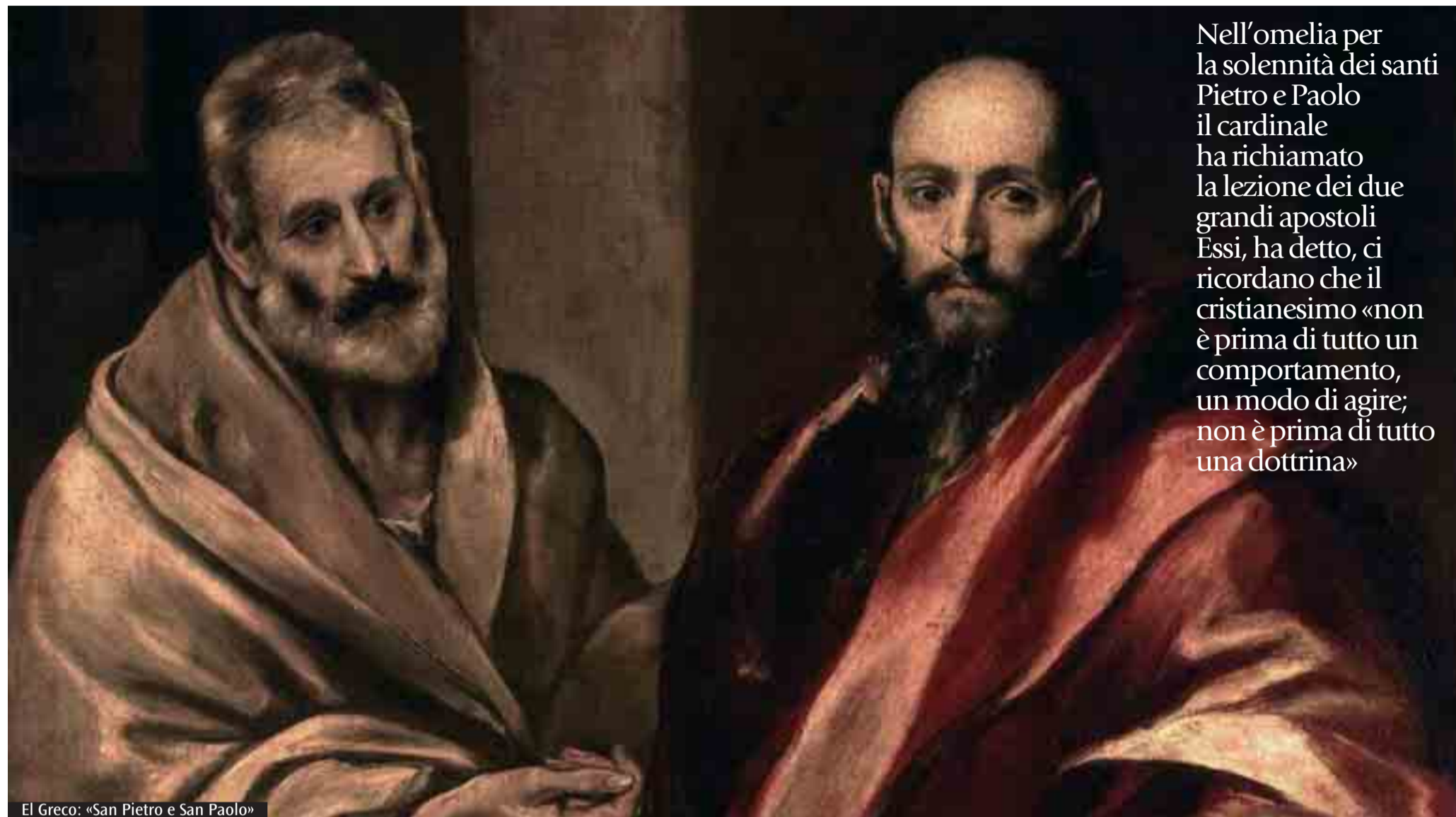
El Greco: «San Pietro e San Paolo»

Nell'omelia per la solennità dei santi Pietro e Paolo il cardinale ha richiamato la lezione dei due grandi apostoli. Essi, ha detto, ci ricordano che il cristianesimo «non è prima di tutto un comportamento, un modo di agire; non è prima di tutto una dottrina»