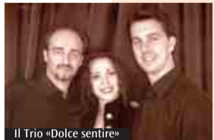
Il Trio «Dolce sentire»