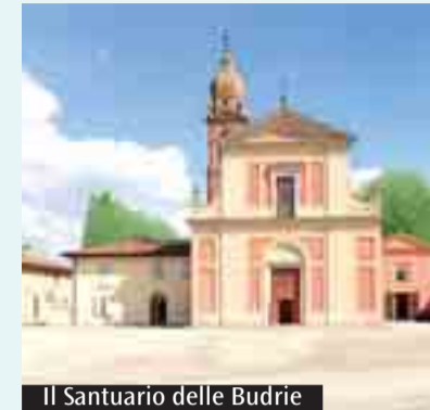
Il Santuario delle Budrie