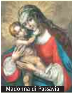
Madonna di Passavia