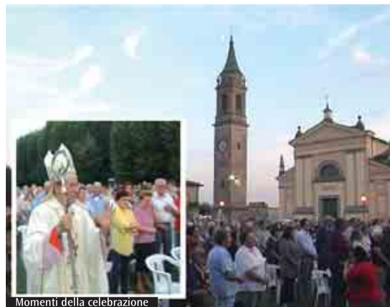
Momenti della celebrazione