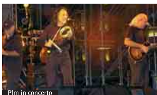
Pfm in concerto

con Fabrizio nel 1979 e in «PFM canta De André» proponiamo quel concerto e una parte dedicata alla nostra storia. Ma l'idea era nata ancora prima: nel venticinquennale del concerto andammo a Firenze. Allora c'era un teatro tenda, adesso c'è un bel teatro di cemento, tutto diverso, tranne in una cosa. Il palcoscenico era quello originale. A noi questo ha dato una grande emozione: su quelle tavole c'erano ancora le gocce del mio sudore, le strisciate dei nostri strumenti. Quest'idea ci ha presi subito. Siamo per il «live», vogliamo incontrare il pubblico e guardarlo negli occhi. Così è stato: abbiamo riproposto il concerto dal vivo». Ha funzionato? «Un successo enorme. L'abbiamo ripreso perché i ragazzi d'oggi sentono i vecchi dischi di mamma e papà, gli piacciono, ma si rammaricano di non aver mai potuto ascoltare un concerto di quel genere dal vivo. Ci siamo rimessi in gioco per dare anche a loro questo piacere. Siamo ripartiti da capo. Abbiamo riscoperto la bellezza, ricordato un amico e permesso ai ragazzi di