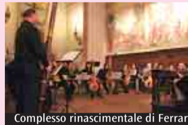
Complesso rinascimentale di Ferrara