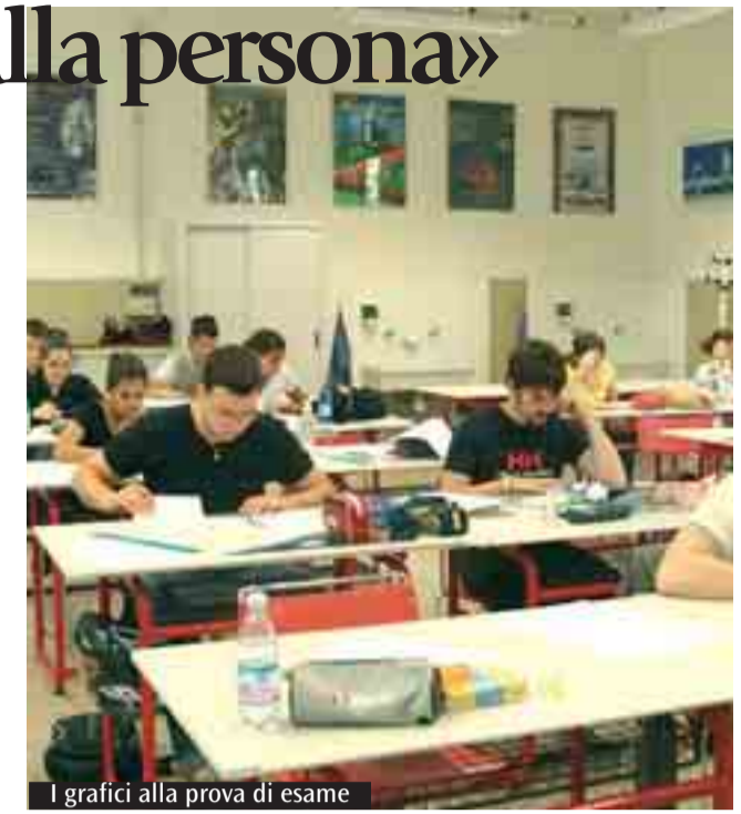
I grafici alla prova di esame

Le cinque parrocchie di Casalecchio, con il contributo anche finanziario del Comune, hanno organizzato attività che coprono tutto il territorio e l'intera durata dell'estate