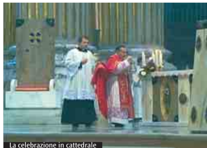
La celebrazione in cattedrale

Cariissimi fedeli, la seconda lettura e il S. Vangelo ci parlano rispettivamente della vocazione di Paolo e di Pietro: narrano l'evento fondatore dello loro esistenza. Iniziamo dall'apostolo Paolo. Egli lo narra nel modo seguente: «quando colui che mi scelse fin dal seno materno e mi chiamò colla sua grazia si compiacque di rivelare a me suo Figlio, perché lo annunziassi ai pagani...». Ciò che ha trasformato Paolo è stata la rivelazione che il Padre gli fece del suo Figlio Gesù. Sicuramente hanno dunque un carattere autobiografico le parole che in seguito l'apostolo scriverà ai cristiani di Corinto: «E Dio che disse: rifulga la luce dalle tenebre, rifulse nei nostri cuori, per far risplendere la conoscenza della gloria divina che rifulge sul volto di Cristo» (2 Cor 4,6).