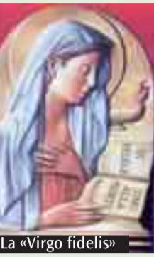
La «Virgo fidelis»