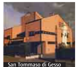
San Tommaso di Gesso