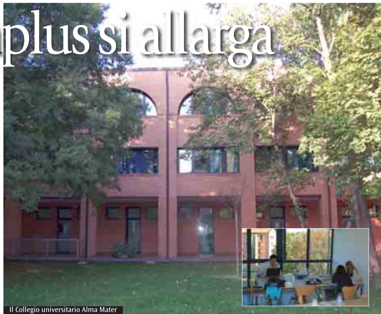
Il Collegio universitario Alma Mater