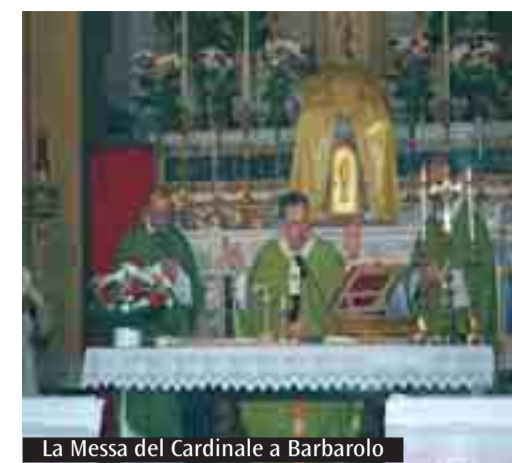
La Messa del Cardinale a Barbarolo