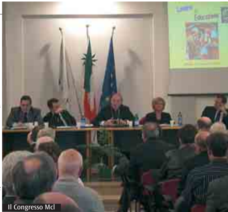
Il Congresso Mcl

Nell'esame critico del nostro sistema di vita rientra anche l'educazione al lavoro, vista nel contesto problematico della condizione giovanile. A parte il fatto che per i giovani il lavoro è un traguardo sempre più difficile da raggiungere in tempi brevi e in modo soddisfacente, ad essi viene insegnato che non serve prepararsi al lavoro e darsi delle mete. Ai giovani si insegna che il rapporto di lavoro ha le caratteristiche del mercato e, perciò, il lavoro viene trattato come una qualsiasi altra merce: più è a buon mercato, meglio è. Si suppone che l'autoregolazione del mercato garantisca l'ottimizzazione del lavoro. In realtà non è così. Il lavoro dei giovani non è merce di libero scambio in un mercato anonimo, perché, secondo l'antropologia cristiana, non è un fattore indipendente dai rapporti interpersonali (famiglia, ambiente, società). La dignità del lavoro, poi, non dipende dalla sua rilevanza sociale o dall'indice di gradimento, ma dal suo valore intrinseco. Il lavoro (qualunque lavoro, anche il più umile), infatti, «nobilita l'uomo», perché dà concretezza e visibilità al suo essere fatto a immagine e somiglianza di Dio Creatore. Qualcuno afferma che la concezione moderna del lavoro si sarebbe sviluppata in opposizione al pensiero cattolico. In realtà è proprio il contrario: la dottrina sociale della Chiesa, la storia del cristianesimo e le