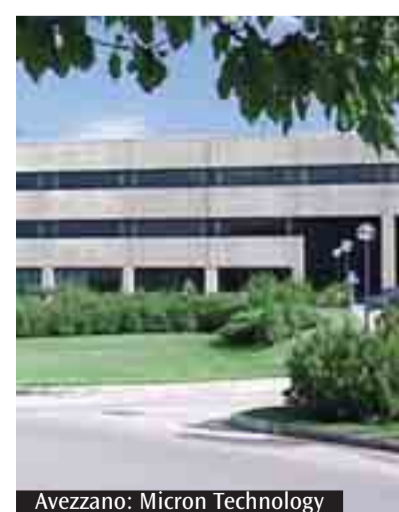
Avezzano: Micron Technology

bisogni effimeri di stimolazioni che alterano l'equilibrio e influenzano la capacità di ragionare. In questo contesto chi ci rimette è l'identità personale. «Ci rimettete voi», ha detto il vicario generale, esortando gli studenti a darsi una capacità critica, ad agganciare le relazioni alla Verità. Per aiutarli, ha spiegato il vescovo monsignor Vecchi, è necessaria una buona educazione che si struttura in tre momenti: educare l'intelligenza; educare alla libertà; educare la nostra capacità di amare. E in tutto questo il libro è il Vangelo. Tante le domande a getto degli studenti, che hanno spaziato dal senso del peccato originale al valore indissolubile del matrimonio. Ma anche genitori e insegnanti hanno approfittato della presenza del vescovo per esprimere istanze e chiedere come procedere nell'educare in maniera responsabile i ragazzi. «Auspichiamo - ha concluso il rettore del Collegio Barnabita, padre Giuseppe Montesano - che sempre di più i ragazzi imparino a seguire la Verità, attraverso quei segni che sono la storia della Chiesa e che ogni giorno si incontrano fuori e dentro alla scuola».