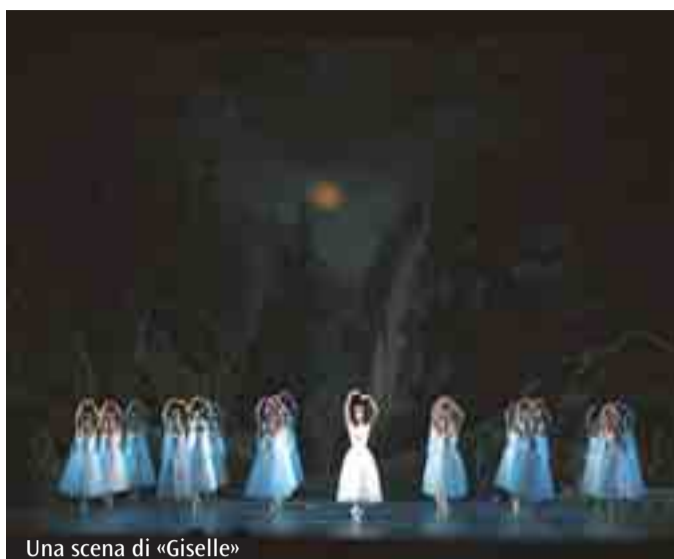
Una scena di «Giselle»