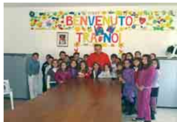
Sacramenti è bassa, questa parrocchia sia il vero punto d'incontro del paese, dove ognuno può trovare un luogo d'accoglienza umana (e anche materiale).

sono state seguite con un silenzio molto partecipe. La Messa, e l'assemblea con tutta la comunità che è seguita, hanno dato spazio all'attesa di trovare il fondamento della nostra vita cristiana a Pian di Venola e Sperticano. Nel pomeriggio il Vescovo è andato in visita alla chiesa di Sperticano, antichissima parrocchia teatro della strage nazista del '44 e bagnata dal sacrificio cruento di don Giovanni Fornasini. Qui, oltre la preghiera sulla tomba del suo santo parroco, la comunità ha raccontato come si sia attivata ultimamente per far conoscere la figura di questo sacerdote: il progetto di creare un luogo stabile di documentazione della sua vita vuole essere un valido aiuto all'educazione del popolo cristiano, così spesso confuso nel clima d'indifferenza della nostra epoca. Infine, la visita agli anziani e ai malati ha messo il sigillo su una giornata caratterizzata dalla carità di un Pastore che vuole educare il suo popolo, e da una comunità che nella vivacità di tante iniziative (famose sono le feste parrocchiali di Pian di Venola o la «briscola» del lunedì che richiama gente da tutta la vallata) sente che nella Chiesa c'è un posto per tutti. Davvero rimarchevole che, anche se la frequenza ai