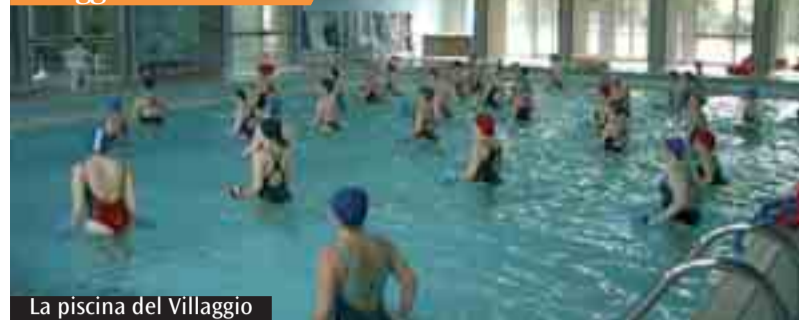
La piscina del Villaggio