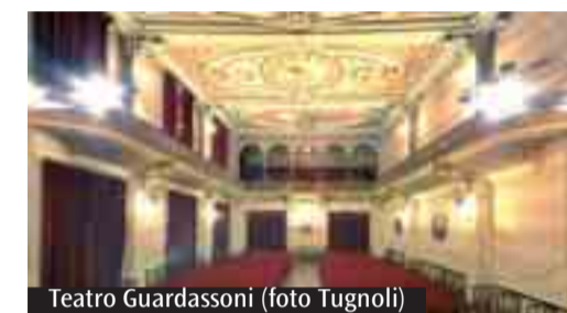
Teatro Guardassoni