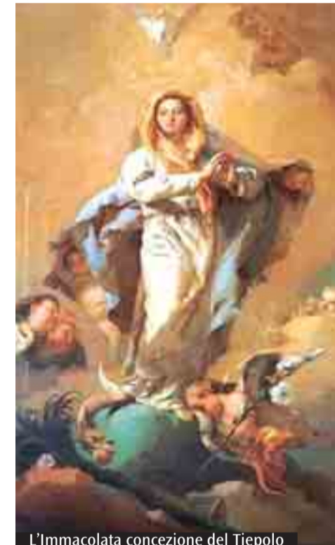
L'Immacolata concezione del Tiepolo

all'Immacolata di Piazza Malpighi del cardinale Caffarra, dei Vigili del Fuoco, delle associazioni cattoliche ed enti cittadini. Seguirà, nella Basilica di S. Francesco, il canto dei Vespri presieduto dall'Arcivescovo.