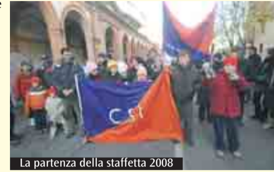
La partenza della staffetta 2008