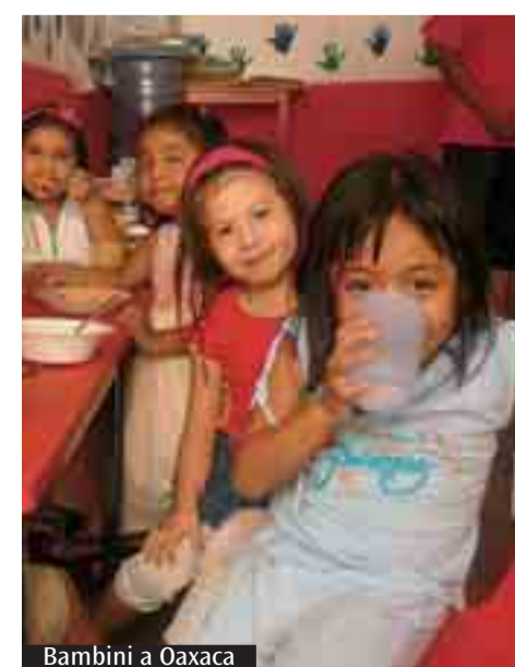
Bambini a Oaxaca