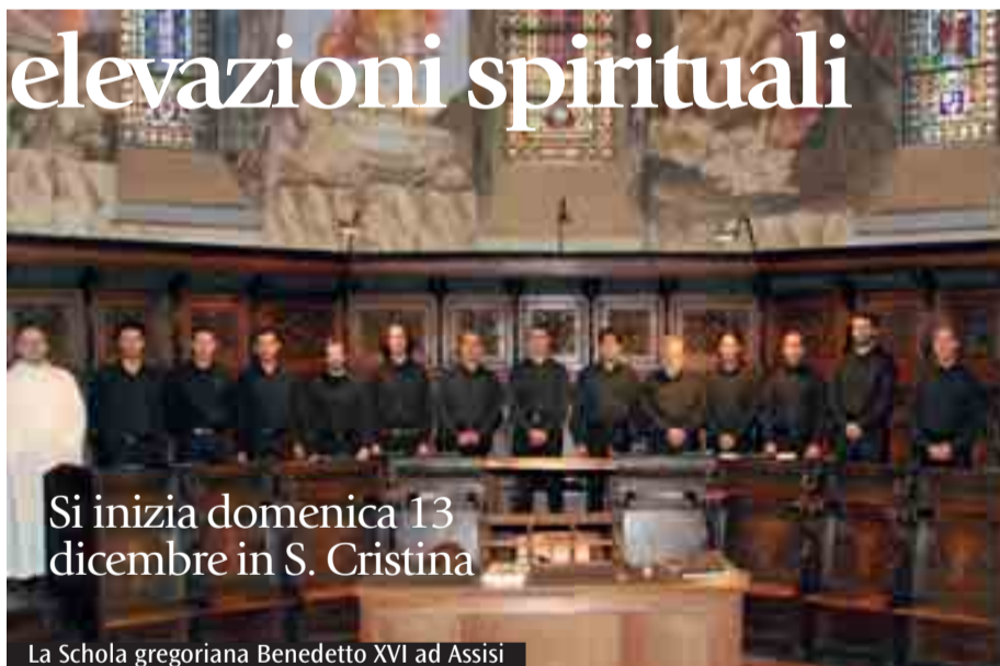
Si inizia domenica 13 dicembre in S. Cristina