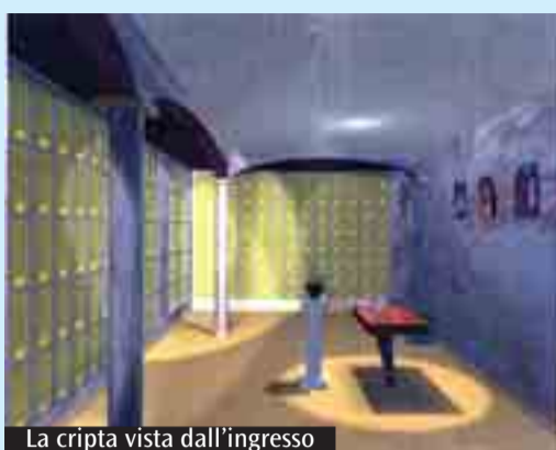
La cripta vista dall'ingresso