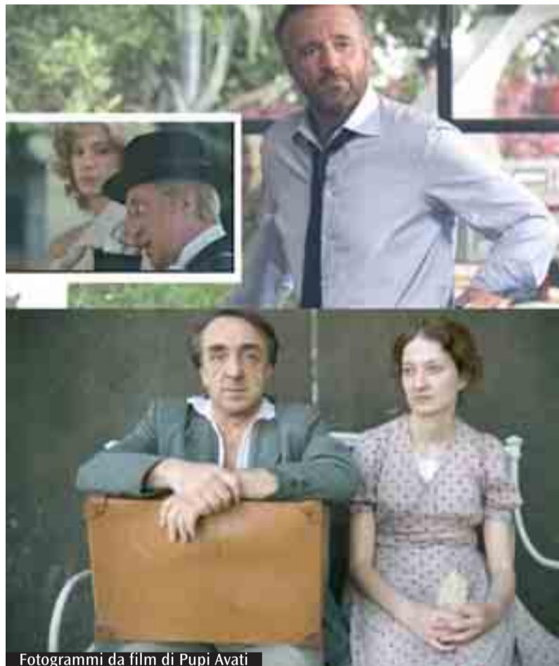
Fotogrammi da film di Pupi Avati

«Ci sono famiglie problematiche, padri orribili, cinici e asenti, come quello del film che presento "Il figlio più piccolo", che chiude una trilogia sul padre. Anche qui il padre, Christian De Sica, un immobiliare romano in crisi, ricompare, dopo anni d'allontanamento dalla famiglia, nella vita del figlio più piccolo Baldo, solo per evitare il tracollo finanziario e intesta al ragazzo tutte le sue proprietà in bilico, trascinando il figlio in un giro rischioso e più grande di lui. Però, nel momento del bisogno tutto si ricompone. C'è una grazia, che nei momenti più tragici, e con le persone più spaventose, fa sì che i legami rinascano. La speranza non venga meno. Io spero che torneremo a quello che è stato per secoli: la famiglia come luogo in cui generare, in cui crescere e far crescere. Si viene accuditi da piccoli e si accudisce da grandi chi ti ha dato la vita. Questo è possibile».