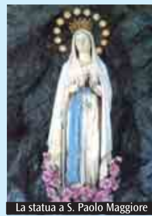
La statua a S. Paolo Maggiore