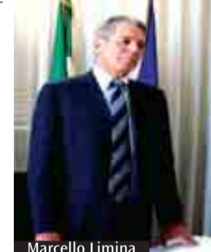
Parla il direttore dell'Ufficio scolastico regionale

all'interno dell'Europa». Buono, in Emilia Romagna, il grado di conoscenza della riforma.