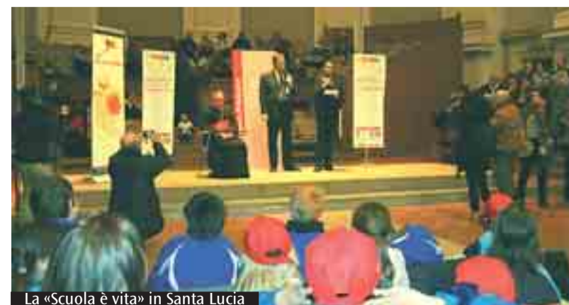
«La Scuola è vita» in Santa Lucia