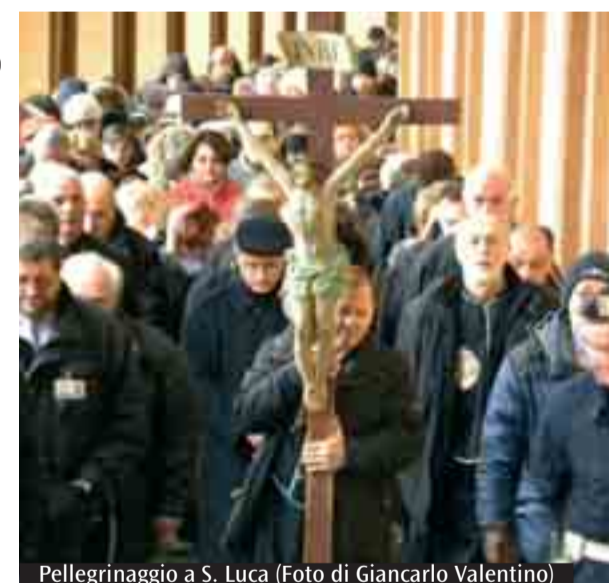
Pellegrinaggio a S. Luca

battesimo che non solo purifica, ma crea e consacra. A questo punto Dio avanza la grande richiesta: "Chi manderò e chi andrà per noi?" Isaia risponde: "Eccomi, manda me!". Questa risposta nasce da un uomo in possesso della grazia di Dio e, perciò, capace in piena libertà di mettere in campo la sua disponibilità, con entusiasmo e prontezza - senza riserve o restrizioni mentali - per introdurre nel mondo la Parola di Dio che salva l'uomo dal male, dalla morte e da una vita senza senso». Gesù, presso il lago di Genezaret, delinea, ha proseguito, con più precisione il senso della chiamata al ministero. «Sulla tua parola getterò le reti» e il risultato è sorprendente: "presero una quantità enorme di pesci". Di fronte a questo prodigio, Simone, come Isaia, avverte la sua inconsistenza. «Ma proprio sulla pochezza di Simone e dei suoi» ha osservato il vescovo ausiliare «Gesù innesta la sua proposta stupefacente e rivoluzionaria. "Non temere - disse a Simone - d'ora in poi sarai pescatore di uomini". E senza indugio, "lasciarono tutto e lo seguirono". Proprio nel "lasciare" e nel "seguire" ha affermato il vicario generale «emerge l'originalità della vocazione cristiana, caratterizzata