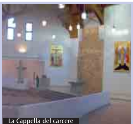
La Cappella del carcere