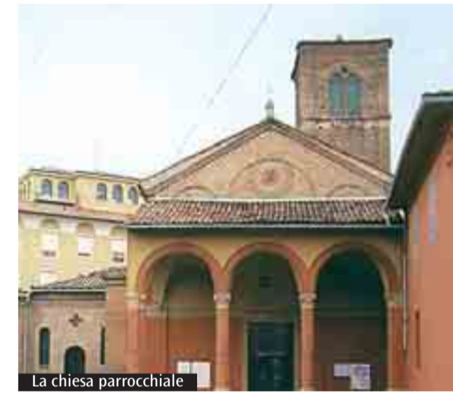
La chiesa parrocchiale