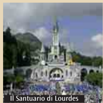
Il Santuario di Lourdes

Tre i pellegrinaggi a Lourdes promossi da Petroniana Viaggi da Pasqua al mese di giugno. Il primo si terrà da 3 al 6 aprile, in pieno periodo pasquale (e vi sono ancora