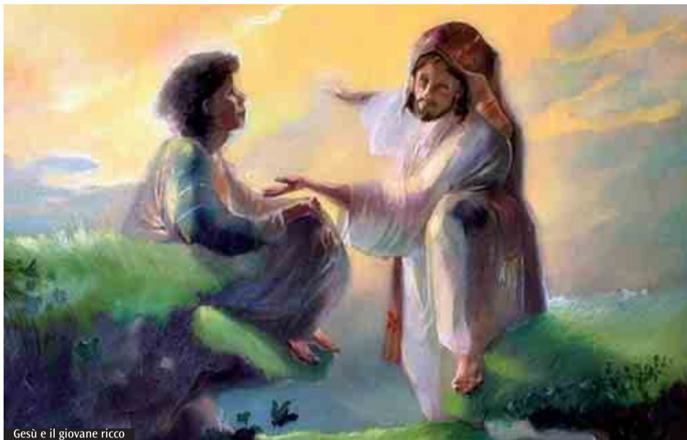
Gesù e il giovane ricco

confrontati con fondamentali esigenze? oppure la libertà è un assoluto? Provate a riflettere un momento. A vostro giudizio, la vita di Hitler ha la stessa qualità della vita di Madre Teresa? Eppure ambedue hanno realizzato quel progetto di vita che ciascuno dei due si era dato liberamente. E se, come sono sicuro, nessuno di voi compie quell'equiparazione, è perché non sono necessari tanti ragionamenti per capire che il valore della vita non dipende esclusivamente dalla realizzazione del progetto che ciascuno liberamente si propone. Ma dipende dalla qualità del progetto stesso. Mi spiego con un esempio. Se il progetto di un edificio è disegnato male; se i calcoli sono sbagliati, costruito l'edificio, esso crolla. Se il progetto che dai alla tua vita non è buono, la tua vita