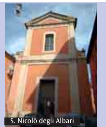
S. Nicolò degli Albari

«Dalle mezzogiorno, fino alle tre del pomeriggio»: è questo secondo il racconto evangelico della Passione di Cristo, il tempo delle tenebre, che calarono fitte sul mondo, ad annunciare la morte del Figlio di Dio fatto uomo. Per onorare il sacrificio redentore, anche nel prossimo Venerdì Santo, 2 aprile, nella Chiesa di San Nicolò degli Albari (via Oberdan 17), si terranno tre ore di preghiera, dall'ora sesta all'ora nona, scandite dalla meditazione delle ultime parole di Cristo sulla croce. La proposta vuole essere un modo concreto per santificare il digiuno del Venerdì di Passione, secondo l'antichissima tradizione della Chiesa.