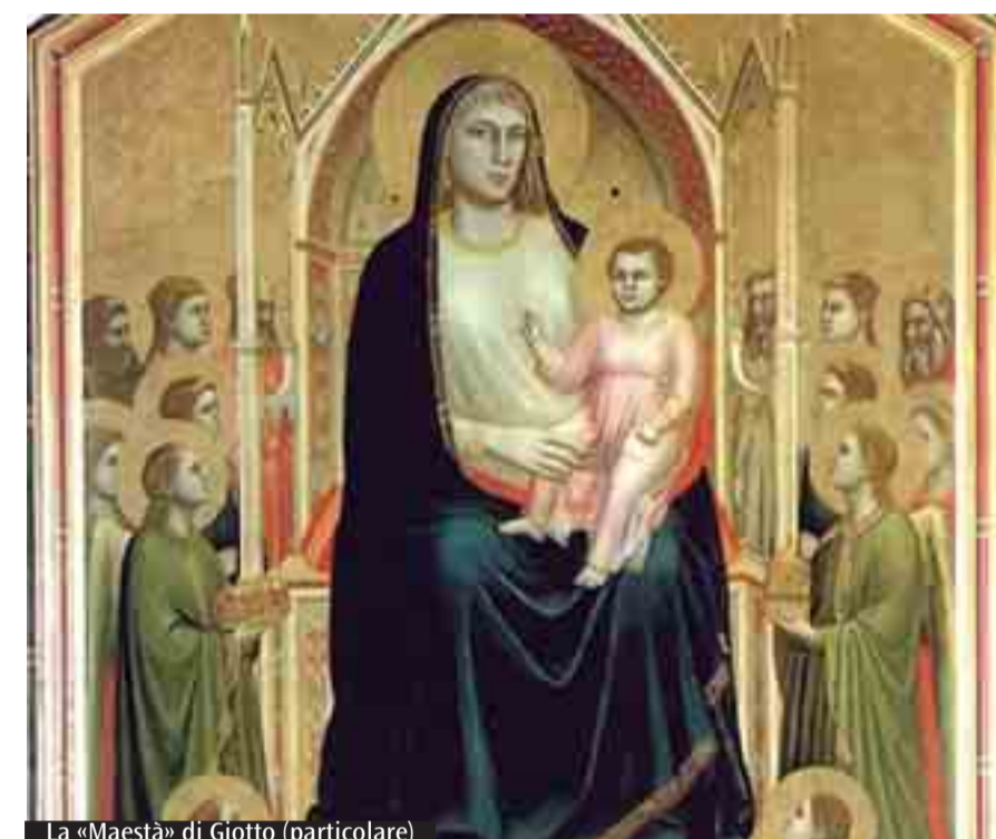
La «Maestà» di Giotto (particolare)

Restauro, un'arte affascinante: l'esperienza di due donne artigiane