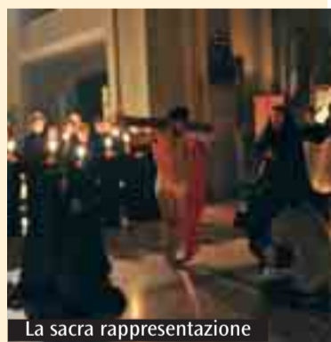
La sacra rappresentazione