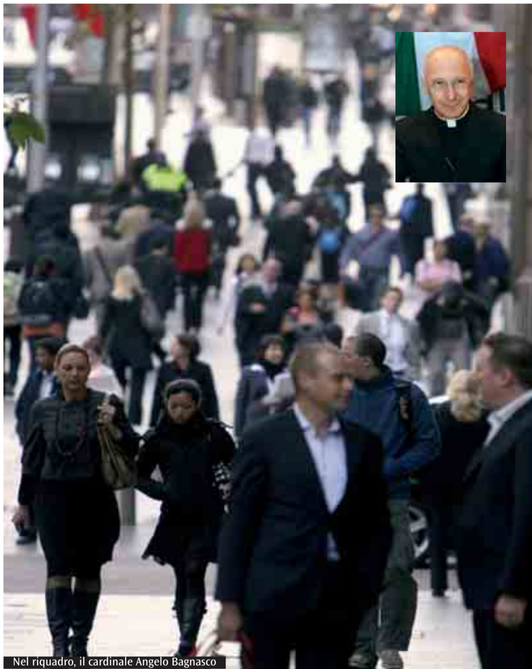
Nel riquadro, il cardinale Angelo Bagnasco

Oggi e domani si vota per scegliere il nuovo presidente regionale e rinnovare l'assemblea legislativa. Come ricordavamo domenica scorsa, pur in una situazione di grande disaffezione verso la cosa pubblica, l'esercizio del diritto di voto è di vitale importanza per il futuro della nostra regione. Per questo motivo devono essere respinte sia la tentazione dell'astensione che quella di annullare la scheda. Anche perché il voto amministrativo è in primo luogo un voto politico nel senso più alto. Significa che ci interessa e che siamo preoccupati per quanto succede nella nostra grande casa regionale. E non vogliamo lasciare l'esclusiva delle decisioni alle lobby o a coloro - partiti o persone - che sono disponibili a mettere sul tavolo del negoziato anche principi e valori non negoziabili. Inoltre ricordiamoci che tra gli strumenti che il grande gioco della democrazia ci mette a disposizione c'è quello della preferenza personale. Usiamola.