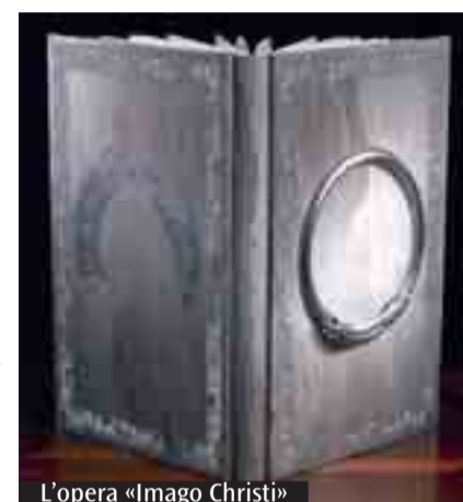
L'opera «Imago Christi»

«Imago Christi», il libro - opera d'arte totale promosso dalla Fondazione Marilena Ferrari - Fmr per celebrare i cento anni dalla nascita di madre Teresa di Calcutta e ispirato alle Beatitudini evangeliche, si fa filmato. A promuovere l'iniziativa è l'Istituto Veritatis Splendor settore Arte e catechesi in collaborazione con la Galleria d'Arte moderna «Raccolta Lercaro». Il cortometraggio, pensato per far conoscere