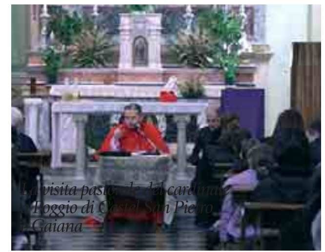
Caffarra: «Vivete intensamente la Pasqua»

* parroco a Poggio e Gaiana e rettore santuario Madonna di Poggio