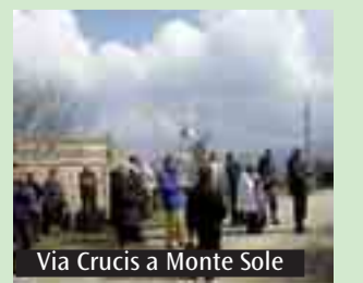
Via Crucis a Monte Sole

A cura della parrocchia di Sasso Marconi sarà celebrata anche quest'anno, oggi, domenica delle Palme, alle ore 15 a Casaglia di Caprara, la Via Crucis sul percorso compiuto il 29 settembre 1944 dal parroco e dai parrocchiani di quella comunità che consacrò col sangue del proprio martirio la terra di Monte Sole. Non si tratta solo di ravvivare la memoria o di celebrarne il ricordo, ma anche di riconoscere la fecondità di quel sacrificio e di recuperare il valore di uno straordinario patrimonio spirituale che appartiene alla nostra Chiesa bolognese.