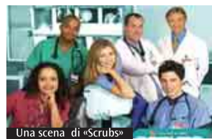
Una scena di «Scrubs»

ba da poco proporlo in una storia televisiva per ragazzi, per mostrare come in realtà c'è un tempo per ridere e un tempo per riflettere. La morte fa riflettere e obbliga a pensare. Certo, in «Scrubs» c'è un bel po' di allusioni sessuali e di battute gravi: ma ci scandalizziamo? Anzi: non ci scandalizziamo per i programmi che inneggiano alla vincita di migliaia di euro solo per una botta di fortuna e ci scandalizziamo per qualche allusione da liceali? Ai ragazzi «Scrubs» piace perché fa ridere, ma anche perché fa riflettere. E ci piace che un messaggio buono venga da un'emittente liberal come MTV, che spesso invece trasmette programmi che troppo pigiano sul tasto delle fortune e delle sregolatezze delle star di Hollywood senza un commento critico. Certo, «Scrubs» non è un esempio di morale e non la indichiamo come tale; ma mostra come la televisione possa essere usata per far riflettere e sorridere, e che non si debba essere per forza pesanti per ottenere la riflessione e stupidi per ottenere la risata.