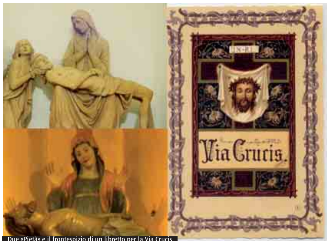
Due «Pietà» e il frontespizio di un libretto per la Via Crucis