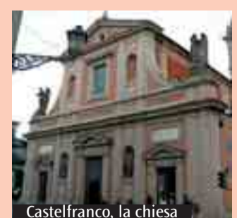
Castelfranco, la chiesa