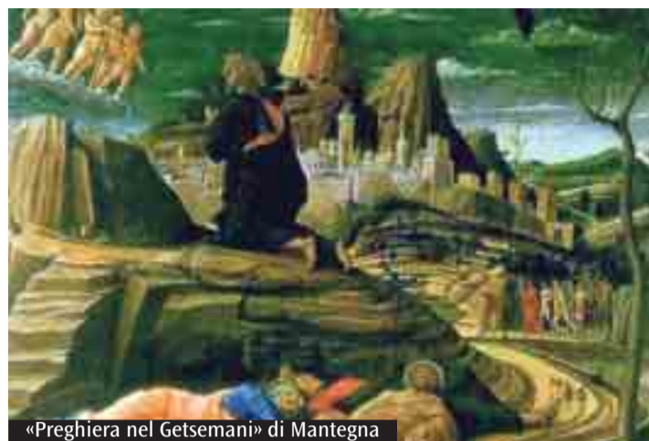
«Preghiera nel Getsemani» di Mantegna

Alle 10 Messa dell'Arcivescovo al carcere della Dozza; alle 17.30 in Cattedrale Messa episcopale di Pasqua.