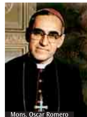
Mons. Oscar Romero