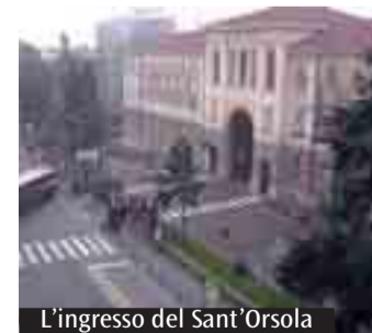
L'ingresso del Sant'Orsola

con essi, culminante nell'Eucaristia quotidiana e festiva. Eucaristia che ha come fonte e centro appunto il Sacro Triduo. Certo, in ogni malato si compie il mistero pasquale di Cristo paziente, morto e risorto, ma la celebrazione liturgica e comunitaria della Settimana Santa conferisce una vera grazia a chi vive il dramma della morte e la difficile circostanza della malattia e del dolore, dando a tale esperienza pieno compimento e significato. In questi giorni importanti di preparazione alla Domenica di Risurrezione, noi che passiamo per i reparti del vasto Ospedale riceviamo molti segni di accoglienza, non solo da parte dei ricoverati e dei loro familiari, ma anche del personale lavorativo. Questi ci chiede una visita per benedire i locali, mostrandoci una non comune sensibilità per la presenza della comunità cristiana in questo luogo e l'attesa di una grazia che misteriosamente si spera dalle feste pasquali.