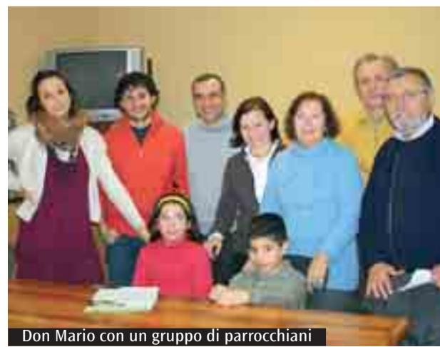
Don Mario con un gruppo di parrochiani