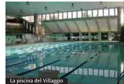
La piscina del Villaggio

Continua la proposta sportiva dell'Asd Villaggio del Fanciullo (via Scipione dal Ferro, 4), promossa con lo slogan: «Lo sport per tutta la famiglia». La proposta del mese riguarda l'attività di più piccoli, gestanti e neomamme. Viene proposto, infatti, «Baby sport» per bimbi di 3-4 anni: attività ludico-motoria (sabato mattina alle 10.30 per 50 minuti), con istruttori qualificati per un primo approccio all'attività sportiva con il gioco (nella palestra). L'attività per gestanti e neomamme, invece, si svolge in piscina. Si tratta di un corso di ginnastica in acqua specifico per le gestanti fin dai primi mesi di gravidanza. Per il post parto l'attività si compone di un corso di ginnastica in acqua specifico per le neomamme, che possono recuperare la tonicità muscolare. Info o iscrizioni tel. 051.587764 (www.villaggiodefanciullo.com).