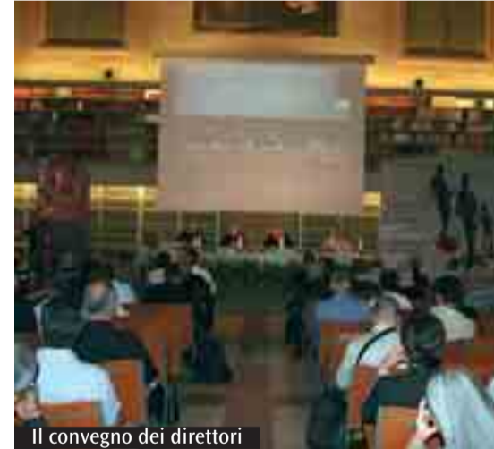
Il convegno dei direttori