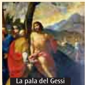
La pala del Gessi

Seguirà la falsariga della festa dell'anno scorso, la celebrazione di S. Giovanni Battista nell'omonima parrocchia di Trebbio di Reno. L'apertura, giovedì 24, festa liturgica del santo, sarà infatti affidata ad una riflessione che terrà alle 20.45 nella chiesa parrocchiale monsignor Lino Goriup, vicario episcopale per la Cultura: tema, «Giovanni Battista testimone», richiamandosi anche alla pala d'altare del Gessi che raffigura appunto il Battista che indica Gesù come «agnello di Dio» ai propri discepoli. Domenica 27 alle 18.30 Messa solenne del patrono e benedizione alla località di Trebbio con le reliquie di san Giovanni Battista. Seguirà un rinfresco a cui ciascuno è chiamato a portare il proprio contributo.