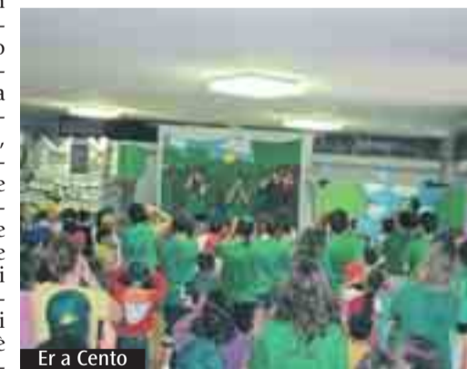
Er a Cento