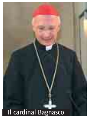
Il cardinal Bagnasco

Innanzitutto la relazione con Dio. Gesù annuncia che la maturità umana non consiste in una chiusura della persona in sé stessa e nel proprio mondo, ma nell'apertura al dialogo con Dio. La catechesi ha precisamente questo compito. Solo l'uomo, a differenza degli animali, è capace di questa relazione, di spiritualità. Ecco perché trascurare la dimensione della fede in ambito educativo vuol dire ferire la stessa dignità dell'uomo: essa non è un elemento accessorio rispetto all'intero processo educativo, ma vi appartiene di diritto con un ruolo centralissimo. Di qui il grande valore della catechesi, come pure dell'Insegnamento della Religione nella scuola. La seconda relazione costitutiva cui Gesù rimanda è quella