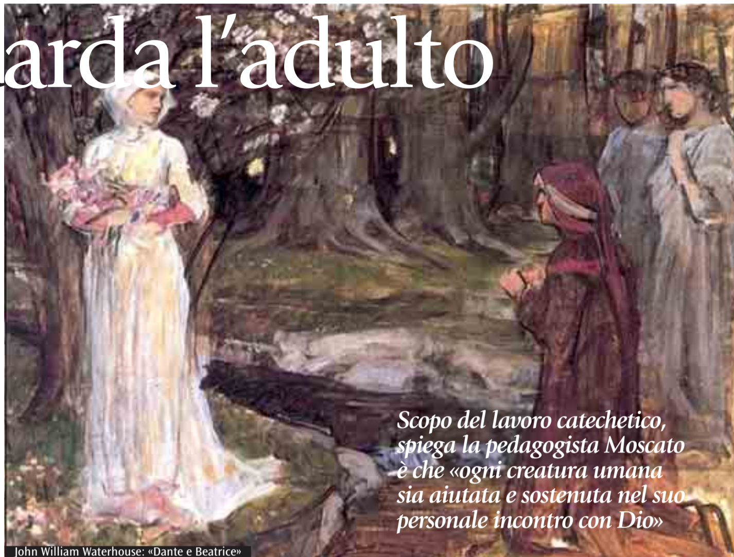
John William Waterhouse: «Dante e Beatrice»

Che ogni figlio di Dio, generato dal Suo pensiero creatore, possa «conoscere il Padre e Colui che il Padre ha mandato»; in altri termini, che ogni creatura umana sia aiutata e sostenuta nel suo personale incontro con Dio.