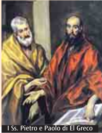
I Ss. Pietro e Paolo di El Greco

Domenica prossima, in prossimità alla festa dei Santi Pietro e Paolo, si celebra la Giornata per la Carità del Papa, dedicata alla preghiera per il successore di Pietro e alla raccolta a sostegno del suo altissimo ministero. Alle 17.30, in Cattedrale, dopo il Vespri capitolare, l'Arcivescovo celebrerà la Messa votiva di San Pietro. Martedì 29, in occasione della festa titolare della Cattedrale, alle 17 ci sarà il Vespri capitolare e alle 17.30 la Messa solenne, celebrata da monsignor Claudio Righi, nel 60mo anniversario dell'Ordinazione sacerdotale.