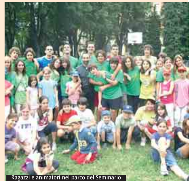
Ragazzi e animatori nel parco del Seminario