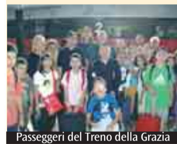
Passeggeri del Treno della Grazia

E' passato da Bologna il 24° «Treno della Grazia», un carico di 350 bambini e oltre 200 accompagnatori, tra infermieri e assistenti e familiari, diretto al Santuario di Loreto. La tradizionale iniziativa, che è organizzata dall'Acr e dall'Unitalsi Emilia Romagna, con la collaborazione del Crf (Centro regionale di pastorale familiare) porta ogni anno a Loreto famiglie e ragazzi di tutta la regione, da Piacenza a Rimini. A guidare i pellegrini il presidente Italo Frizzoni, per il suo ultimo pellegrinaggio a capo