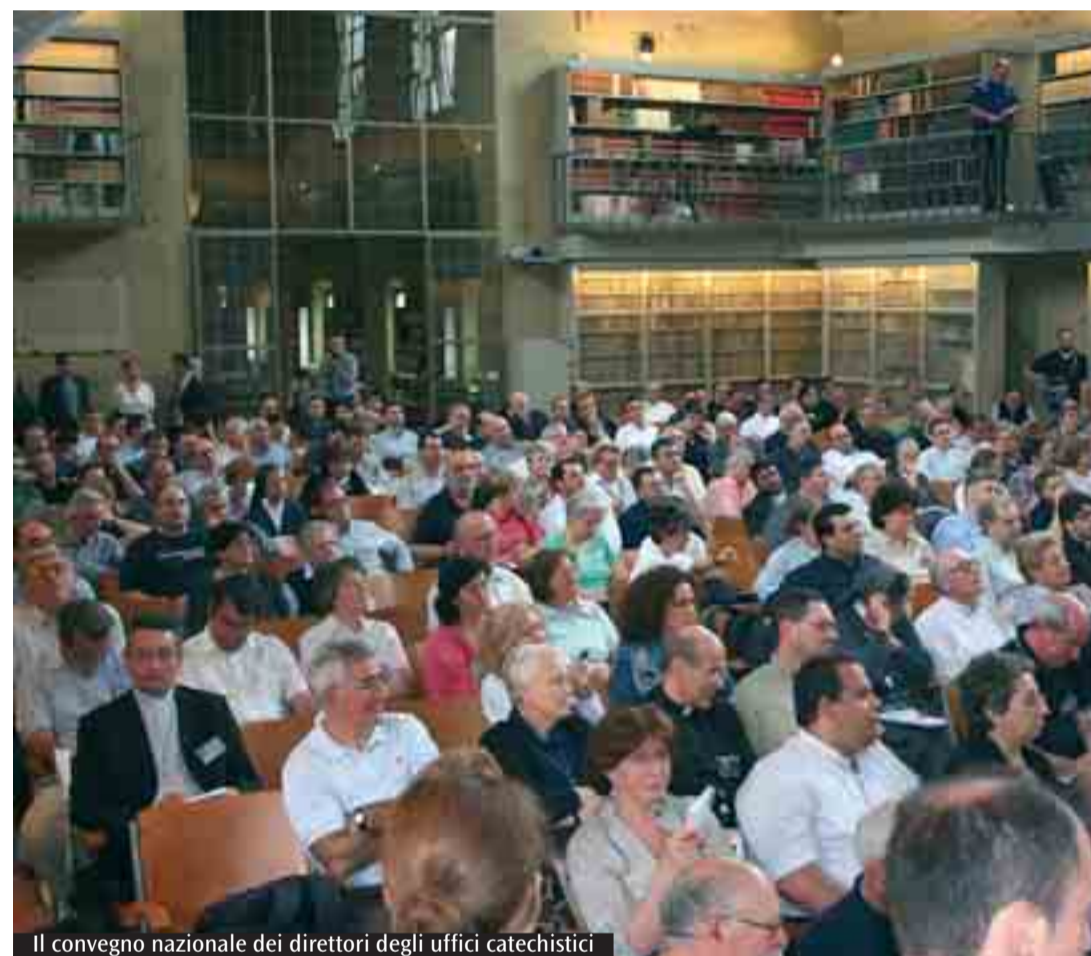
Il convegno nazionale dei direttori degli uffici catechistici

«Primo piano» sul convegno dei direttori degli uffici catechistici