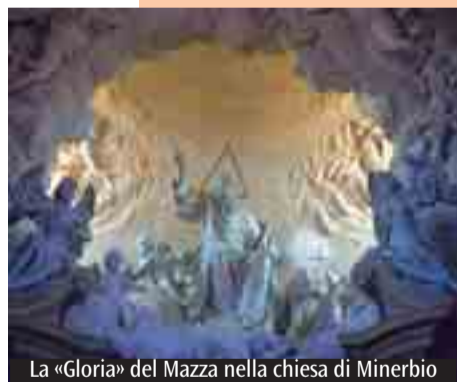
La «Gloria» del Mazza nella chiesa di Minerbio