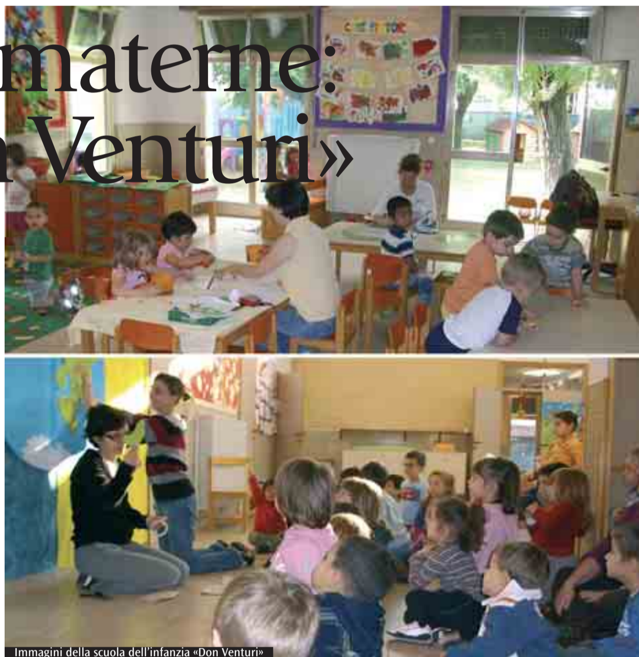
Immagini della scuola dell'infanzia «Don Venturi»