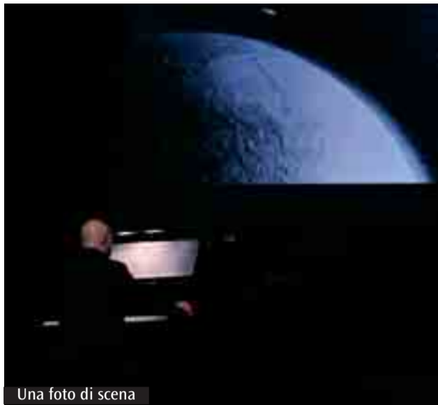
Una foto di scena