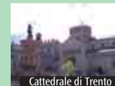
Cattedrale di Trento

Sabato 26 il cardinale Carlo Caffarra sarà a Trento, in occasione delle celebrazioni per il patrono della città san Vigilio. L'Arcivescovo presiederà