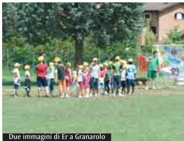
Due immagini di Er a Granarolo