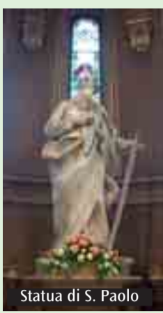
Statua di S. Paolo

Grande festa, sabato 26 e domenica 27 nella parrocchia di San Paolo di Ravone in onore del patrono. Sabato 26 dalle 16 giochi in piazzetta e oratorio, alle 19 apertura stands gastronomici e poi musica dal vivo: «Mr Loudman & the bluesers», alle 20 «Arma's Blues Band», infine alle 21 «Senit e i suoi Sdruciti». Domenica 27 alle 11.30 Messa solenne animata dal coro «Don Bosco»; alle 17.30 celebrazione eucaristica solenne presieduta dal vescovo ausiliare monsignor Ernesto Vecchi e seguita dalla processione. Alle 19 apertura degli stands gastronomici e alle 19.30 musica dal vivo: «17th Abyss Trippers»; alle 21 spettacolo di improvvisazione teatrale: «Fast food impro... il ritorno».