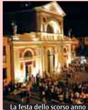
La festa dello scorso anno