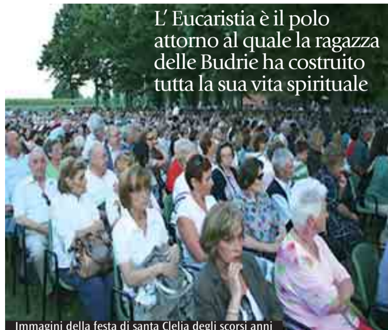
L'Eucaristia è il polo attorno al quale la ragazza delle Budrie ha costruito tutta la sua vita spirituale