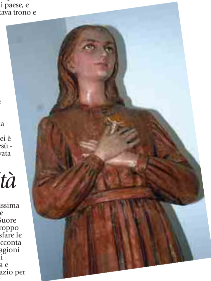
Luoghi di Clelia continuano a rappresentare un solido punto di riferimento per molti credenti: «Ci fanno visita anche tanti malati. Alla fine del periodo trascorso con noi ringraziano con il cuore la Santa per le grazie ricevute. Con Clelia la gente ritrova la pace che aveva perduto, in ogni caso, qualunque sia il dolore che la affligge. Noi Sorelle accogliamo tutti con gioia e siamo sempre contente di poter aiutare».

l'Eucaristia e dove i pellegrini amano fermarsi per qualche istante a pregare in raccolta adorazione. L'amore all'Eucaristia di Clelia è diventato una specie di testamento spirituale che ha lasciato a tutti i suoi devoti. Non si può infatti amare Santa Clelia se non si ama Gesù nell'Eucaristia. Oggi tocca a noi imitarla.