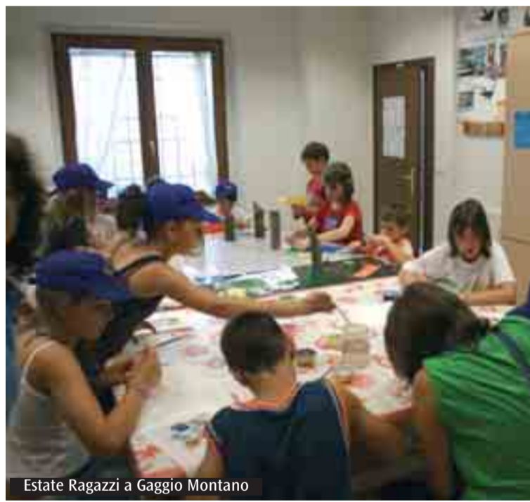
Estate Ragazzi a Gaggio Montano