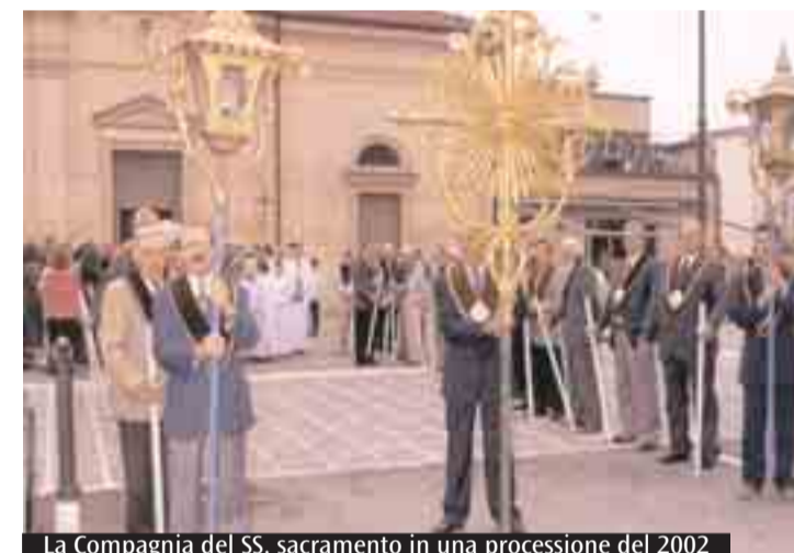
La Compagnia del SS. sacramento in una processione del 2002

N ella parrocchia di San Sebastiano di Renazzo inizia domani una settimana di preparazione in vista di due importanti occasioni di festa, la solennità della Madonna del Carmine e il 500° centenario della Compagnia del SS. Sacramento, di cui la Madonna del Carmine è patrona. Si intrecceranno nella settimana vari momenti di preghiera: domani alle 20.30 Rosario in chiesa; martedì biciclettata al Santuario della B. V. della Valle a Bevilacqua, dove alle 20.30 si reciterà il Rosario; mercoledì alle 20.30 liturgia penitenziale e giovedì, alla stessa ora, Messa in suffragio dei confratelli defunti. Domenica 18 Messa alle 10 e alle 18. Quella delle 10 sarà presieduta dal Provicario generale monsignor Gabriele Cavina, con la partecipazione delle Confraternite della diocesi. Al termine, solenne processione con la statua della Madonna lungo le vie del cen-