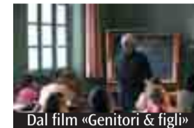
Dal film «Genitori & figli»

Le altre sale della comunità sono chiuse per il periodo estivo