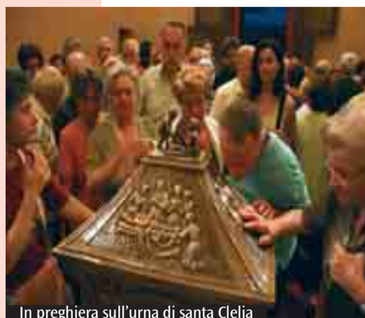
In preghiera sull'urna di santa Clelia