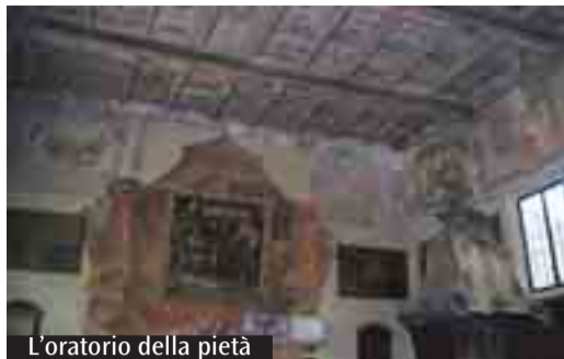
L'oratorio della pietà

La Parrocchia di S. Silvestro di Crevalcore, celebra anche quest'anno la «Madonna del Carmine», nel solco di una tradizione lunga più di quattrocento anni. Domenica 18 Luglio saranno celebrate le S. Messe alle ore 9, alle ore 11 (con particolare solennità) e alle 18.30. Questa ricorrenza è anche occasione per tutto il Paese per allestire e vivere la tradizionale Fiera, che vede impegnate tutte le realtà del territorio da giovedì 15 a lunedì 19. La ristrutturazione