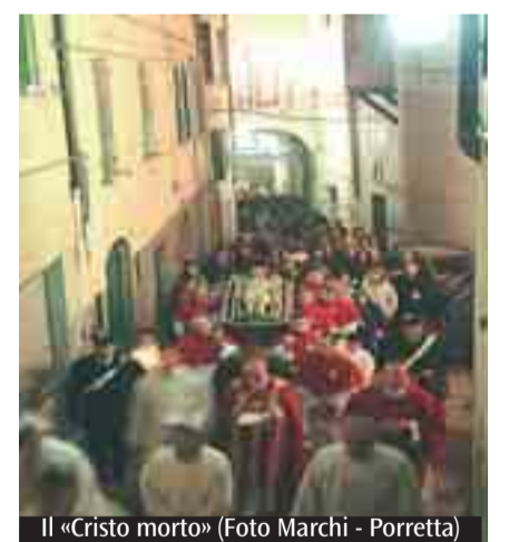
Il «Cristo morto»