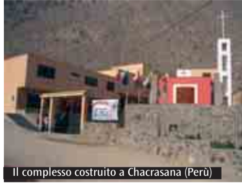
Il complesso costruito a Chacrasana (Perù)