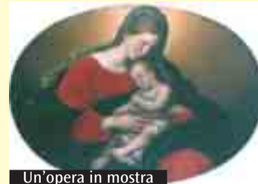
Un'opera in mostra

«G. Marconi». Fra le opere esposte, provenienti da collezioni private, si possono osservare quadri, crocifissi, icone, ceramiche, sculture, ostensori, calici e vari arredi sacri: è una rassegna di notevole interesse. La mostra è aperta dalle ore 15 alle 19 nei giorni feriali; dalle 9 alle 12,30 e dalle 15 alle 19 il sabato e la domenica.