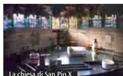
La chiesa di San Pio X

convegno internazionale d'architettura sacra. Vi parteciparono nomi importantissimi. Non si metteva molto in mostra, ma dietro le cose più importanti che nell'architettura sacra succedevano in quegli anni, c'era sempre lui. Cosa disse il mondo degli architetti di San Pio X? La chiesa vinse il Premio Inarch, riconoscimento internazionale prestigioso, nel 1969. Quando a Bologna venne in visita Marcel Breuer, grande nome dell'architettura e del design, volle vederla, guidato da chi l'aveva progettata. (C.S.)