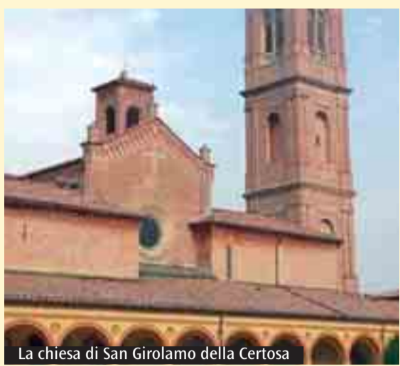
La chiesa di San Girolamo della Certosa