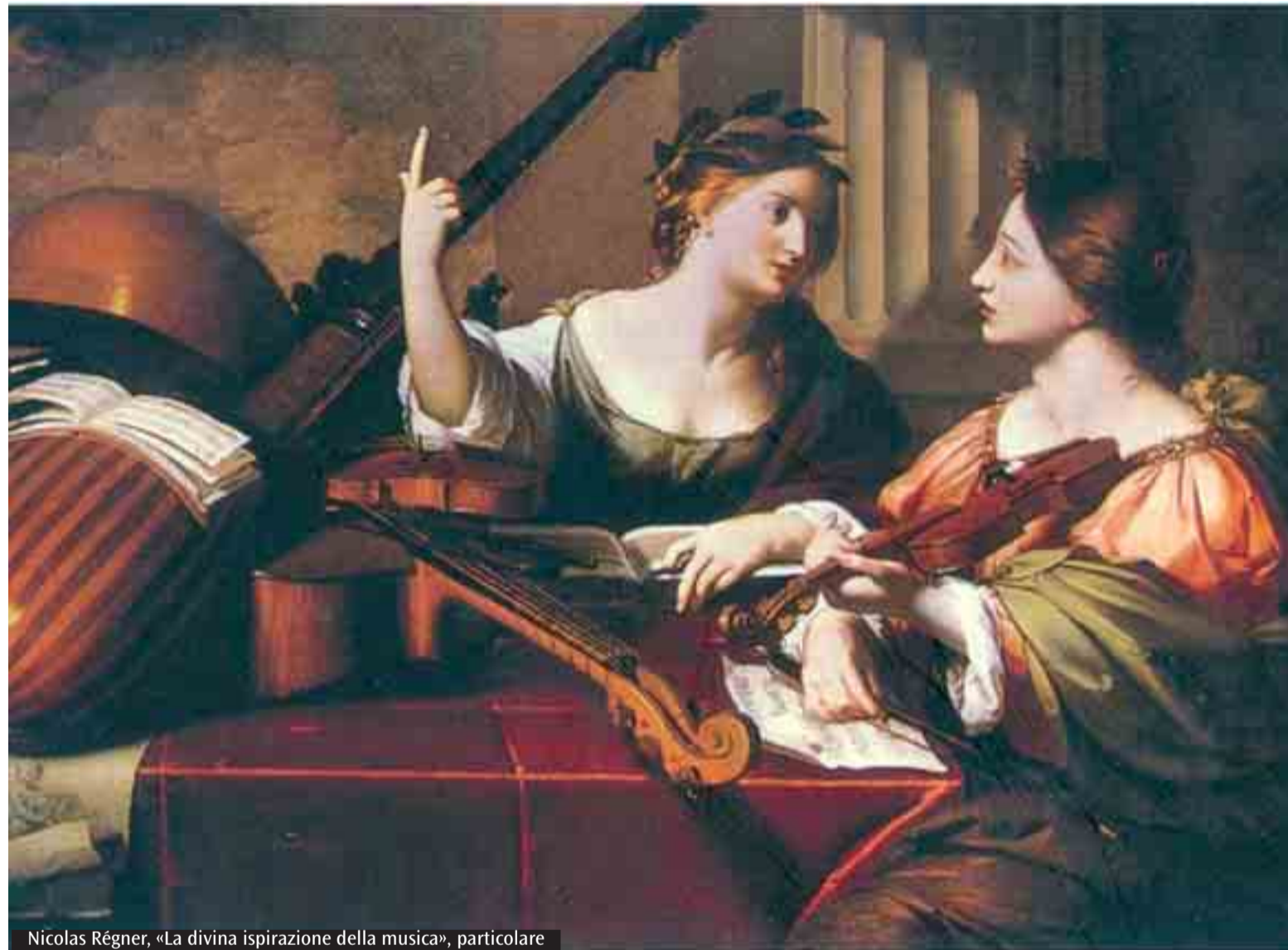
Nicolas Régnier, «La divina ispirazione della musica», particolare