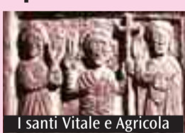
I santi Vitale e Agricola

G iovedì 4 novembre si celebra la festa dei Ss. Vitale e Agricola, protomartiri della Chiesa bolognese. Nella parrocchia loro dedicata, (via San Vitale 50) la Messa solenne sarà alle 19: presiederà monsignor Vincenzo Zarri, vescovo emerito di Forlì, che impartirà la Cresima ad alcuni ragazzi della parrocchia. La Messa sarà preceduta alle 18.30 dai Secondi Vespri dei martiri, mentre i Primi Vespri saranno mercoledì 3 alle 18.30, seguirà la Messa alle 19. Giovedì 4 mattina Messe alle 8.30 e 10.30.