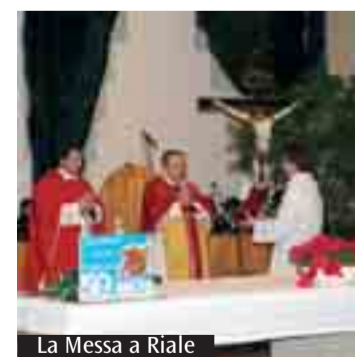
La Messa a Riale

celebrazione. La parrocchia è la presenza della Chiesa in un territorio perché è la comunità di coloro che professano la vera fede, celebrano i santi sacramenti, e camminano nella via della salvezza sotto la guida dei loro pastori. Vi ho parlato poc'anzi di due «campi di forze» e dei «dominatori di questo mondo». Nella parrocchia voi incontrate la presenza del Signore che opera la vostra salvezza; è in essa che potete «rivestirvi dell'armatura di Dio» «per poter resistere alle insidie del diavolo». Celebriamo dunque nella gioia questo anniversario e lodiamo il Signore perché in questi cinquant'anni vi ha convocati attorno a Lui e vi ha messo nelle mani «lo scudo della fede, col quale potrete spegnere tutti i dardi infuocati del maligno». Benedetto il Signore, vostra roccia, che durante questi cinquant'anni ha addestrato le vostre mani alla guerra, e le vostre dita alla battaglia: Lui, vostra grazia e vostra fortezza, vostro rifugio e vostra liberazione. Dall'omelia del cardinale a Riale