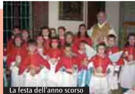
La festa dell'anno scorso