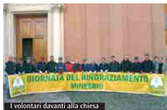
I volontari davanti alla chiesa

come momento centrale la Messa domenica 7 novembre alle 10,30 nella chiesa parrocchiale; nelle parrocchie delle frazioni saranno celebrate altre Messe: a S. Martino in Soverano alle 9,45 e a Cà de' Fabbri alle 11. A partire dalle 9 sarà possibile visitare mostre ed esposizioni come quella di macchine agricole innovative, quelle di utensileria rurale, hobbistica, animali da cortile e altre ancora. Alla stessa ora inizieranno la Gara delle Vettrine, e l'Estemporanea di Pittura per ragazzi. Inoltre sarà presente il «Mercatino di ieri e di oggi», ed il mercato delle aziende agricole «Campagna Amica». Nel pomeriggio spettacolo gratuito per i bambini in parrocchia. Non mancheranno punti di ristoro. Il ricavato della manifestazione sarà interamente devoluto in beneficenza. Ugualmente da non mancare i due appuntamenti che precedono la festa. Mercoledì 3 novembre in Palazzo Minerva conferenza di Cesare Fantazzini a cura del centro Culturale