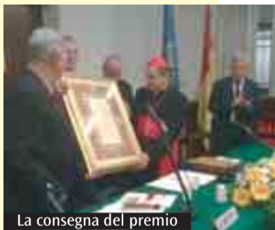
La consegna del premio