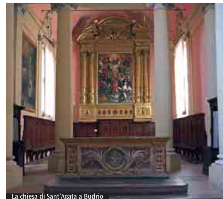
La chiesa di Sant'Agata a Budrio