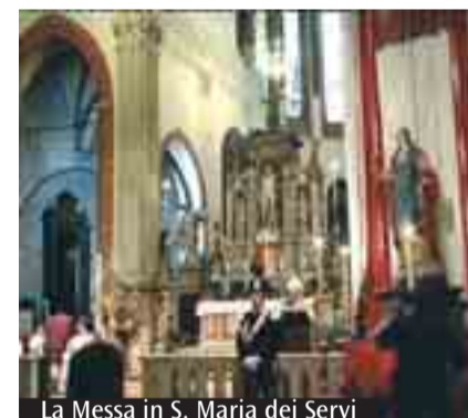
La Messa in S. Maria dei Servi

descrivere questi valori: voi ben li conoscete. Stanno scritti nei vostri Statuti, soprattutto sono stati mostrati da coloro fra voi che sono rimasti