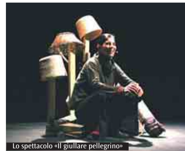
Lo spettacolo «il giullare pellegrino»