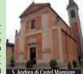
S. Andrea di Castel Maggiore