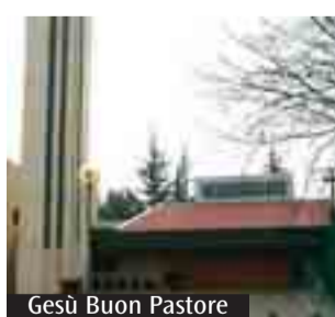
Gesù Buon Pastore