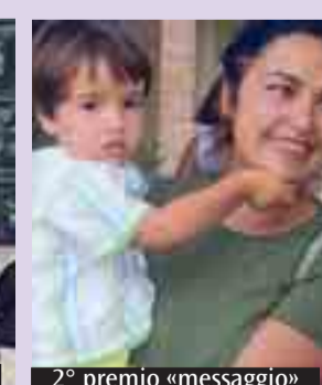
2° premio «messaggio»