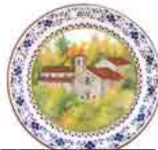
Piatto di Natale «Face» 2010

«Collaboriamo da tempo a questa bella iniziativa - ricorda da parte sua Zagnoni - e in questa occasione, ho raccontato la bella storia e la grande devozione riguardante la Madonna di Calvigi». «È davvero un'iniziativa valida - afferma monsignor Roberto Macciantelli, vice rettore del Santuario - perché fa del bene, e insieme valorizza i nostri Santuari». (C.U.)