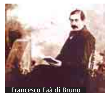
Francesco Faà di Bruno

rinense con un programma preciso: svecchiare l'insegnamento con l'introduzione di nuove materie e divulgare, attraverso trattati, i risultati della ricerca internazionale. Questo programma si iscrive, però, in un progetto più ampio. Nel volgere di pochi anni, con un'intuizione anticipatrice del ruolo dei laici nella Chiesa, dà vita a numerose iniziative assistenziali e caritative e si rivolge alla promozione sociale e religiosa della donna fondando nel 1859 l'Opera pia di S. Zita, una casa d'accoglienza per lavoratrici disoc-