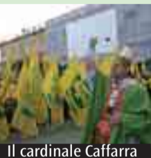
Il cardinale Caffarra