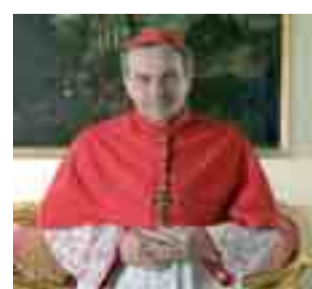
servizio a pagina 3

Il tempo dell'Avvento è percorso da una duplice attesa: l'attesa del ritorno glorioso del Signore; l'attesa della celebrazione liturgica del Natale del Signore nella nostra natura umana. Il giudizio del Signore riguarderà l'esercizio della carità, dal momento che il Verbo fattosi carne, in un contesto di profonda umiltà, si è identificato con ogni povero. La grave crisi economica continua a colpire le famiglie. Il numero di chi si trova nell'impossibilità di pagare l'affitto, le utenze e le spese scolastiche dei figli è