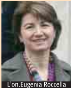
L'on. Eugenia Roccella