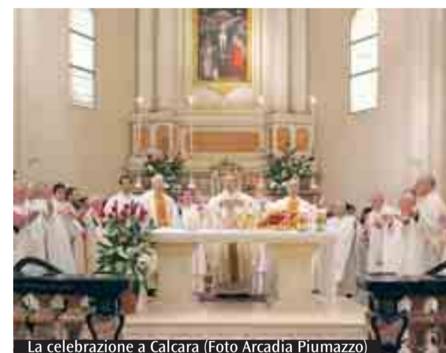
La celebrazione a Calcara