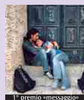
1° premio «messaggio»