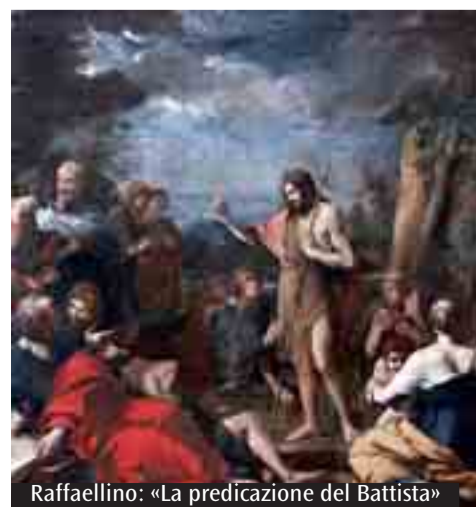
Raffaellino: «La predicazione del Battista»