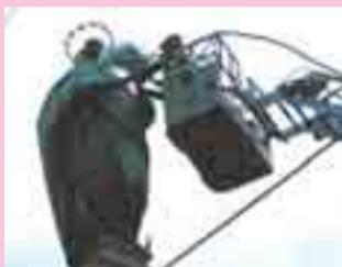
I Vigili del Fuoco alla Fiorita