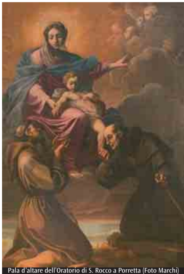
Pala d'altare dell'Oratorio di S. Rocco a Porretta