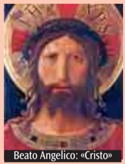
Beato Angelico: «Cristo»