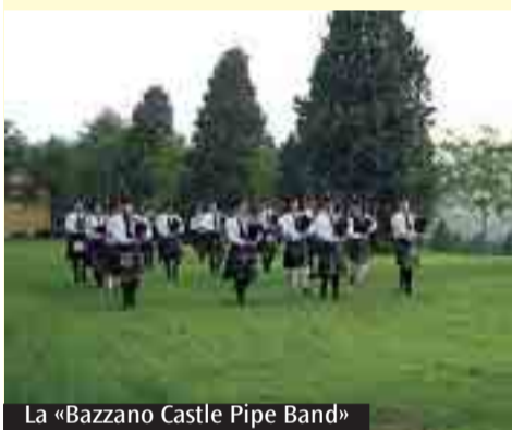
La «Bazzano Castle Pipe Band»