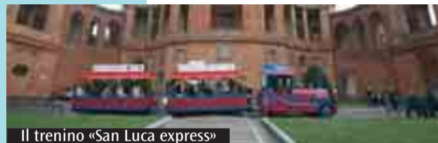
Il treno «San Luca express»