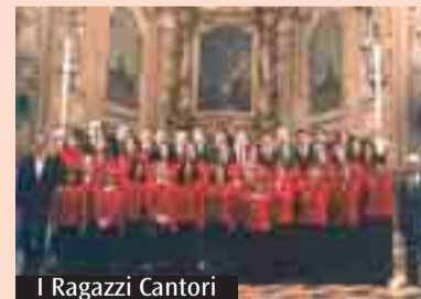
I Ragazzi Cantori