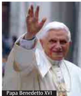
Papa Benedetto XVI

Monsignor Giovanni Silvagni, vicario generale