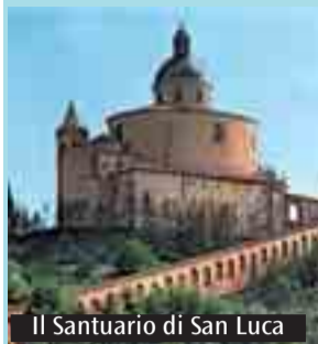
Il Santuario di San Luca