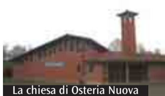
La chiesa di Osteria Nuova