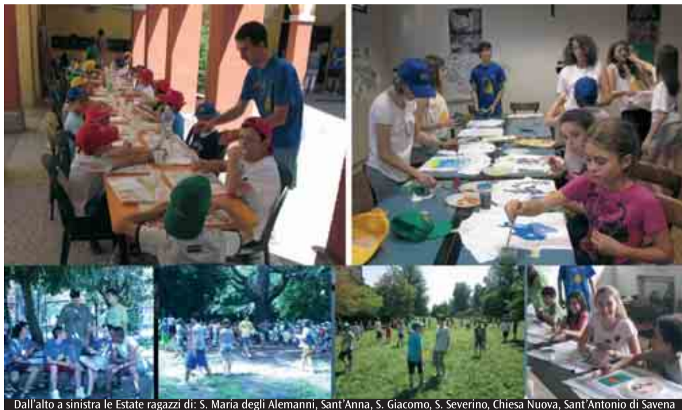
Dall'alto a sinistra le Estate Ragazzi di: S. Maria degli Alemanni, Sant'Anna, S. Giacomo, S. Severino, Chiesa Nuova, Sant'Antonio di Savena