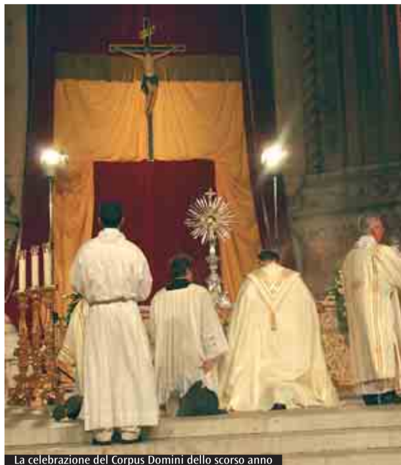
La celebrazione del Corpus Domini dello scorso anno