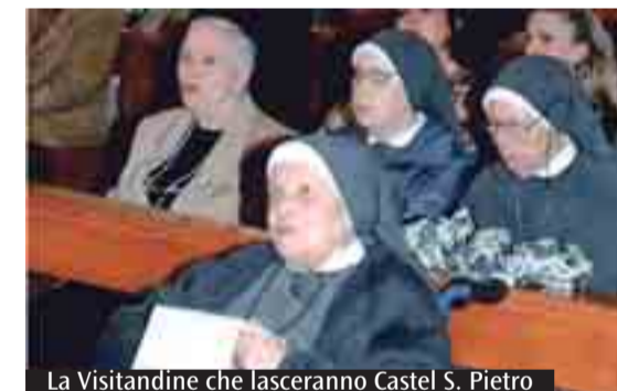
La Visitandine che lasceranno Castel S. Pietro