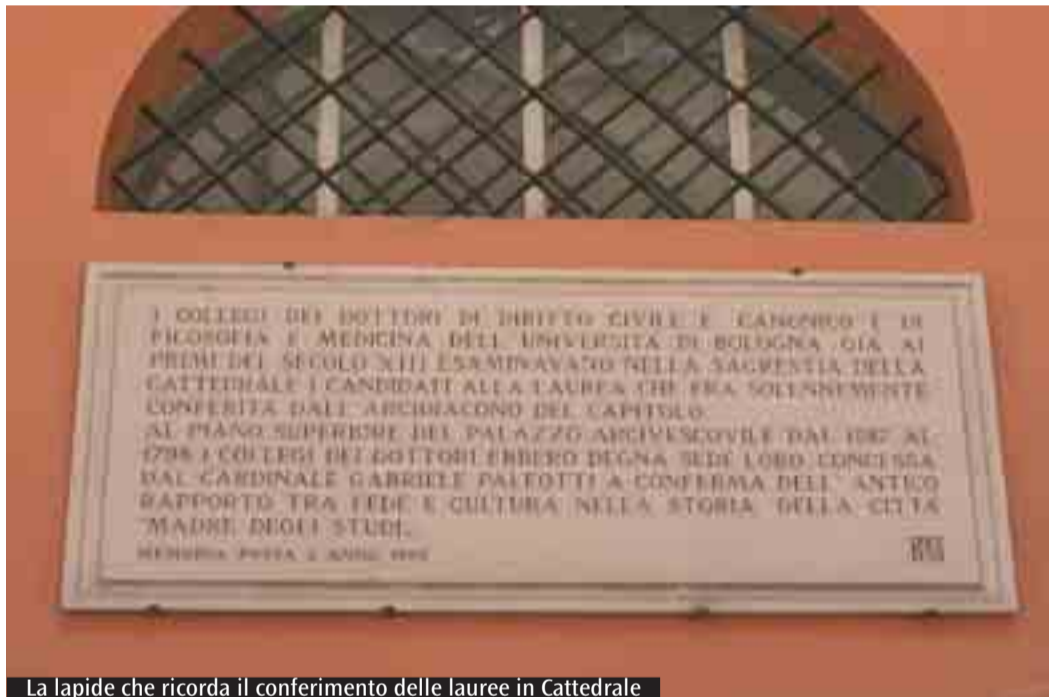
La lapide che ricorda il conferimento delle lauree in Cattedrale