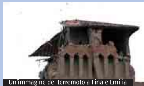
Un'immagine del terremoto a Finale Emilia

Cefa onlus organizza in agosto un campo estivo di volontariato con il quale si vuole fornire un contributo concreto e condividere l'esperienza della ricostruzione all'istituto tecnico agrario «Calvi» di Finale Emilia, gravemente colpito dal recente terremoto. L'attività volontaria sarà rivolta alla raccolta di pere coltivate nell'azienda agricola didattica dell'Istituto. Il campo è rivolto a tutte le persone con età non inferiore ai 18 anni; i periodi vanno