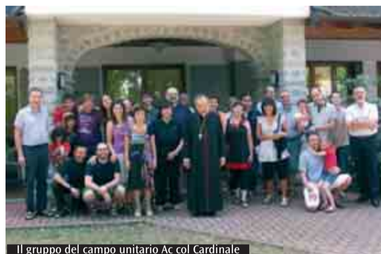
Il gruppo del campo unitario Ac col Cardinale

persone ed il loro agire. L'edificio ha una costruzione cristocentrica, ed ha il suo asse orientato alla vita eterna. Le leggi che regolano l'armonia intrinseca alla polifonia della fede, o che tengono assieme l'edificio sono: la legge delle divine missioni [il Padre manda il Figlio; il Padre e il Figlio mandano lo Spirito], che riflettono le divine processioni; la legge dell'e-e [Dio e l'uomo]; la legge della finalizzazione ecclesiale [l'opera salvifica è la Chiesa]. Concludo con due riflessioni. L'Anno