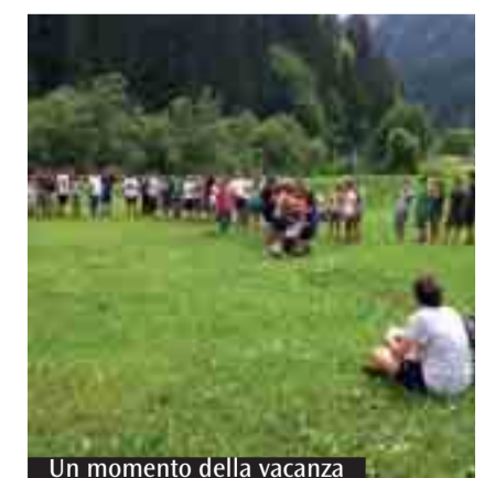
Un momento della vacanza