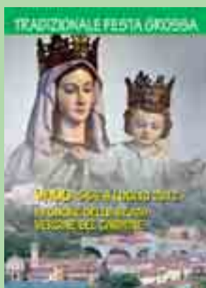
Immagine della Madonna del Carmine

bo7@bologna.chiesacattolica.it appuntamenti per una settimana