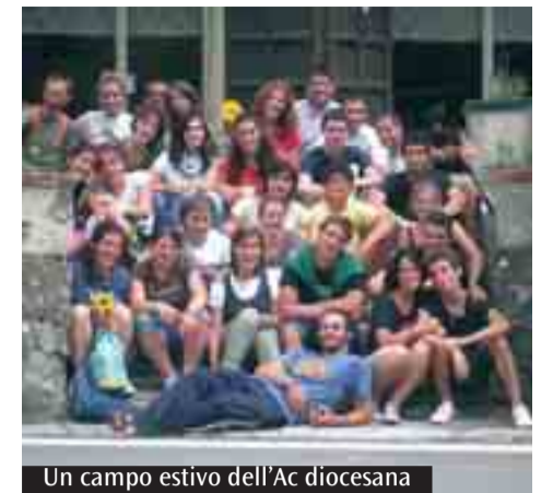
Un campo estivo dell'Ac diocesana

seminaristi ed educatori laici delle realtà parrocchiali, che vivranno direttamente l'esperienza del campo. A chi sono rivolti? La proposta comprende tante fasce d'età, a cui corrisponde un diverso approccio ai temi trattati e una specifica programmazione di attività e giornate: nei Campi Fanciulli e Ragazzi svolgono un ruolo chiave il gioco e l'animazione; nei Campi Giovanissimi e Giovani centrale è l'aspetto socializzante, i momenti dedicati alla riflessione e al confronto, le passeggiate e le escursioni; nei Campi per Famiglie e Adulti si vive con lo stile della «vacanza impegnata», avendo attenzione alle esigenze ed ai ritmi della famiglia. I campi diocesani sono aperti a chiunque desideri vivere un'esperienza di vita comunitaria, in spirito di fraternità e amicizia, condividendo lo stile essenziale