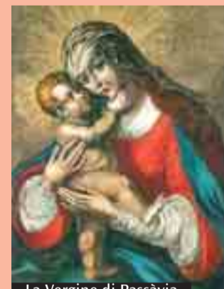
La Vergine di Passavia

Tante nostre comunità parrocchiali, specie se nei paesi, sono ricche di tradizioni legate alla fede. Anche la parrocchia di Crespellano - Pragatto può affermare di essere ricca, a questo riguardo. Lungo la via Bazzanese, circa 5 chilometri prima di raggiungere Bazzano, sulla sinistra, si nota una armoniosa chiesa-santuario dedicata alla Madre di Dio. Sul fronte di essa si può notare la scritta «Santa Maria Passaviensis», tradotta dal popolo «Santa Maria di Passavia». Tale denominazione trae la sua origine da Passau, cittadina della Baviera posta alla confluenza di ben tre fiumi (Danubio, Inn, e Ilz). In questa località, non molto lontana sia dai luoghi di nascita di Papa Benedetto XVI, che dal confine con l'Austria, in posizione leggermente sopraelevata sorge un Santuario che custodisce una venerata immagine della Madre di Dio, copia della quale si conserva anche nel nostro Santuario di Pragatto, dove è venerata da oltre quattrocento anni. Nel Santuario della Madonna di Pragatto, anche quest'anno si venera l'immagine lì custodita, accolta nella chiesa che è titolare della parrocchia stessa: Santa Maria Nascente. L'immagine viene così portata nella chiesa parrocchiale di «Pragatto Alto» e, da giovedì 5 luglio a domenica 8, alle 18 c'è la preghiera del Rosario, a cui segue la celebrazione della Messa alle 18.30. In particolare, Domenica 8 luglio, al termine della celebrazione della Messa, la Immagine viene solennemente riaccompagnata al suo Santuario.