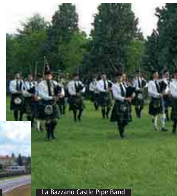
Il Villaggio senza barriere

piccola rete di sei scuole in diversi posti». Ricordiamo anche che, primo italiano, nel 2003 Massi si è affermato all'Archie Kenneth Memorial Quaich, la più importante manifestazione mondiale di musica classica per cornamusa: è un pezzo che si chiama pibroch, assai complesso. Si pensa che la cornamusa servisse solo nelle marce militari o per le danze, ma fu molto usata anche in ambito privato, con brani molto poetici e in cui mostrare tutto il proprio virtuosismo». «Per cornamusa scozzese» conclude «esistono più di diecimila brani. Però la cornamusa è uno strumento temperato, con un'accordatura particolare, diversa dagli altri strumenti. Per questo è destinata a suonare solo con altre cornamuse o da sola». (C.D.)