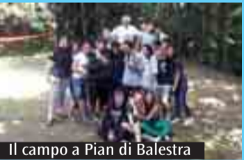
Il campo a Pian di Balestra