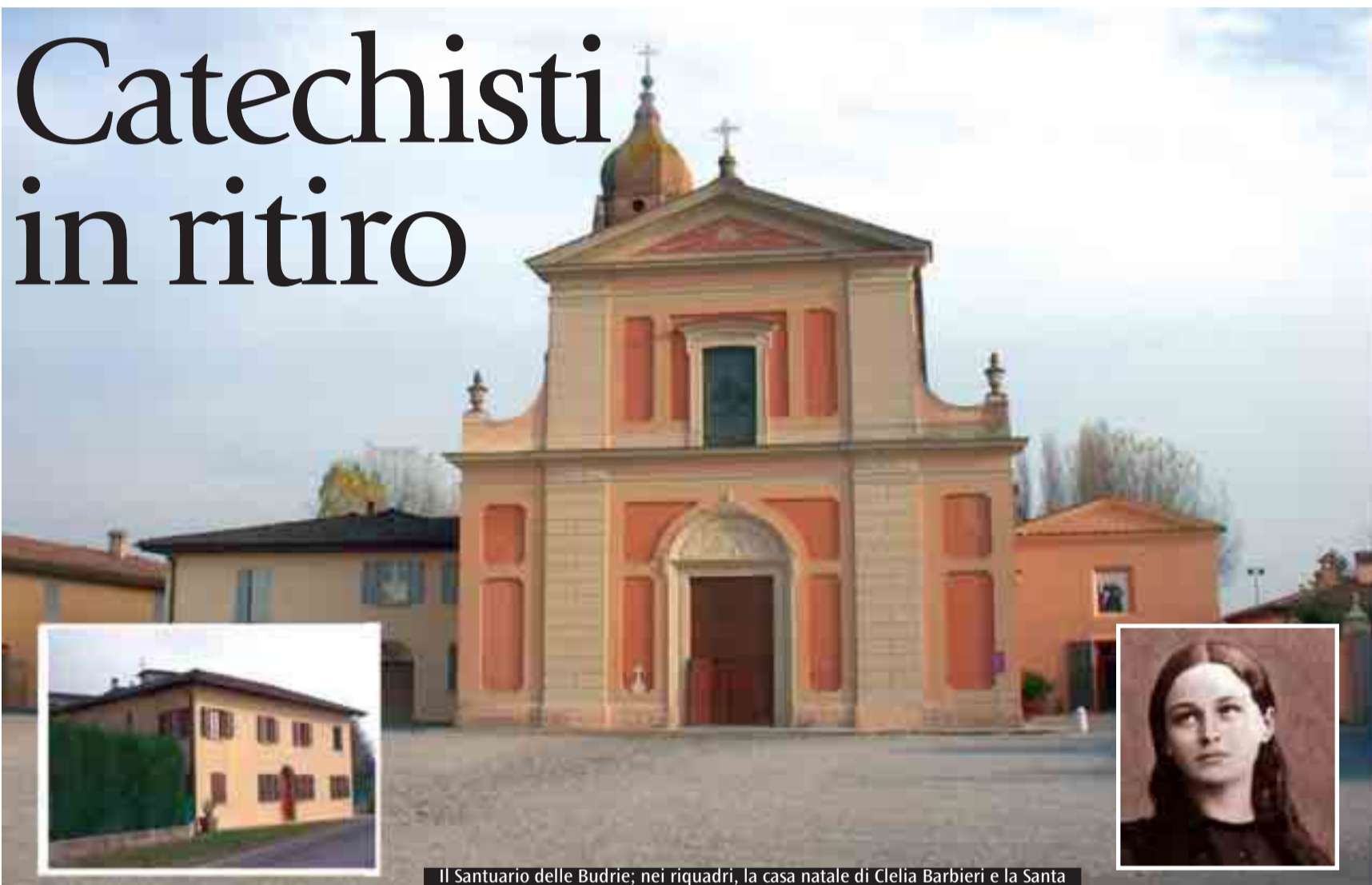
Il Santuario delle Budrie; nei riquadri, la casa natale di Clelia Barbieri e la Santa