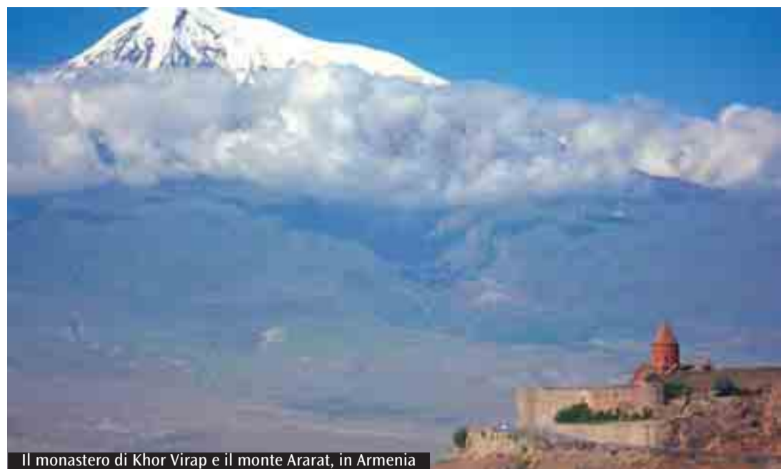
Il monastero di Khor Virap e il monte Ararat, in Armenia