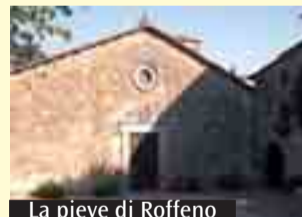
La pieve di Roffeno