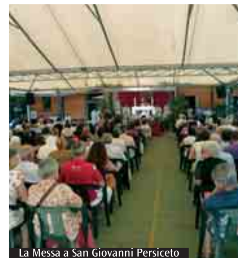
La Messa a San Giovanni Persiceto

una dottrina che accettiamo, o in rapporto ad un codice morale che osserviamo. Il nostro essere cristiano è l'essere in relazione con Cristo: una relazione costituita dalla fede. Queste parole hanno quest'anno una risonanza drammatica nella nostra coscienza. La festa del vostro patrono è velata quest'anno dalla tristezza. Come vivere questa tribolazione senza lasciarci prendere dallo scoraggiamento, o perfino dalla disperazione? Tutto il nostro essere, tutta la nostra vita - vi dicevo - è in relazione con Cristo. Nel Salmo dopo la prima lettura, abbiamo detto: «Ti sono note tutte le mie vie». Il Signore conosce i giorni pieni di tristezza che stiamo vivendo. «Sei tu che hai creato le mie viscere e mi hai tessuto nel grembo di mia madre: non siamo venuti al mondo per caso, e non siamo foglie secche in preda a forze oscure della natura. Chi crede non è mai solo. Giovanni non ha fatto altro: dire che in mezzo a noi c'è Dio salvatore. E là dove c'è Dio salvatore, c'è sempre la possibilità di un futuro. Mi piace terminare con un testo poetico di K. Wojtyła. «Nessun uomo trova spianati i sentieri./