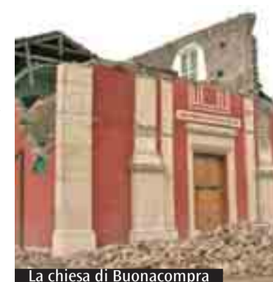
La chiesa di Buonacompria

sottraendo all'empiricità rinnovata ad ogni sisma la riflessione su tali strutture. Infatti, sono purtroppo numerosi i luoghi d'Italia che hanno dovuto confrontarsi con calamità simili, così come sono ormai numerosi i casi, anche all'estero, di edifici di culto temporanei, ma si è rilevato come sia raro il confronto con quanto già altrove sperimentato, con il rischio di ripetere ogni volta i medesimi errori e di non far tesoro dei risultati raggiunti. Sono trenta i professionisti, di diverse età ed esperienze professionali, che hanno aderito all'iniziativa, molti dei quali hanno seguito corsi e master di progettazione di chiese. Riteniamo, quindi, che ci siano tutti gli elementi perché gli esiti del Laboratorio siano soddisfacenti sotto i diversi profili di economicità, innovazione tecnologica, forma architettonica e aderenza all'uso comunitario e liturgico.