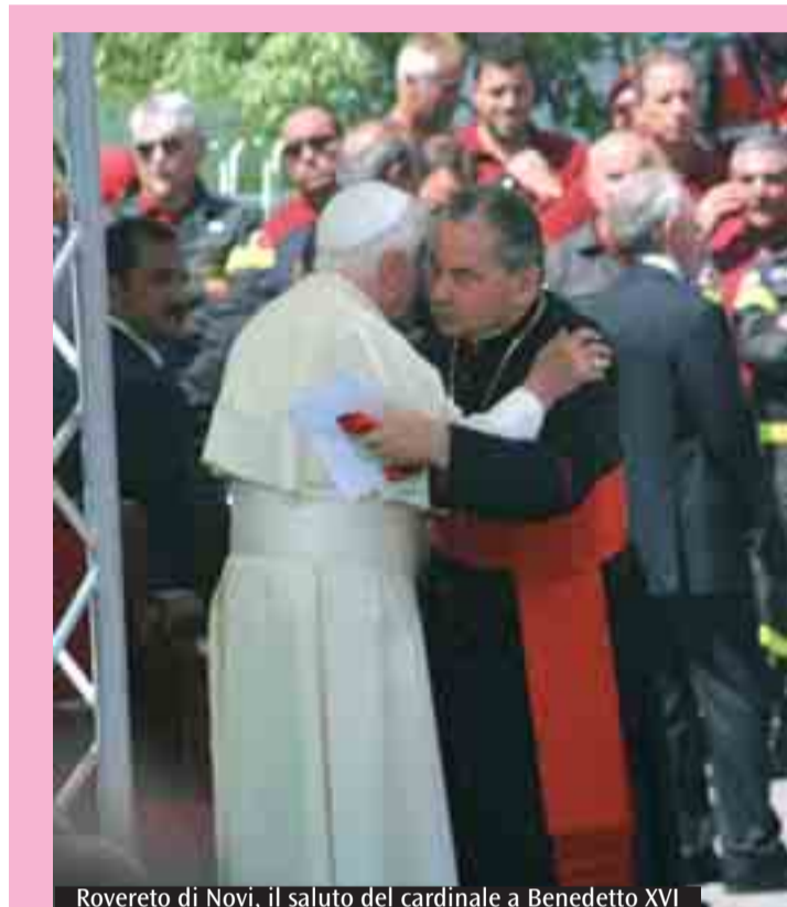
Rovereto di Novi, il saluto del cardinale a Benedetto XVI