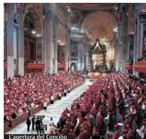
L'apertura del Concilio