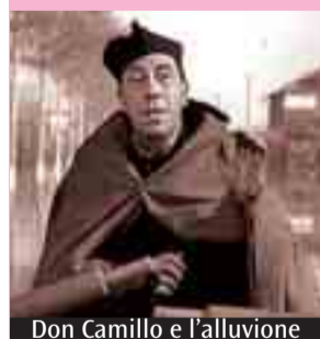
Don Camillo e l'alluvione

Cardinal Carlo Caffarra, presidente Conferenza episcopale regionale