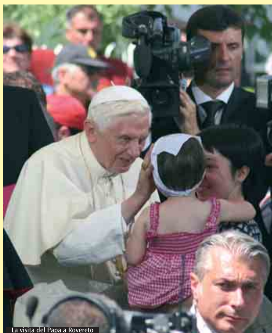
La visita del Papa a Rovereto