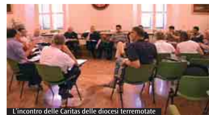
L'incontro delle Caritas delle diocesi terremotate