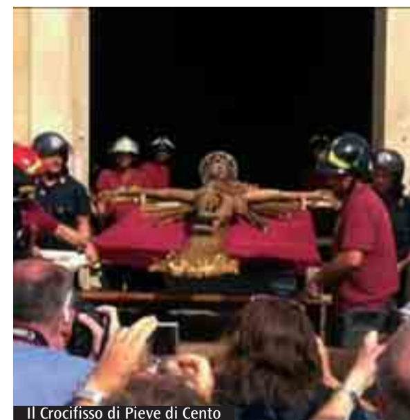
Il Crocifisso di Pieve di Cento

probabilmente nelle grandi rappresentazioni della Passione di Cristo che venivano allestite dalla Compagnia dei Battuti e che da più di quattro secoli ha sede stabilmente presso la chiesa collegiata. Diversamente da quando avviene in occasione delle ventennali, il Crocifisso è stato portato disteso su una barella, appositamente allestita. Il perché lo ha svelato don Paolo al termine della processione: il Crocifisso oggi lascia la Collegiata come per un esilio. Ritorna eretto, come vero Signore di Pieve e del mondo, quando la chiesa sarà restituita ai pievesi per essere ancora casa di preghiera e sorgente di benedizione per questa terra ferita.