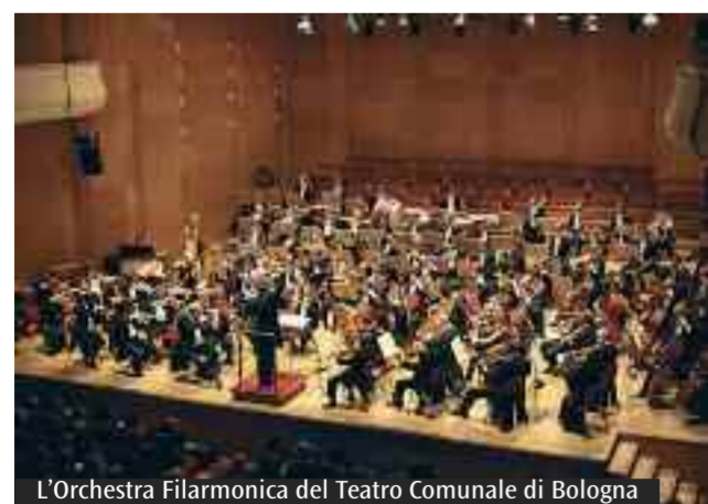
L'Orchestra Filarmonica del Teatro Comunale di Bologna

Diretta da Aziz Shokhakhimov, l'orchestra eseguirà la Quarta e la Sesta Sinfonia del compositore tedesco: la prima dal contenuto «sereno», la seconda ricca di sentimento