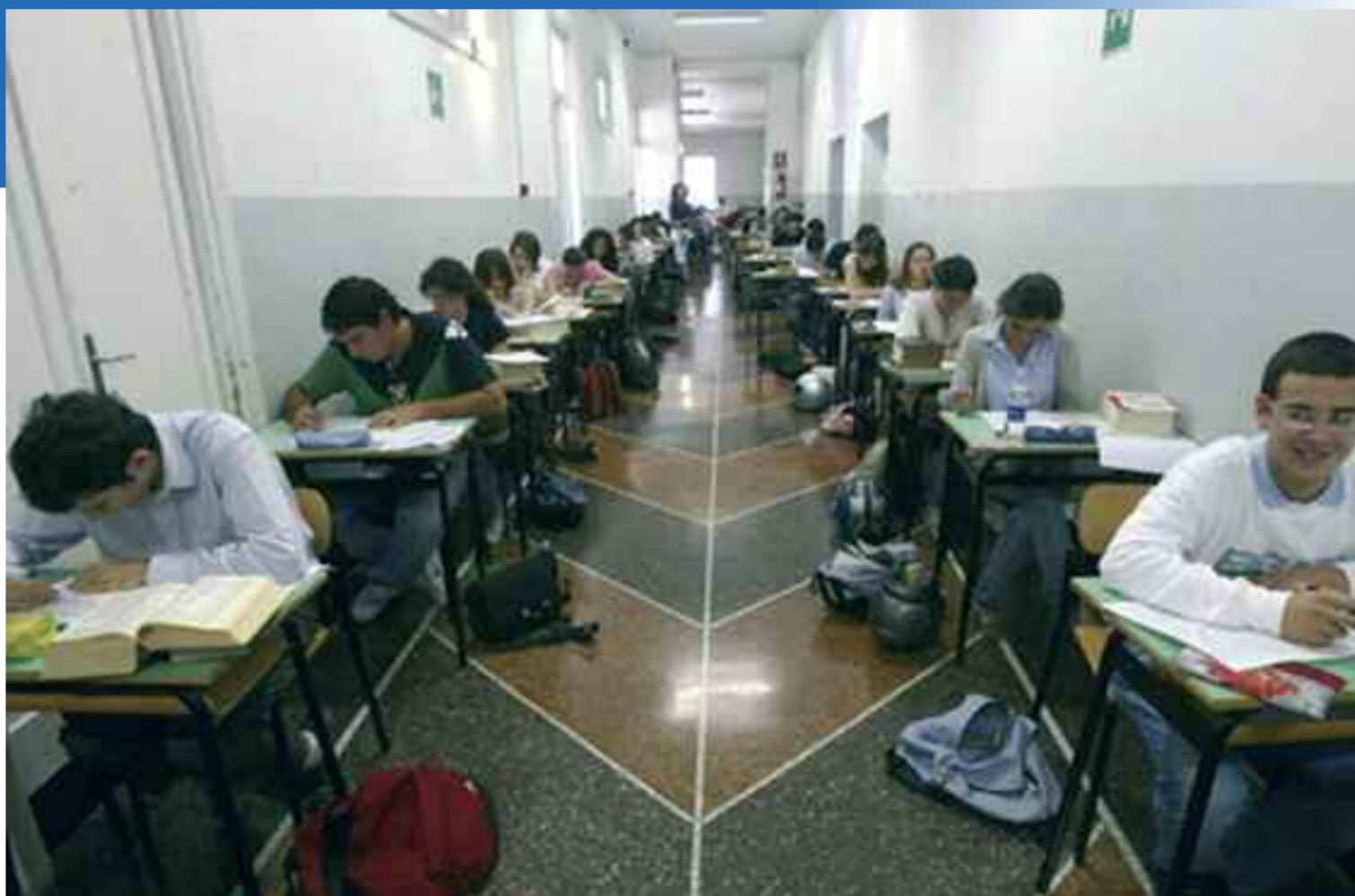
Sopra, studenti impegnati nella prova scritta della maturità. Sotto, il simbolo della Fondazione Ant onlus