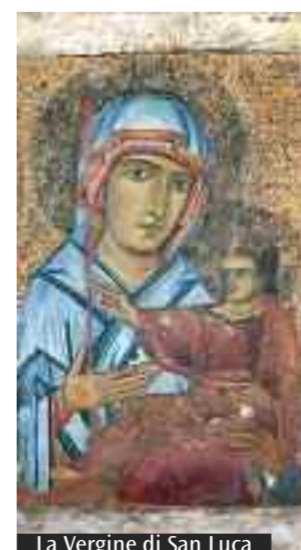
La Vergine di San Luca