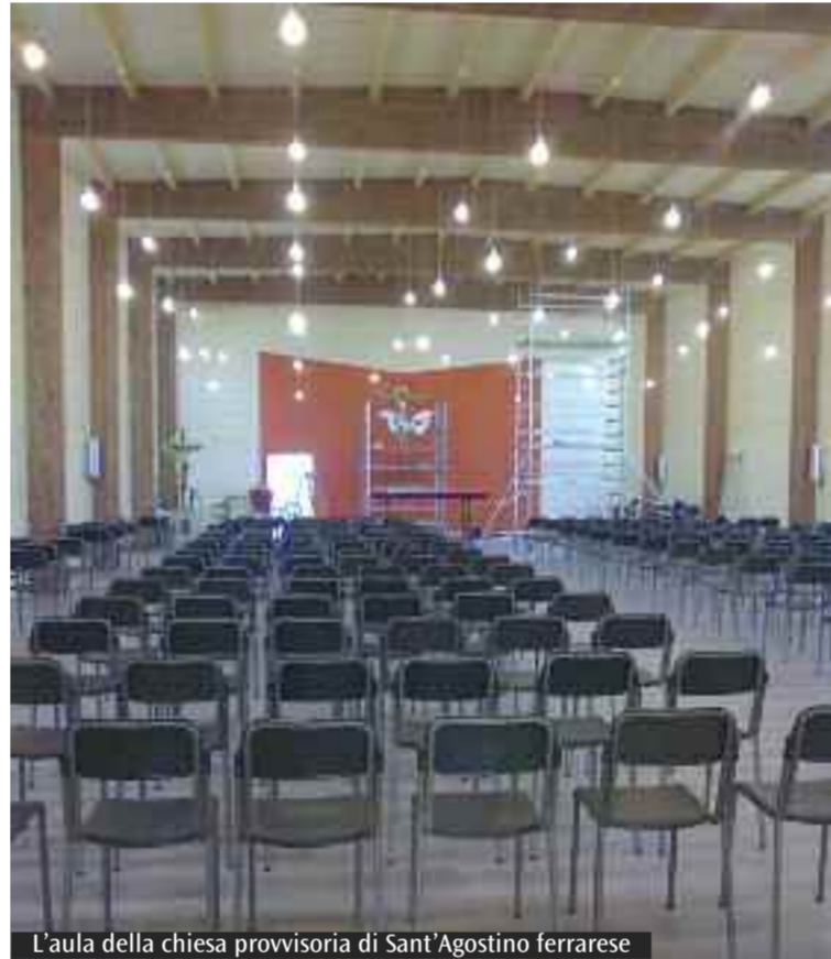
L'aula della chiesa provvisoria di Sant'Agostino ferrarese