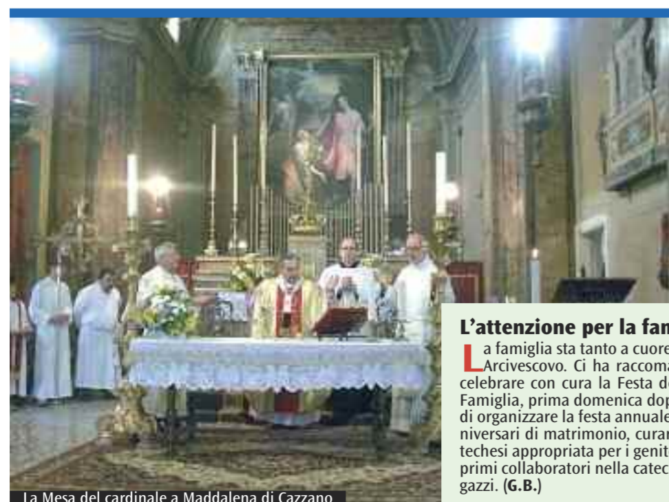
La Messa del cardinale a Maddalena di Cazzano