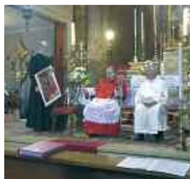
Nella foto l'arcivescovo dona un'immagine della Madonna di San Luca come ricordo della sua visita pastorale alla comunità

Cari fratelli e sorelle, la pagina evangelica descrive l'incontro di Gesù colla morte. Venuto a vivere nella nostra condizione umana, il Figlio di Dio doveva «fare i conti» con la morte. Gesù la incontra, come avete sentito, in una situazione drammatica: «Veniva portato al sepolcro un morto, figlio unico di madre vedova». La morte è incontrata dal Signore come l'evento che spezza anche i legami più forti; che interrompe anche i rapporti più significativi. L'evangelista Giovanni narra un altro incontro di Gesù con la morte, un incontro che coinvolge più profondamente la sensibilità del Signore: trattasi della morte di un amico, Lazzaro. Quale è la prima reazione di Gesù di fronte alla morte? È una profonda commozione, un'immensa compassione per la madre vedova. Nel caso di Lazzaro, la reazione di Gesù è ancora più complessa, quando si trovò davanti al sepolcro dell'amico già morto da tre giorni. Ebbe come un senso di indignazione verso la morte che lo aveva privato dell'amico, di turbamento interiore e scoppio perfino in pianto. Cari amici, possiamo dunque già trarre una conclusione. Il fatto della morte non è «sopportato» da Gesù con una impotente rassegnazione. Un libro della Scrittura, scritto non molto tempo prima di Gesù, dice: «Sì, Dio ha creato l'uomo per l'immortalità; lo fece ad immagine della propria natura. Ma la morte è entrata nel mondo per