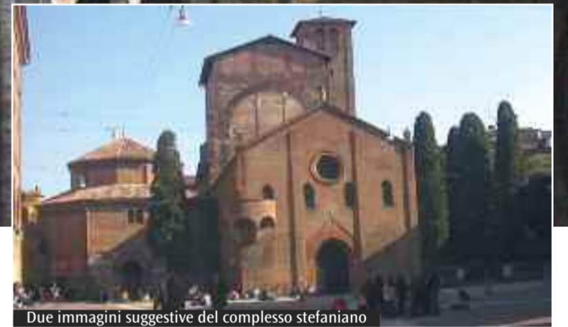
Due immagini suggestive del complesso stefaniano