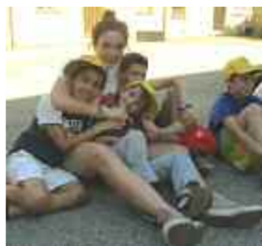
Di fianco e in basso, alcune «scene» di Estate ragazzi nella parrocchia cittadina di Sant'Egidio