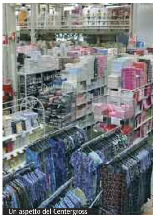
Un aspetto del Centergross

vamo fosse doverosa, di fronte alla crisi attuale, una riflessione anche sul consumo, sul nostro modo quindi di fare produzione e di vendere. Il Centergross tra l'altro è un esempio di come produrre in modo virtuoso: col nostro «Pronto moda» infatti abbiamo una produzione molto vicina, fatta in Italia, con un impatto ambientale «leggero». E poi, soprattutto, non facciamo sovrapproduzione: rifornendo infatti i negozi sempre con la merce necessaria non creiamo eccedenze». «Dal punto di vista generale poi - conclude - è veramente necessaria una riflessione sul nostro modo di fare economia per sostenere l'occupazione e il territorio e sviluppare anche il nostro lavoro affinché possa sostenerci come comunità». (C.U.)