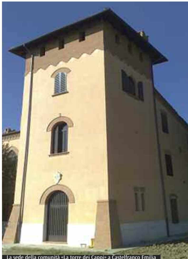
La sede della comunità «La torre dei Cappi» a Castelfranco Emilia