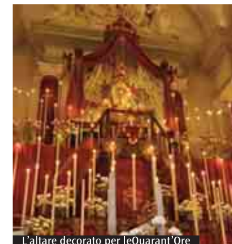
L'altare decorato per le Quarant'ore

non bastava che si adorasse con lo sguardo e con le ginocchia; così introdusse la pratica delle processioni, la partecipazione del paese suddiviso per vie, ciascuna convocata per un'ora, il canto e la consuetudine di edificare l'altare solenne in cui accogliere Gesù Sacramentato. La cosa funzionò, infatti da allora fino ad oggi, senza interruzioni, neppure in occasione della Guerre mondiali, celebriamo in maniera sostanzialmente identica le Quarant'ore, che, anzi, si potenziarono nel tempo e per gli abitanti di questo borgo divennero uno degli elementi di maggior identificazione». «A torto invece - aggiunge - è stato tramandato che le Quarant'ore fossero nate per l'intenzione di don Giuseppe di riparare la profanazione avvenuta, il 28 marzo 1743, col furto delle Santissime Specie eucaristiche dal tabernacolo. Ed è proprio di questo fatto, divenuto impropriamente il mito di