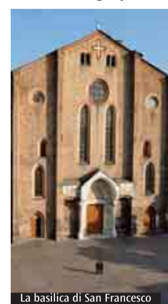
La basilica di San Francesco