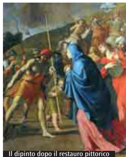
Il dipinto dopo il restauro pittorico

«La salita al Calvario di Cristo», realizzata per la sala del Capitolo di quello che oggi è il cimitero sarà presentata venerdì nella Cappella dei Notai, sua nuova collocazione