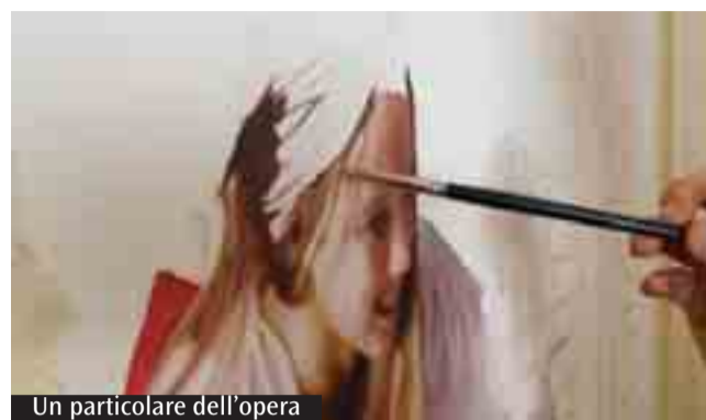
Un particolare dell'opera

Giovedì 10 aprile, le tre comunità della bassa inaugureranno e presenteranno un'opera ad olio su tela. La realizzazione della tela è il termine di un percorso tra l'artista Elvis Spadoni e i ragazzi delle parrocchie su una pagina evangelica