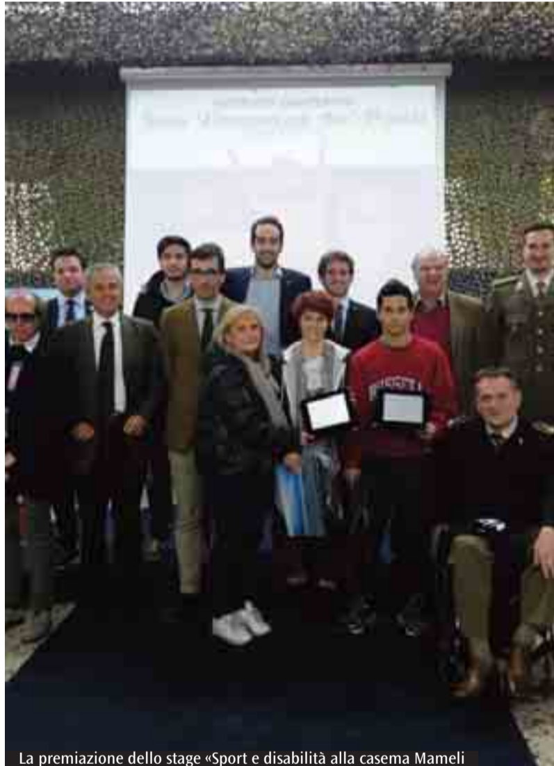
La premiazione dello stage «Sport e disabilità alla caserma Mameli»

formativa, che ha permesso ai nostri ragazzi di accostarsi al tema della disabilità, immedesimandosi in prima persona nei panni di chi pratica sport in condizioni di diversità. Un percorso che se sulle prime ha generato qualche esitazione in alcuni studenti, con il passare dei giorni è diventato per tutti loro un'occasione impareggiabile di crescita».