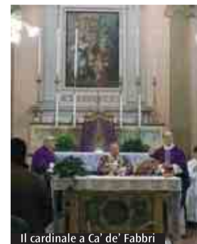
Il cardinale a Ca' de' Fabbri

C'è un modo di guardare la realtà, gli altri e le cose, che è proprio dell'uomo. E c'è un modo di guardare che è proprio di Dio. E non raramente i due sguardi sono contrastanti. Allora siamo come ciechi; vediamo solo le apparenze