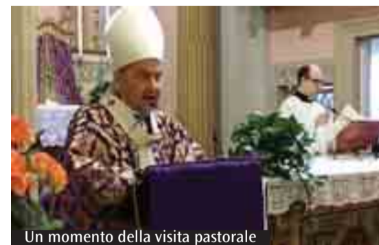
Un momento della visita pastorale

Caffarra ha incontrato i giovani e si è soffermato con loro sull'amore umano e la testimonianza cristiana