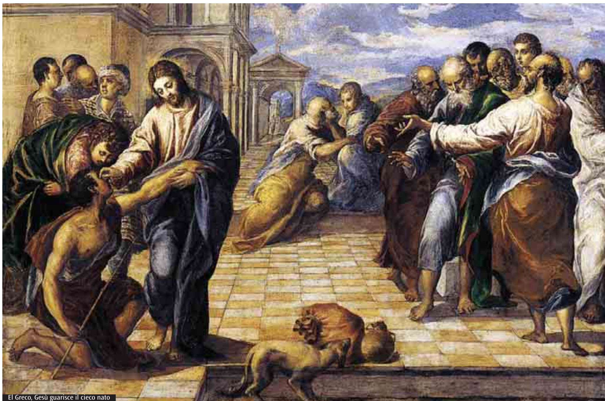
El Greco, Gesù guarisce il cieco nato