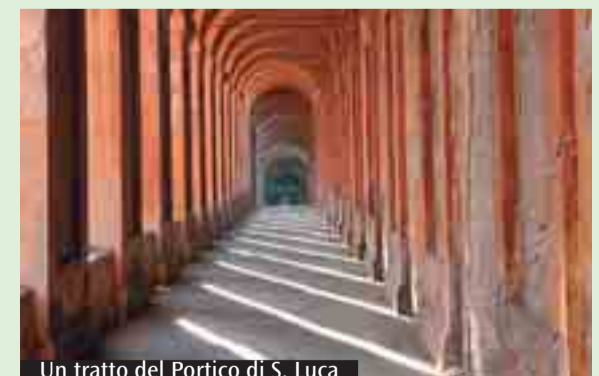
Un tratto del Portico di S. Luca

A vele spiegate il progetto di crowdfunding territoriale «Un passo per S. Luca»