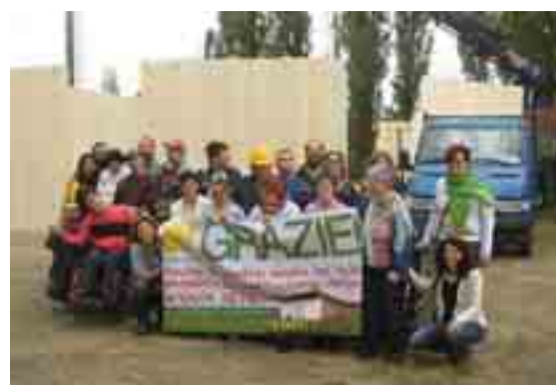
Il gruppo della cooperativa sociale «Campi d'Arte» e alcune attività svolte dai ragazzi con disabilità che lavorano e operano nella nuova e moderna struttura