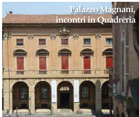
Palazzo Magnani, incontri in Quadreria

M ercoledì 29, ore 20.30, nell'Oratorio di San Filippo Neri, con il concerto della pianista russa Elena Nefedova, vincitrice del «Premio del pubblico» si conclude la 36ª edizione di Bologna Festival. Il Premio del pubblico nasce per promuovere la carriera di giovani interpreti: per il vincitore è previsto un nuovo impegno all'interno della programmazione del festival. Nefedova torna così ad esibirsi con un programma congeniale al suo pianismo ricercato e di intensa espressività; ci porta alla scoperta di pagine pianistiche di rara esecuzione come i «Momenti musicali op.16» di Rachmaninov; la «Sonata in mi minore op. 7» di Grieg o la trascrizione pianistica liziana della «Sarabanda» e della «Ciaccona» tratte dall'«Almira» di Haendel.