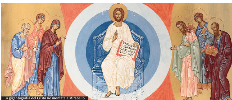
La gigantografia del Cristo Re montata a Mirabello