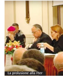
La prolusione alla Fter

«Sul Web – ha spiegato la presidente della Rai – c'è una veloce stratificazione di una gran quantità di dati che sta trasformando profondamente ognuno di noi. L'effetto si fa sentire anche sulle relazioni interpersonali»