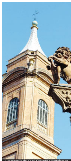
Il campanile dei Santi Gaetano e Bartolomeo