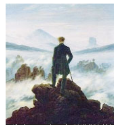
«Viandante sopra le nuvole» (1818) di Friedrich