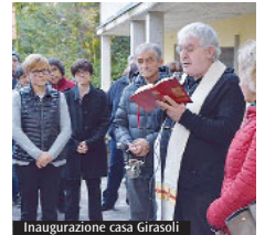
Inaugurazione casa Girasoli

Dal pomeriggio di mercoledì 28 a quello di mercoledì 29 l'arcivescovo Matteo Zuppi si recherà a Istanbul per incontrare il Patriarca Bartolomeo di Costantinopoli, ricambiando così la visita che questi ha fatto alla nostra diocesi nel scorso settembre. Monsignor Zuppi porterà in dono al Patriarca un importante frammento della reliquia del cranio di sant'Anna, madre di Maria Vergine, oggi conservato nella nostra Cattedrale. La destinazione della reliquia sarà la Skete di Sant'Anna, uno dei monasteri del Monte Athos, penisola greca, e nei quali si tramanda la ricchezza della spiritualità orientale.