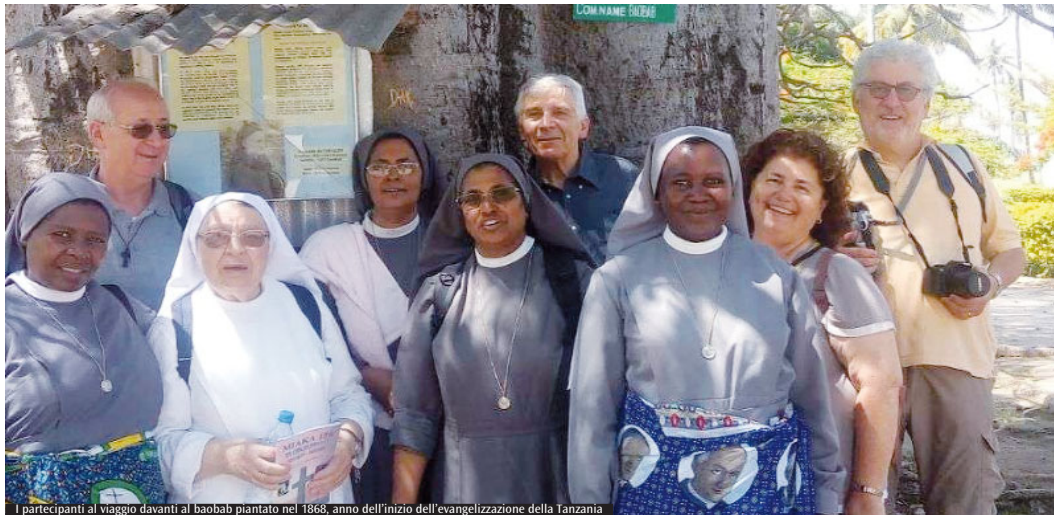
I partecipanti al viaggio davanti al baobab piantato nel 1868, anno dell'inizio dell'evangelizzazione della Tanzania