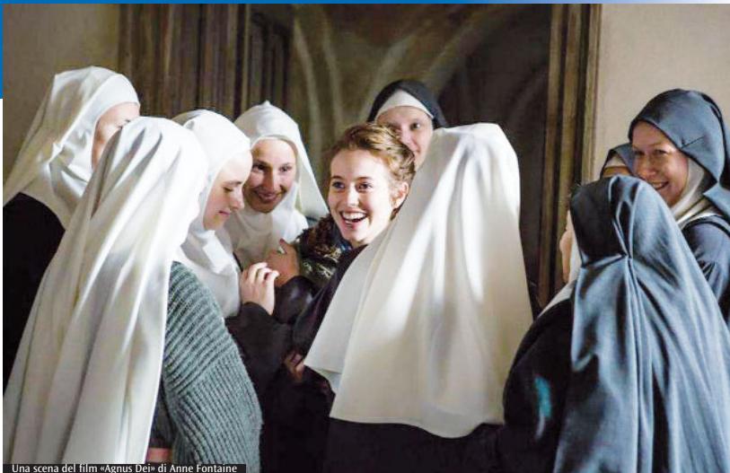
Una scena del film «Agnus Dei» di Anne Fontaine