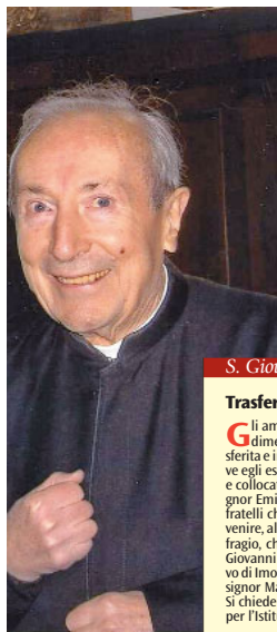
S. Giovanni in Monte