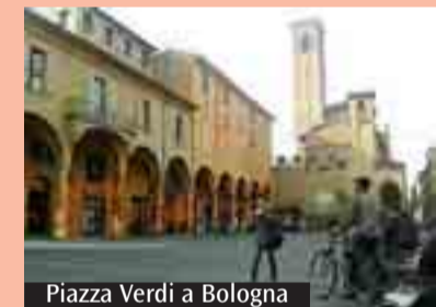
Piazza Verdi a Bologna

Se la Veglia delle Palme nasce come momento in cui ristorarsi e fermarsi, l'assemblea giovani chiede che i «nostri» giovani si coinvolgano per altri giovani. La scelta del luogo, piazza Verdi, e dello stile laboratoriale, desidera renderlo un momento d'incontro con chi non incrociamo mai: giovani che si mettono in dialogo e in ascolto di altri giovani. È possibile essere fruitori dei singoli momenti, ma si può anche scegliere di coinvolgersi personalmente. Per questo, stiamo cercando giovani che si coinvolgano nel laboratorio di strada, meglio di piazza, chiamato «Rompi il cerchio», che si terrà giovedì 19 dalle 16 alle 19, e vi proponiamo di partecipare a una serata di spiegazione dell'attività e del metodo, che si terrà giovedì 5 alle 21, presso i missionari Identes, in via Tagliapietra 15. «Rompi il cerchio» è un laboratorio di strada, ideato da Idente Youth per il progetto Parlamento universale della gioventù (Pug), forum permanente internazionale di dialogo. Siamo così abituati a vivere da estranei che facilmente perdiamo la consapevolezza del vincolo che ci unisce. Persa la coscienza del vincolo il salto a relazioni di rancore, odio, vendetta, è quasi scontato e ognuno si chiude nel suo cerchio. L'attività mira a rompere il cerchio dell'estraneità e a coinvolgersi in un dialogo con le persone che passano a cui si dona un momento di ascolto reciproco intorno a tre trappole che segnano spesso le nostre relazioni: apparenza, paragone, utilità.