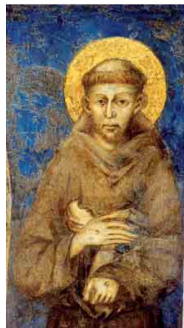
Cimabue, San Francesco d'Assisi, tempera su tavola (107x57 cm), 1290 ca., Assisi, Museo della Porziuncola presso la basilica di Santa Maria degli Angeli