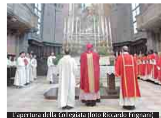
L'apertura della Collegiata