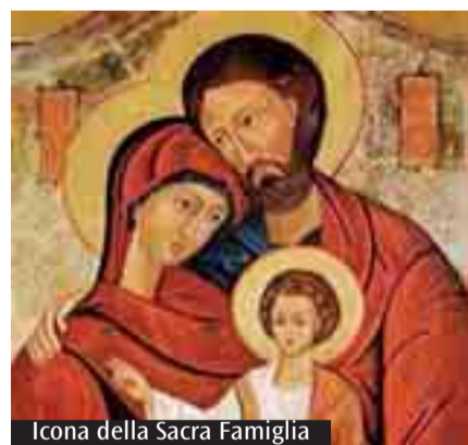
Icona della Sacra Famiglia