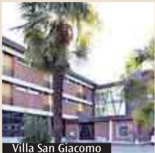
Villa San Giacomo

La Domenica in Albis, 8 aprile, i «Ragazzi del Cardinale» (di Leri con le loro famiglie, e di oggi, quest'anno numerosi, per volere dell'Arcivescovo) si ritroveranno come ogni anno a Villa San Giacomo per celebrare il Risorto e riattingere grazia alla fonte dell'Eucaristia, intorno all'altare, da cui la Famiglia Lercaro è nata e continua a crescere. La «Festa di Famiglia» avrà come momenti salienti: l'Eucaristia presieduta da monsignor Ernesto Vecchi, vescovo ausiliare emerito e presidente della Fondazione Lercaro e dell'Opera Madonna della Fiducia; e nel primo pomeriggio l'incontro di tutti i partecipanti con l'arcivescovo Matteo Zuppi. Per l'occasione il Sodalizio dei Santi Giacomo e Petronio ha realizzato una chiavetta usb con 46 interventi radiofonici del cardinale Lercaro nella trasmissione Rai «Ascolta si fa sera» nel 1973-74, su: «Messa, parte II: liturgia sacrificale»; «Parabole evangeliche»; «Fiorita di preghiere a Gesù»; «Feste». Quasi un lascito spirituale. Verrà consegnato anche il «kit del pellegrino» ai partecipanti al pellegrinaggio a Roma da papa Francesco il 21 aprile. Al termine dell'Assemblea sarà proiettato il film sul cardinale Lercaro «Per la forza dello Spirito» di Lorenzo Stanzani.