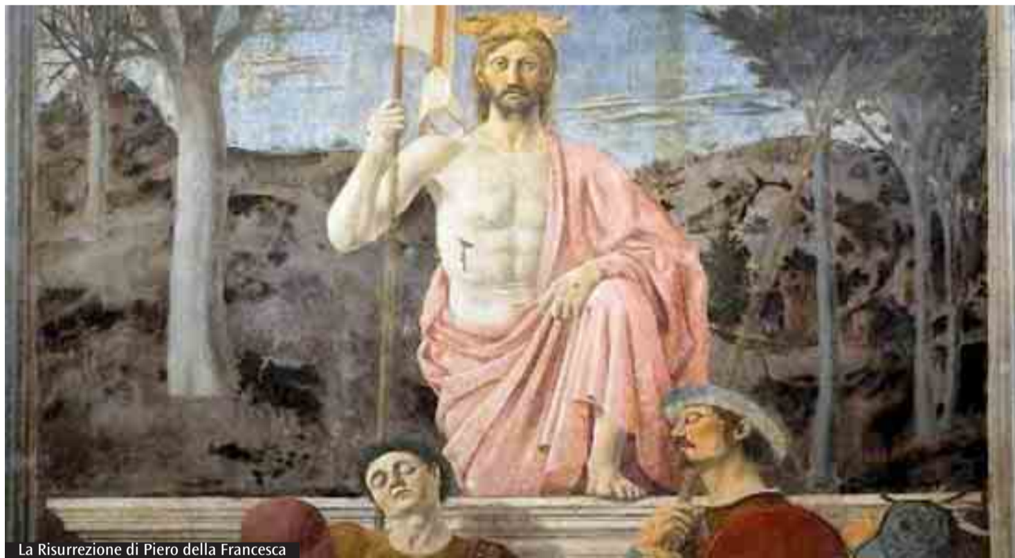
La Risurrezione di Piero della Francesca

fiducia e di essere uomini cui il prossimo possa dare fiducia perché aiutano per davvero! I discepoli non avevano ascoltato le parole che con insistenza Gesù aveva detto loro circa la sua croce. Senza ascoltare la Parola si resta turbati. La Parola la capiamo dalla Pasqua perché è seme di vita eterna, che vuole dare frutti, non una delle tante sterili consolazioni per cercare un benessere individuale. E' il grido gioioso, incredibile, entusiasta che la morte è sconfitta, che la prigione del mondo si apre, che la condanna a morte che ogni uomo ha su di sé, è stata tolta e siamo liberi! Non abbiate paura di osare, di credere, di restare delusi. Non abbiate paura di guardare oltre il limite stesso della vita. La nostra vita è piena di paure. Come non averla quando si è deboli, quando si è confrontati con l'enigma del male, ad esempio le minacce del terrorismo, della guerra mondiale a pezzi che si sta combattendo in tante parti del mondo? Come non avere paura nel vedere la cattiveria dell'uomo? La paura è madre di tanti sentimenti cattivi. Ma come liberarsene? Chi ascolta il Vangelo non avrà paura! Chi cerca Gesù non ha paura! Perché quell'uomo mite ed umile,