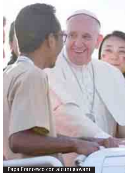
Papa Francesco con alcuni giovani

chetto» (solo Roma), 11 e 12 agosto, comprende: viaggio in pullman e spese autisti; alloggio nelle modalità offerte dall'organizzazione nazionale; cena del sabato, colazione e pranzo della domenica a Roma; pass di entrata agli eventi; kit degli italiani; gadget del pellegrino bolognese (scaldacollo); spese di segreteria; assicurazione. Non sono compresi il pranzo dell'11 agosto, l'eventuale cena del 12, costi per esigenze diverse dalla proposta, spese personali. Al momento dell'iscrizione si dovrà consegnare: il modulo di iscrizione compilato e firmato (quota, euro 110). L'iscrizione si riterrà valida alla consegna del modulo di iscrizione e pagamento della quota. Se il saldo non verrà pagato entro la data di scadenza stabilita, il posto verrà ceduto agli iscritti in lista di attesa. Eventuali rimborsi a fine evento, con valutazione dei costi sostenuti dall'organizzazione.