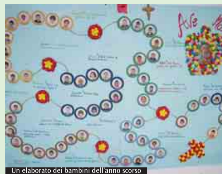
Un elaborato dei bambini dell'anno scorso