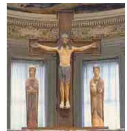
A sinistra il rito della lavanda dei piedi in San Pietro. Sopra il crocifisso della Cattedrale