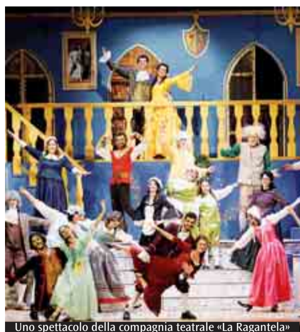
Uno spettacolo della compagnia teatrale «La Ragantela»