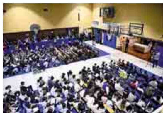
Sopra, la Messa prepasquale di monsignor Zuppi con il mondo Fortitudo; a fianco, la lavanda dei piedi ai giovani calciatori di «We love football»