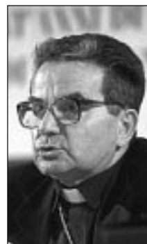
Monsignor Carlo Caffarra

La proposta scelta per quest'anno riguarda la risurrezione di Gesù considerata come origine della morale cristiana. Abbiamo ritenuto opportuno illustrare il nesso tra la risurrezione di Gesù e la vita morale del credente, ricordando la frase paolina: «come Cristo fu risuscitato dai morti, così anche noi possiamo camminare in una vita nuova» (Rm 6,4). Il ripetersi questa convinzione profonda, assolutamente costitutiva della visione cristiana, ci ha poi condotti alla domanda: e i non cristiani, che certo non fanno riferimento alla risurrezione di Gesù, come impostano i fondamenti della loro morale? Poiché molti presbiteri e credenti, anche nella nostra regione, incontrano ormai quotidianamente credenti musulmani anche piuttosto atezati, è evidente l'importanza per tutti noi di avere una visione chiara sulla connessione tra la propria fede e la propria identità morale. Non c'è solo in problema di scelte parziali differenti (per esempio i cibi, il matrimonio, la responsabilità di un figlio,