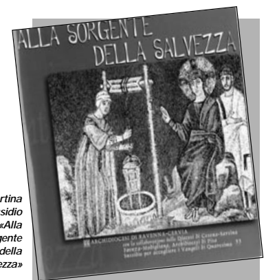
La copertina del sussidio «Alla sorgente della salvezza»