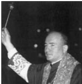
Monsignor Magnani benedice l'assemblea durante la cerimonia del possesso canonico della Chiesa Cattedrale Metropolitana (12 settembre 1999)

stare la propria comunione con la Chiesa che detiene la sede nella cattedra del Vescovo, nel suo ministero apostolico. Per alcuni cattolici bolognesi è stata anche occasione per dissipare qualche confusione su quale chiesa sia cattedrale.