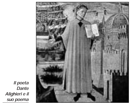
Il poeta Dante Alighieri e il suo poema

sentente la critica del poeta verso un certo esercizio del potere temporale da parte della Chiesa, lei è d'accordo sull'interpretazione del laicismo di Dante? No, Dante ha una grande fede nelle istituzioni, che siano la Chiesa o l'impero. Però ritiene che debbano operare ciascuno in un ambito distinto, senza interferenze. Invece la canonistica del tempo esalta la «plenitudo potestatis» del papa. Dante non è d'accordo. Il rapporto fra papato e impero è uno dei problemi nodali del Medio Evo. Ognuno dei due rivendica l'esercizio del potere anche nel campo dell'altro. Sarà solo con Innocenzo III che la canonistica dirà che l'autorità spirituale «casualiter» può intervenire nel potere temporale. Questo «casualiter» lascia spazio a qualsiasi possibilità d'ingerenza, di lì in poi.