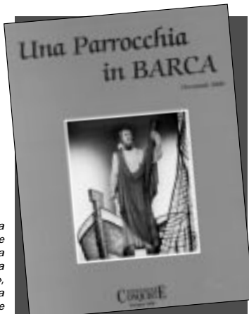
La copertina del volume «Una parrocchia in Barca», edito da Conquiste

«Una parrocchia in Barca»: con questo titolo, scherzoso ma non troppo, abbiamo battezzato il volume stampato per iniziativa della parrocchia di S. Andrea della Barca in occasione della sua seconda Decennale Eucaristica, che è stata festeggiata nel 2000, ed edito da Conquiste. Non è stato facile impostare un'opera dedicata ad una parrocchia di vita, almeno come tale, ancora così breve, e, insieme, di un territorio fino a tempi recenti non particolarmente ricco di storia. Difficile anche trovare un «taglio» adatto a coniugare i due aspetti, storico/civile e religioso. Il tutto, in termi-