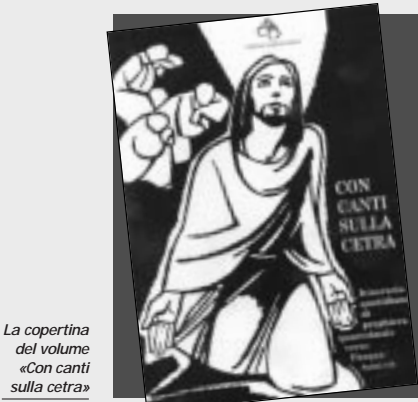
La copertina del volume «Con canti sulla cetra»

nenza che si distacca dalla mentalità comune, dal «così fan tutti». Il cammino quaresimale può essere l'occasione per una testimonianza forte di appartenenza alla Chiesa che diventa annuncio. Per questo motivo il cammino di preghiera personale proposto dal Centro di pastorale giovanile ha nella sua introduzione una spiegazione sulla Quaresima e alcune indicazioni pratiche che manifestano un impegno che va oltre al semplice «fioretto»: è una decisione alla conversione. «Con canti sulla cetra», è il titolo del libretto tascabile che invita alla meditazione sui primi 9 salmi del salterio, il libro di canto del popolo di Dio; il canto è l'espressione poetica più forte, spesso usata dai giovani per esprimere le loro aspetta-