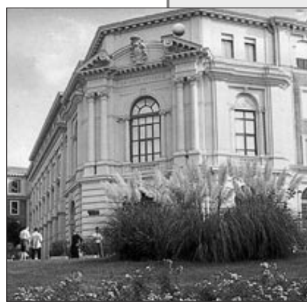
Il Seminario Arcivescovile

(dalla 5ª elementare ai primi anni delle scuole superiori), e dal gruppo «Vieni e seguimi» (dai 17 anni poi): il loro scopo è aiutare i ragazzi a «mettersi in ascolto». In estate organizziamo anche diversi Campi vocazionali. C'è poi la disponibilità di alcuni sacerdoti per un accompagnamento spirituale personale. Recentemente ha preso il via anche la proposta delle Settimane vocazionali... È un'iniziativa che abbiamo agganciato alle Decennali di città e ai Congressi eucaristici vicariali. L'idea è quella di animare alcuni momenti ordinari e straordinari nelle parrocchie attraverso una presenza del Centro diocesano vocazioni, del Seminario e di alcuni consacrati, per presentare il cammino nella radicalità evangelica. Per il momento sono state coinvolte 5 parrocchie, ma sono già in calendario altri appuntamenti.