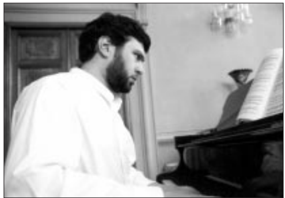
Il direttore Vladimir Jurowski

L'intento drammaturgico di Rimskij, già implicito nell'architettura di quest'opera, è di avere quasi delle scissioni schizofreniche. Il secondo atto, che vede protagonisti i cosiddetti caratteri comici, attinge ad una drammatur-