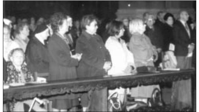
Due momenti della Messa per il pellegrinaggio degli anziani alla Basilica di S. Petronio

Più di mille persone hanno partecipato, domenica scorsa, alla solenne concelebrazione eucaristica presieduta dal Cardinale in S. Petronio, in occasione del pellegrinaggio organizzato dalla Segreteria diocesana per la pastorale degli anziani. Sono stati proprio gli anziani i primi a rispondere all'appello dell'Arcivescovo nella sua ultima Nota pastorale recarsi pellegrini nella Basilica del Santo patrono. Vi erano, naturalmente, soprattutto laici, insieme a parroci, religiosi e religiose: tutti si sono stretti intorno al loro Vescovo - come ha ricordato in apertura don Oreste Leonardi, assistente della Segreteria per la Pastorale anziani - consapevoli di quella eredità petroniana che ha caratterizzato, al di là di tutto, il corso della loro esistenza.