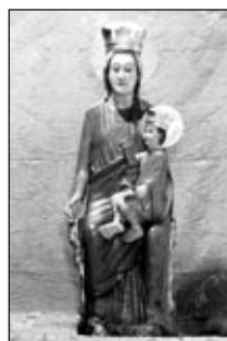
L'immagine della Beata Vergine del Soccorso