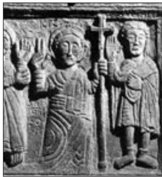
I martiri Vitale e Agricola

sto modo a Bologna il trapasso tra epoca romana e cristiana?