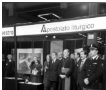
Il vescovo ausiliare monsignor Ernesto Vecchi alla cerimonia inaugurale della IX edizione di «Koinè»

Purtroppo la cultura dominante del nostro tempo è prigioniera del nichilismo, che tende a sopprimere l'i-