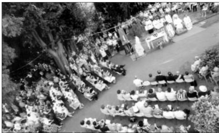
Un momento della celebrazione eucaristica presieduta dal Cardinale a Villa Revedin per la solennità dell'Assunzione (Photo Flash)

la santità, cioè nella partecipazione alla vita divina mediante la fede, la speranza e l'amore. Chiamandola a diventare la madre del Re, Dio non dotò la Vergine Maria di possedimenti e di beni economici: la lasciò nella sua povertà; non la collocò tra coloro che sono socialmente