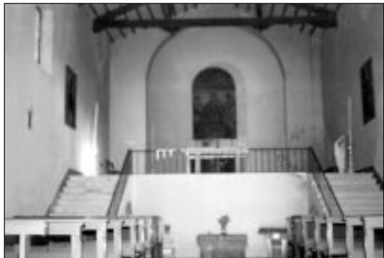
L'interno del Santuario di S. Lucia di Rocca di Roffeno

La parrocchia, che conta poco più di 300 anime, non riesce a farsi carico dei numerosi e necessari interventi di restauro per mantenere il decoro della chiesa e di manutenzione ordinaria dell'intero complesso. Invita quindi tutte le persone interessate a partecipare alla processione e a farsi carico, tramite un'offerta, dei costi per gli interventi necessari di una delle opere storiche più belle della zona.