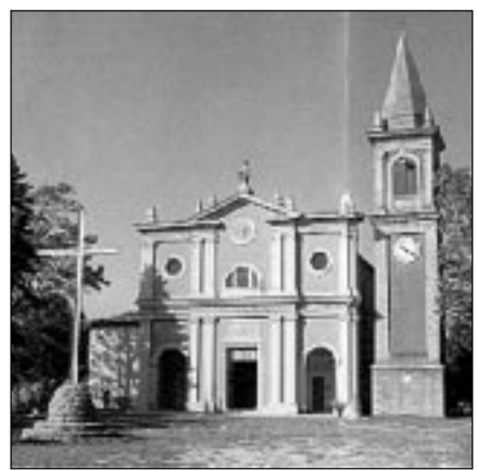
Il Santuario della Madonna di Serra di Ripoli

Tornando alla festa del Voto, essa sarà preparata da un Triduo di preghiera: giovedì alle 20,30 verrà celebrata la Messa,