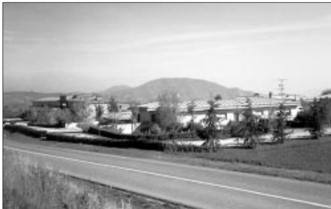
Un'immagine del Villaggio «Pastor Angelicus». A destra un momento della visita del Cardinale

semblea alcune parole di saluto: «Questo incontro è anche per me atteso e desiderato, ed è con grande gioia che io, per la diciottesima volta, ho la gioia di incontrarvi per questa bella celebrazione eucaristica. Saluto particolarmente don Mario, che il Signore lo benedica per la sua grande fede: la seconda lettura ci ha fatto l'elogio della fede, ma questo Villaggio è un po' la prova evidente di cosa può fare la fede anche nelle condizioni più difficili. Ma con particolare affetto saluto il cardinale Giovanni Saldarini, appassionato annunciatore del Vangelo, grande uomo di Chiesa e mio amico fraterno fin dalla nostra prima giovinezza, che ormai è un po' lontana. Noi siamo tutti molto contenti di averlo qui, credo che il Villaggio Pastor Angelicus si senta onorato ed è onorata anche la nostra