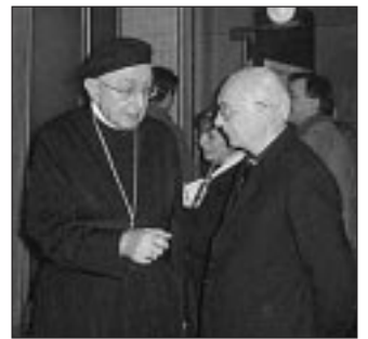
Un momento della conferenza a Castel S. Pietro: nella foto il Cardinale e monsignor Silvano Cattani