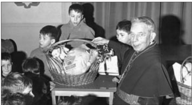
Il cardinale Giacomo Lercaro in mezzo ad un gruppo di bambini

Il teologo Yves Congar, cardinale «in limine vitae», affermò un giorno: «Ci vorranno cinquant'anni perché lo spirito e i deliberati del Concilio Vaticano II producano tutti i loro frutti». L'affermazione venne poi attribuita polemicamente ora all'uno ora all'altro protagonista dell'«e-