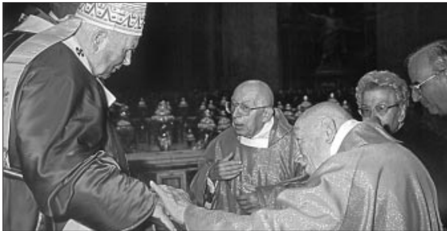
Il Papa incontra i quattro figli (due sono sacerdoti) dei coniugi Beltrame Quattrocchi, beatificati il 21 ottobre scorso