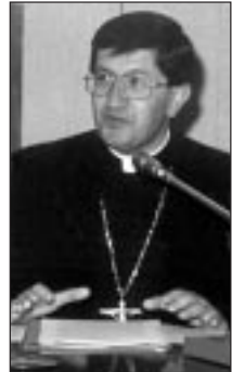
Sopra, monsignor Giuseppe Betori; accanto, il pubblico che ha assistito alla sua prolusione

piere l'annuncio. Essi infatti, ha spiegato monsignor Betori, hanno una struttura comune. Partono da una situazione concreta, un fatto che ha destato stupore e suscitato interrogativi negli ascoltatori. Esso viene spiegato a partire dalla vicenda di Gesù, già annunciata nell'Antico Testamento. Un'vita, si ricorda, culminata nel-