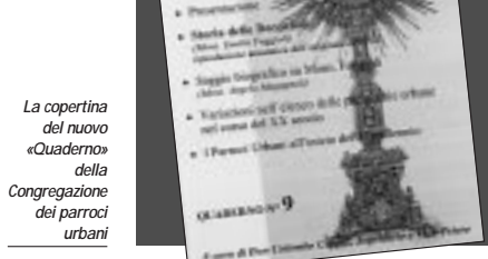
La copertina del nuovo «Quaderno» della Congregazione dei parroci urbani

in occasione delle diverse decennali. «Le Decennali eucaristiche, che affondano le loro radici nel cuore dei primi due secoli del secondo millennio, radici sature di una fede profonda, nella presenza di Cristo nel mistero della Eucaristia - spiegano monsignor Santi e don Capelli - sono nate dalla mente e dal cuore di Pastori santi e illuminati e hanno trovato immediatamente riscontro nell'animo dei parroci di queste nostre parrocchie cittadine». «Fin dalle origini - continuano - è stato evidente l'intento di una manifestazione esterna di festa e giubilo che si sarebbe tentati di interpretare come eccessivamente esteriore. Ma una conoscenza più approfondita non fatica a mettere in evidenza una profonda vena di carità, e l'intento