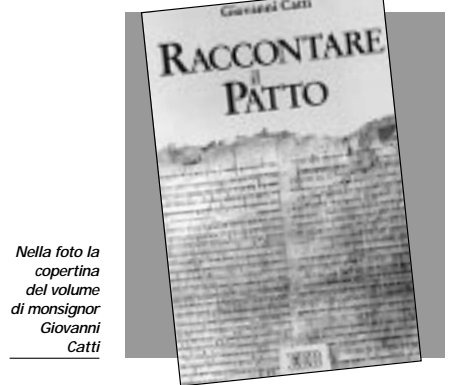
Nella foto la copertina del volume di monsignor Giovanni Catti

Il Patto è nella Bibbia il centro del rapporto di Dio con la creatura plasmata a sua immagine: il popolo di Dio è il «popolo del Patto». Il lavoro si presenta così come un itinerario sul solco di questa promessa di fedeltà, cuore della fede ebraica e cristiana, a partire dalla parola data ai Padri fino a quella definitiva del Nuovo Testamento, nella persona di Gesù, Dio fatto uomo. Il percorso, che si avvale anche in certa parte di nozioni filologiche, tocca strada facendo anche il tema della pace e la figura di S. Francesco, per concludere parlando del metodo scout. «Scouts», spiega l'autore, è parola inglese che deriva dall'italiano arcaico