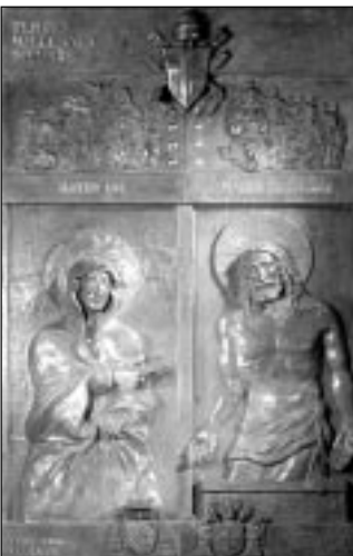
La nuova Porta Santa della Basilica Patriarcale di S. Maria Maggiore, a Roma opera dell'artista bolognese Luigi E. Mattei