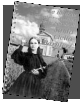
La copertina del volumetto- calendario su S. Clelia e il suo Santuario

In coda sono infine riportati gli orari del Santuario. Per informazioni telefonare in parrocchia allo 051950124, o consultare il sito www.santuarioclelia.it