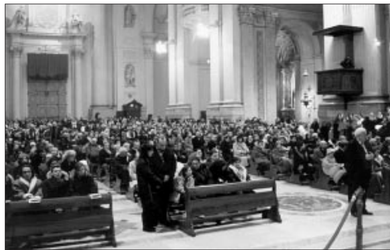
Un momento della Messa della notte di Natale presieduta dal Cardinale in Cattedrale

Questa messa natalizia, celebrata nella notte, suscita nei cuori una gioia contenuta e mite; ci ridà come un'atmosfera di familiare tenerezza: è quasi il risveglio di una poesia antica e nota, ma sempre eloquente e suggestiva. Perfino il mondo moderno, smalzato e tendenzialmente scettico, distratto e stordito dall'affollarsi eterogeneo di troppi messaggi sempre più chiassosi e sempre più sgarbati, oggi per qualche momento sembra farsi attento e sottomesso al fascino insolito della semplicità: la semplicità di una nascita senza splendore, che però riesce a rischiarare di luce nuova e sorprendente addirittura la scena sordida di una stalla. Noi però, che abbiamo ritrovato ancora una volta la strada della chiesa e siamo venuti a questo appuntamento annuale, percepiamo che il Natale ci offre qualcosa di ben più grande di un'emozione estetica e sentimentale, che pure ci è cara e preziosa: ci offre l'irrevocabilità di un evento e, in esso, la certezza di una «buona notizia». Oggi ricordiamo e riviviamo non un mito o un'idea, ma la consistenza di un fatto: il fatto certo e cronologicamente situato del Signore altissimo ed eterno che diventa l'Emmanuele, cioè il «Dio con noi». E dunque la festa della riconciliazione tra l'umanità sviata, persa, ribelle, e il suo Creatore che nonostante tutto rimane fedele al suo originario disegno d'amore. Per questo oggi gli animi, i riti, le stesse consuetudini