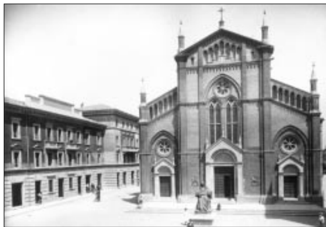
Due aspetti della chiesa parrocchiale di Crevalcore: sopra l'esterno, a fianco l'interno

«La costruzione della nostra chiesa - prosegue don Griggio - fu una grossa impresa, dettata e sostenuta da un'incrollabile fede nella Provvidenza di tutti gli abitanti di Crevalcore. I lavori infatti, iniziati appunto nel 1901, proseguirono a