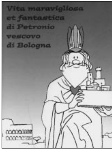
La copertina del volume sulla vita di san Petronio

Il libro propone testi semplici e rigorosi accompagnati da illustrazioni accattivanti