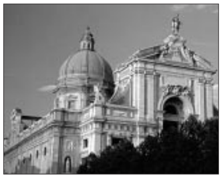
Il Santuario di S. Maria degli Angeli ad Assisi

Ogni anno la possibilità di una breve sosta per rinfrescare e aggiornare alcune nozioni teologiche importanti, e rimotivare così l'impegno pastorale, è un dono che tutti i sacerdoti do-