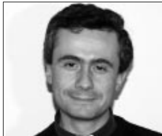
Monsignor Gabriele Cavina, rettore del Seminario arcivescovile

ca è un elemento caratteristico di questi ultimi anni: a chiedere di entrare in Seminario infatti, sono sempre più giovani che hanno già un diploma e studiano all'Università o svolgono un lavoro. L'anno di propedeutica diventa per loro un momento di orientamento, chiaro