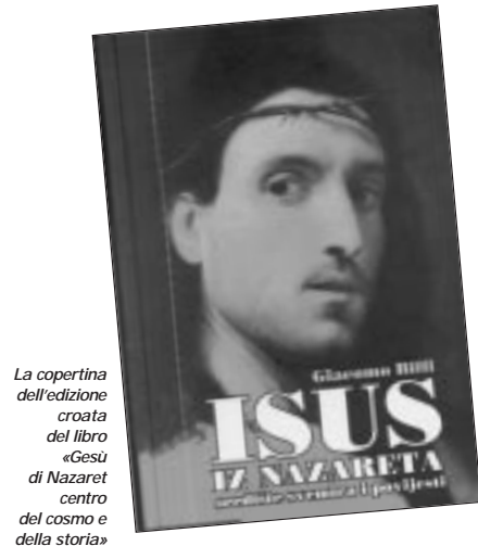
La copertina dell'edizione croata del libro «Gesù di Nazaret centro del cosmo e della storia»