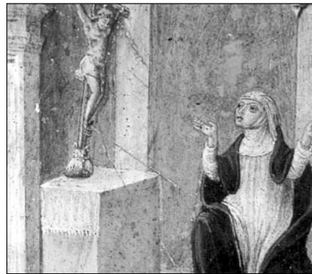
Un affresco che raffigura S. Caterina da Siena in preghiera

Cosa dice a quanti credono che Dio non risponde alla loro preghiera? Lo scoraggiamento c'è nella preghiera come in qualunque storia d'amore veramente seria. Un uomo e una donna che desiderano vivere una esperienza approfondita vivranno momenti di scoraggiamento: a ciascuno dei due, sembrerà di non essere capito, ascoltato, di parlare inutilmente. Questo perché oggi c'è una certa smania di avere risposte subito; è uno dei mali del nostro tempo segnato dalla fretta e dal bisogno di avere subito qualcosa da consumare. Una relazione seria, tanto più quella con Dio, si gioca sui tempi lun-