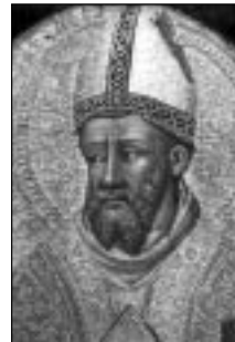
Un'immagine di S. Petronio

Oggi sappiamo di Petronio più di quanto non sapessero nel passato, possiamo dire che è esistito e che effettivamente ebbe un ruolo particolare in uno dei momenti più difficili della città. Il suo episcopato va dal 430 al 451 circa, e siamo nella fase più nefanda della decadenza dell'Impero romano, la città