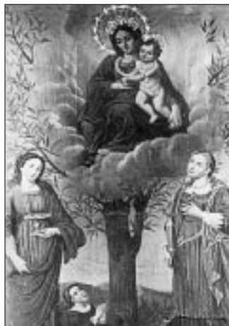
«Madonna del salice», pala d'altare della chiesa di Alberone

La Comunità del Magnificat di Castel dell'Alpi organizza due «Tempi forti di preghiera contemplativa»: il primo da martedì al 20 maggio, sul tema «Lo Spirito Santo, maestro di "Lectio divina"», il secondo dal 24 al 29 luglio sul tema «Giovane, tu sei un palpito del cuore di Dio (Giovanni Paolo II)». Per informazioni e prenotazioni: Comunità del Magnificat, tel. 053494028.