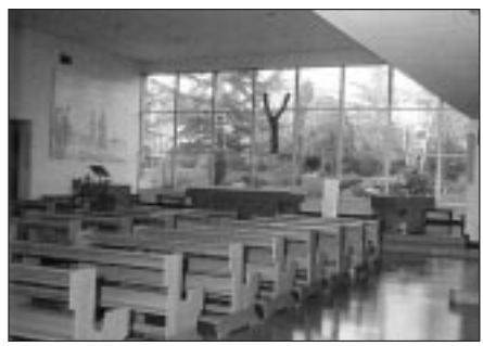
In alto, la chiesa di Bertalia; sotto, S. Giacomo fuori le Mura

nuovi insediamenti, fra cui sedi universitarie, che faranno "lievitare" la popolazione di circa diecimila persone!».