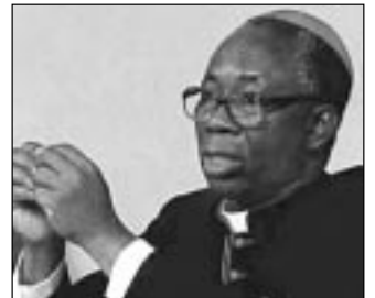
Il cardinale Francis Arinze