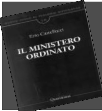
La copertina del volume

Il volume si suddivide in quattro sezioni, esponendo dati relativi ad altrettanti