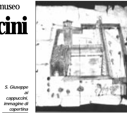
S. Giuseppe ai cappuccini, immagine di copertina