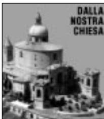
DALLA NOSTRA CHIESA