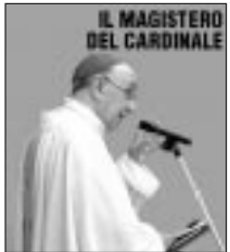
GIACOMO BIFFI *

PENTECOSTE Domenica scorsa in Cattedrale il cardinale Giacomo Biffi ha presieduto la celebrazione in occasione della solennità