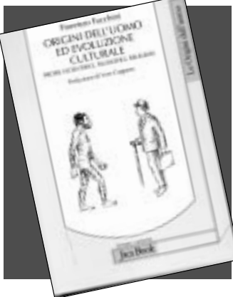
La copertina del nuovo volume del professor Fiorenzo Facchini

È il filo conduttore dell'opera e rappresenta la cultura: cultura ed evoluzione, cultura