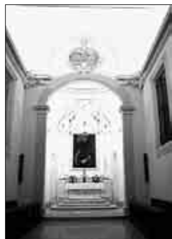
L'interno restaurato dell'Oratorio di S. Giuseppe a Baricella

S. Caterina de' Vigri (l'attuale cappella della grotta di Lourdes). Nel 1711 si aggiunse la Cappella per l'altare maggiore, nel 1755 fu ampliata la Sagrestia, che sorge, con piccolo campanile e campana, accanto alla Cappella della Grotta. Nel 1777 fu fatto il nuovo ornato di scultura all'altare maggiore. In tempi recenti, nel 1941 l'oratorio fu collegato, con una nuova entrata, alla chiesa parrocchiale. Nel 1942 infine fu costruita la Grotta di Lourdes, prolungando la Cappella di S. Caterina». «Il restauro - prosegue - ha riguardato solo l'interno: sono stati rifatti gli intonaci, gravemente compromessi dall'umidità, restau-