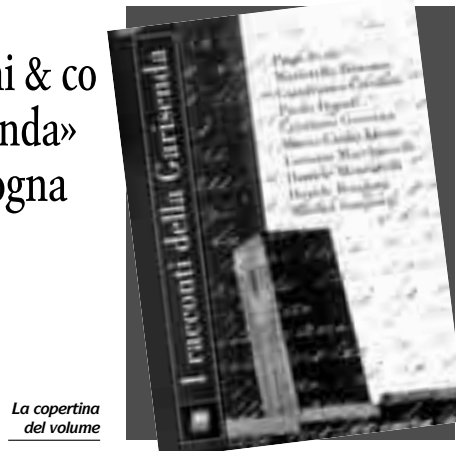
La copertina del volume