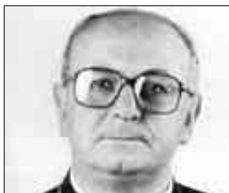
Monsignor Attilio Nicora