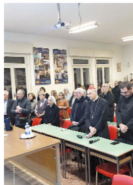
La preghiera del Vespri ha preceduto l'incontro dal titolo «Per educare un bambino occorre un villaggio», rivolto agli insegnanti del territorio alle Maestre Pie