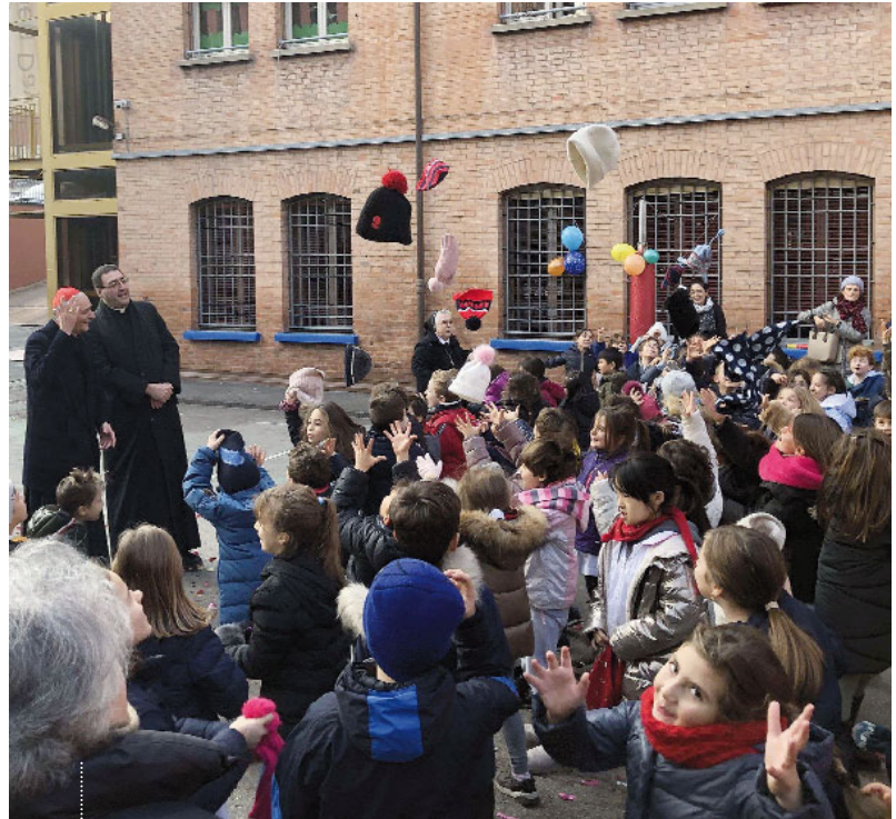
L'incontro del cardinale con gli alunni e il corpo docente della scuola primaria dell'Istituto paritario delle Maestre Pie