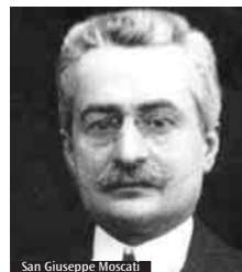
San Giuseppe Moscati