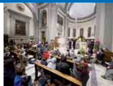
L'incontro del cardinale, nella chiesa di Santa Maria delle Grazie, con i bimbi e gli educatori del catechismo

«Siamo pronti per continuare a camminare con energia e spirito di condivisione, come accaduto nei tanti incontri»