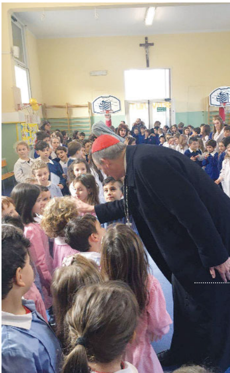
L'arcivescovo Matteo Zuppi ha incontrato gli alunni e i docenti della scuola dell'infanzia ed elementare paritaria «Sant'Anna»