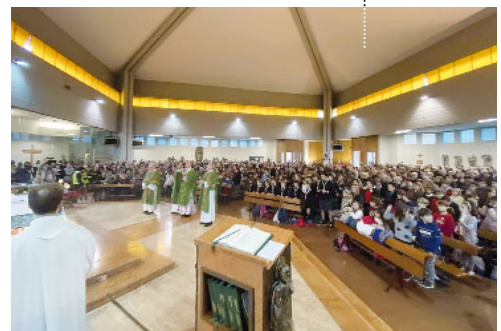
La celebrazione conclusiva della Visita alla Zona Saffi - Ravone è stata ospitata nella chiesa parrocchiale di San Giuseppe Cottolengo