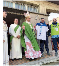
Al cardinale è stata donata una maglietta con il numero 1 della squadra «Don Orione»

comunità hanno pregato con l'arcivescovo le Lodi e i Vespri, partecipato alle celebrazioni eucaristiche e ai momenti di riflessione sul Vangelo. Diversi anche i momenti conviviali, animati da un clima informale e familiare. Nel corso della visita il cardinale ha incontrato anche il gruppo San Paolo, che riunisce disabili adulti e quest'anno festeggia i 50 anni della sua fondazione.