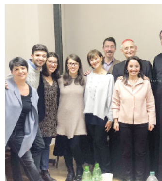
Una rappresentanza dei docenti della scuola d'infanzia e primaria paritaria «Maria Ausiliatrice e San Giovanni Bosco» visitata dal cardinale Zuppi nel pomeriggio di giovedì