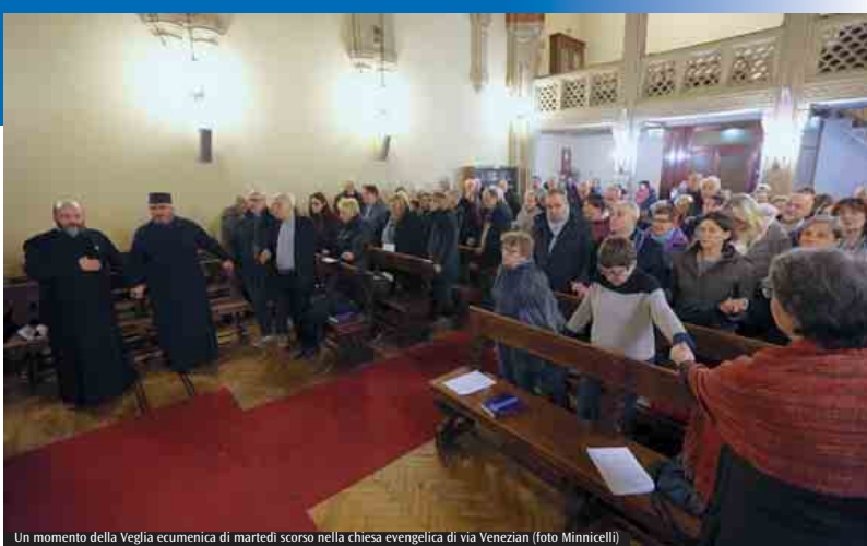
Un momento della Veglia ecumenica di martedì scorso nella chiesa evangelica di via Venezian