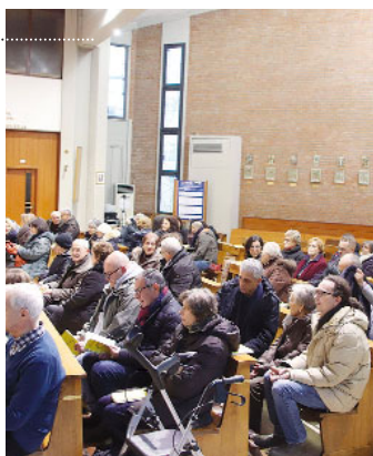
È stato dedicato ai volontari e agli ospiti delle Caritas parrocchiali l'incontro nella chiesa di Maria «Regina Mundi»