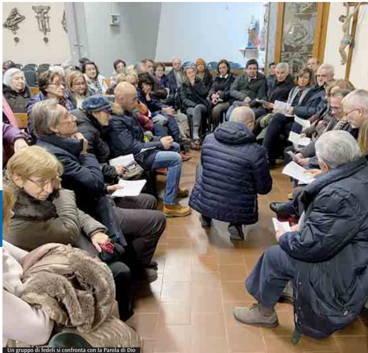
Un gruppo di fedeli si confronta con la Parola di Dio

«Il rapporto con le sacre pagine – spiegano dalla Piccola famiglia dell'Annunziata – non può essere un legame puramente intellettuale. Non solo il pensiero ma anche le scelte quotidiane devono essere ispirate alla Bibbia»