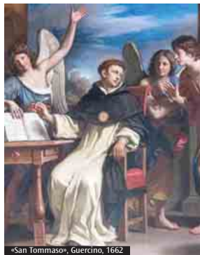
«San Tommaso», Guercino, 1662