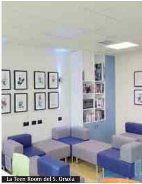
La Teen Room del S. Orsola

C' è profumo di nuovo al quinto piano della Pediatria-Pession del Sant'Orsola. Qui Ageop Ricerca, insieme ai suoi tanti amici, ha inaugurato la prima Teen Room, uno spazio specifico per gli adolescenti che stanno affrontando un percorso nel reparto di Oncematologia pediatrica. Un desiderio espresso, in una canzone, dagli stessi ragazzi che ha preso la forma di divani e muri grazie alla campagna #Lottoanchio2019, lanciata un anno fa da Ageop Ricerca e dagli adolescenti dell'Oncologia pediatrica per la Giornata mondiale di lotta al cancro infantile. Partita con l'obiettivo di raccogliere 40000 euro per la ristrutturazione e gli arredi, la campagna ha superato