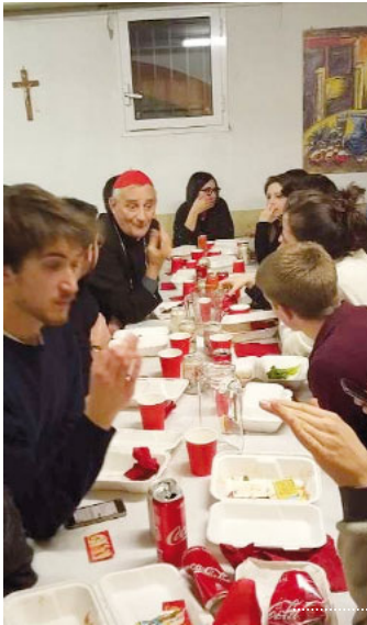
Il pomeriggio del sabato è stato dedicato ai giovani della Zona pastorale con un incontro, una cena condivisa in oratorio e la Veglia serale nella chiesa di San Paolo di Ravone