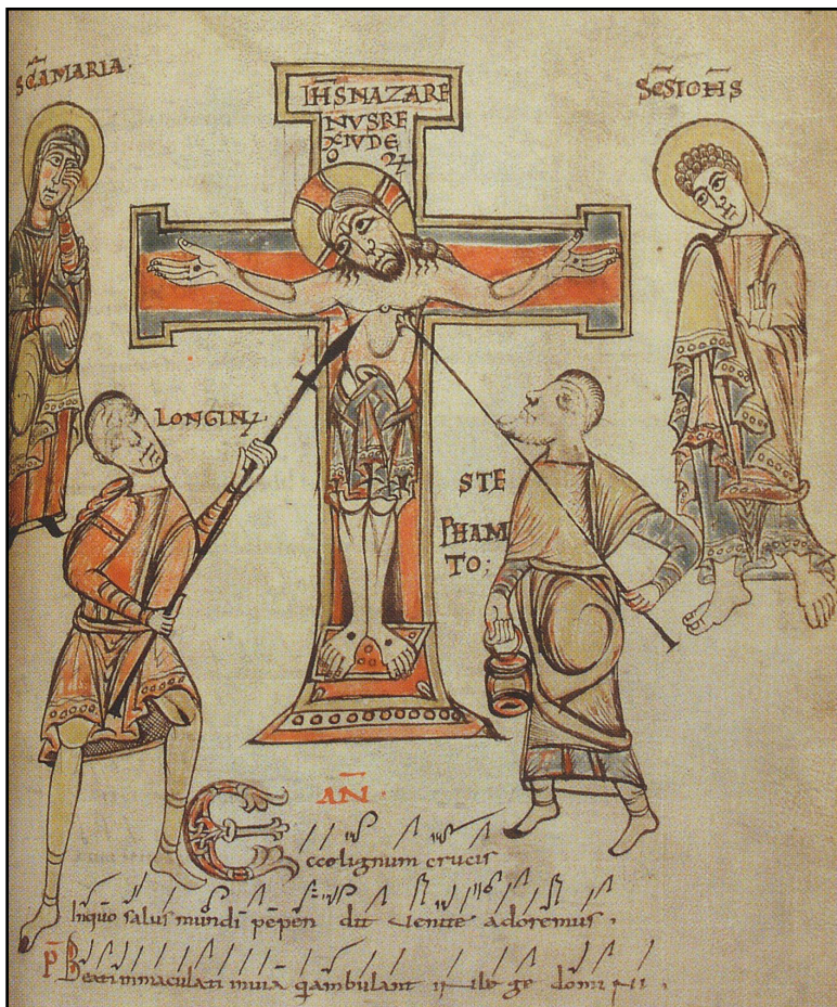
Codice Angelica 123 (Bologna XI secolo)

del nostro Signore Gesù Cristo morto, sepolto e risorto